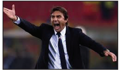
მოამზადა ბექა გოგინაშვილმა

ალვერი მზად არის, მანჩესტერ იუნაიტედს სათავეში ჩაუდგეს, მაგრამ მალე ხელფასს ითხოვს და მოლაპარაკებები გრძელდება.