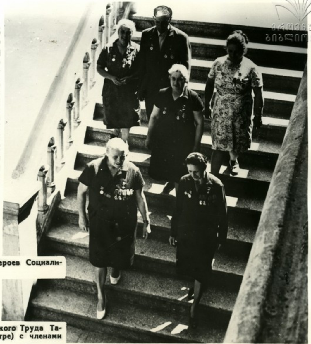
Группа чаеводов—Героев Социалистического Труда

Шромский колхоз славится ветеранами чайного производства, добивающимися замечательных успехов. Их имена хорошо знают во всей республике. Многие чаеводы колхоза удостоены звания Героя Социалистического Труда, награждены орденами и медалями.