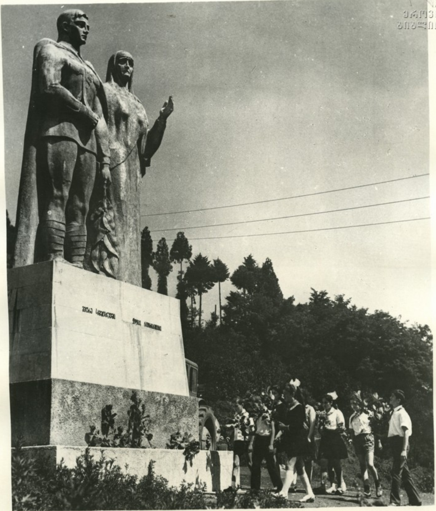
Крепкая братская дружба, экономическая взаимопомощь, духовная общность связывают шромцев с украинскими земледельцами из Генического района. И как символ дружбы стоит в центре Шрома памятник украинскому солдату и грузинской матери.