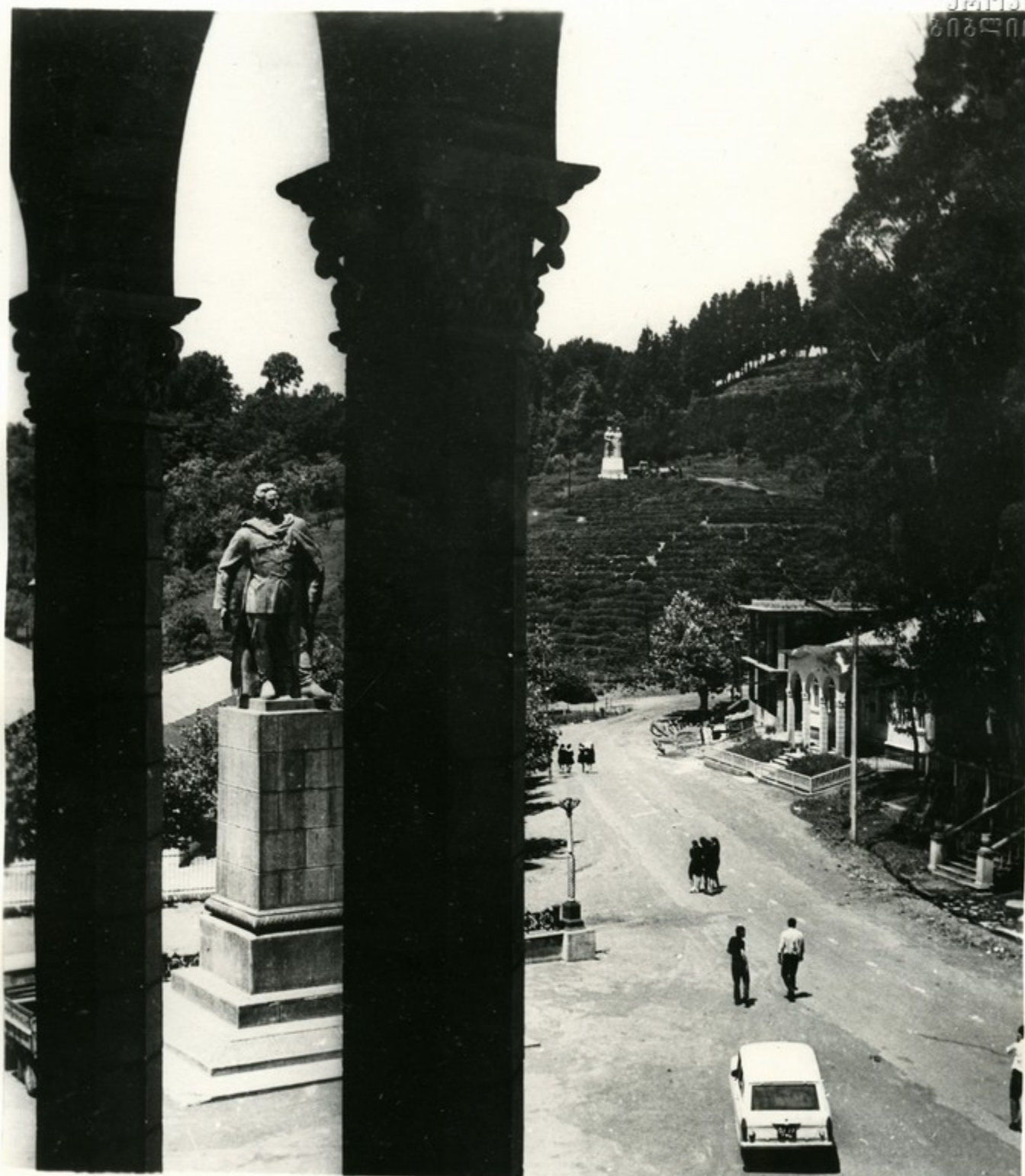
С особым чувством трудятся шромские колхозники в год 50-летия образования Союза ССР. Своему счастью, достатку, благополучию они обязаны родной Коммунистической партии, Советскому правительству. На снимке: так выглядит сейчас село Шрома.