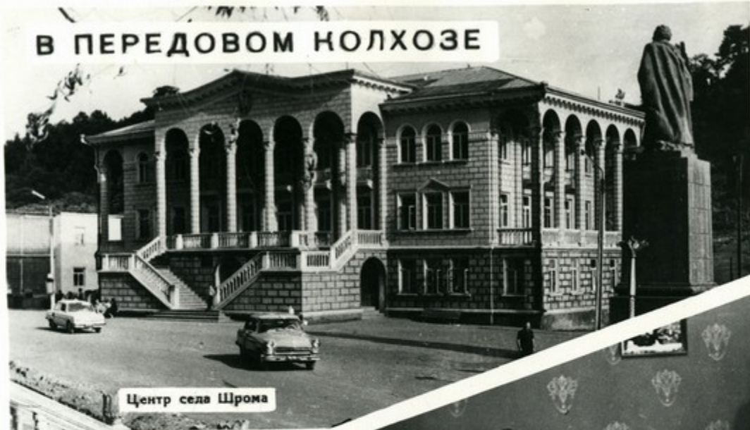
Центр села Шрома

Эта фотовыставка посвящена сегодняшнему дню одного из лучших хозяйств Грузии, колхозу, на знамени которого — орден „Знак почета“.