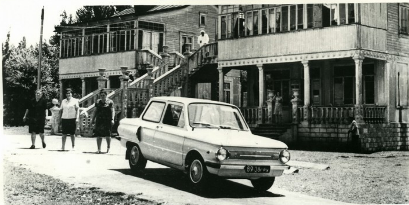
Вид на колхозную амбулаторию