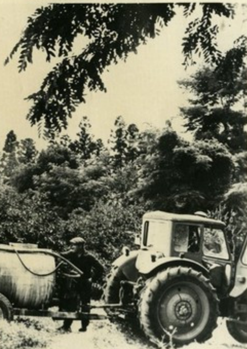
Опрыскивание citrusовой рощи ядохимикатами

На 194 гектарах в Шрома возделываются citrusовые плоды. В юбилейном году пя- тилетки citrusоводы обеща- ют продать государству 350 тонн мандаринов, апельсинов и лимонов.