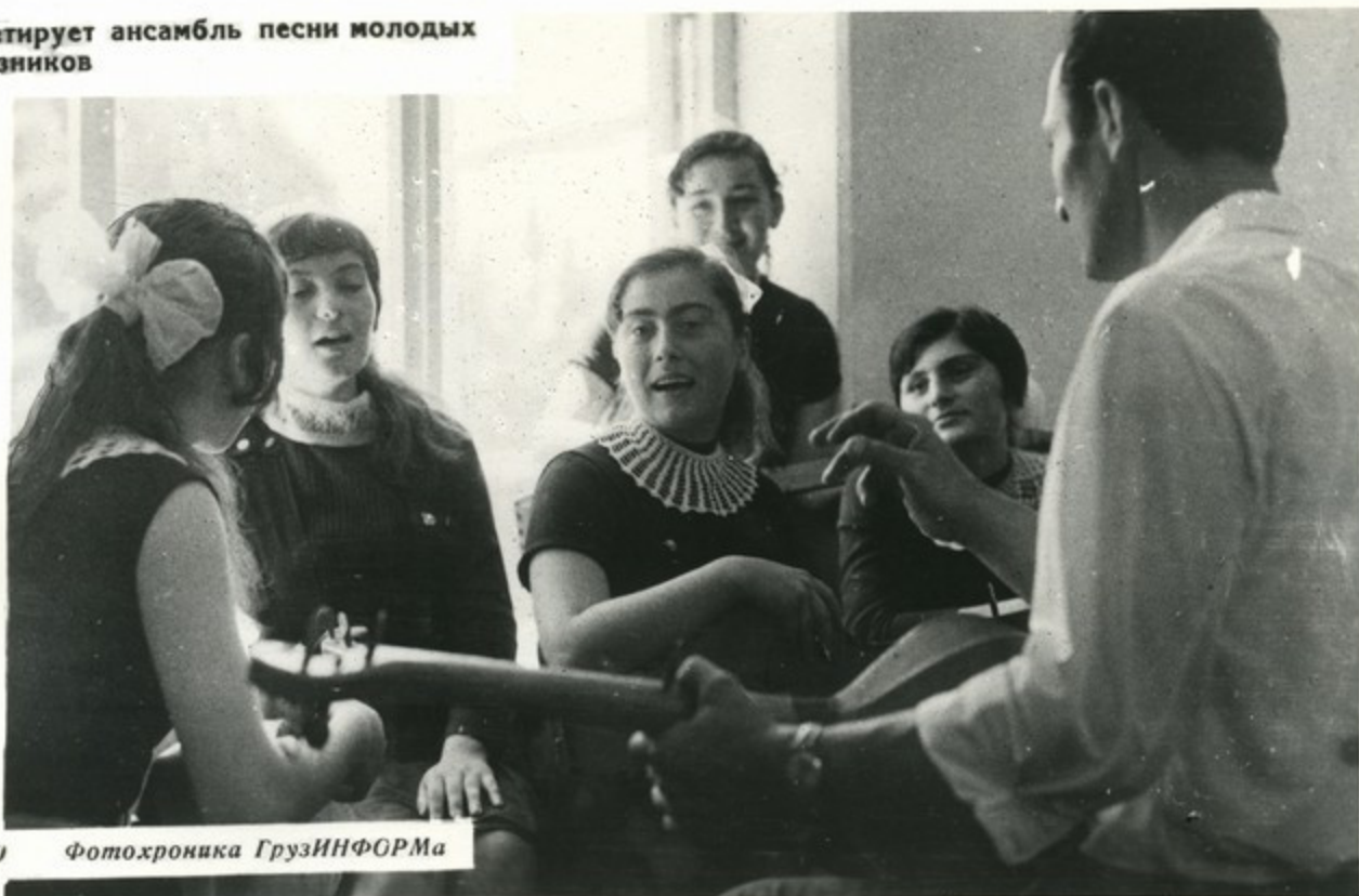
Репетирует ансамбль песни молодых колхозников

В Шрома насчитывается 3840 жителей, в том числе около 1550—молодежь до 30 лет. В хорошем селе остаются молодые кадры!