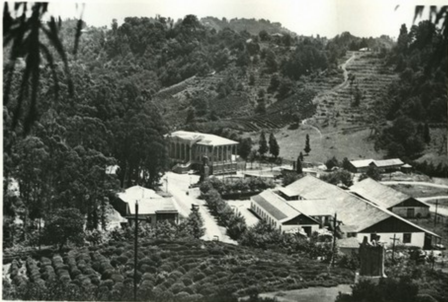
Один из уголков села