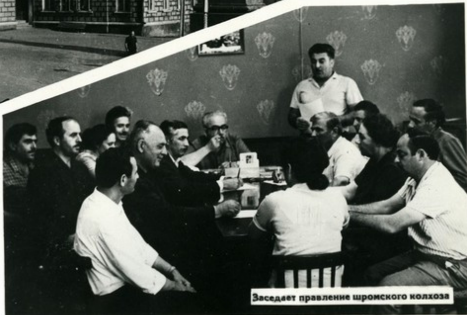
Заседает правление шромского колхоза

О славных делах тружеников колхоза имени С. Орджоникидзе села Шрома Махарадзевского района известно далеко за пределами нашей республики. Расположенный в субтропической зоне, колхоз дает Родине дары вечнозеленых плантаций — чай и цитрусы, из года в год наращивая выпуск продукции, получая миллионные доходы.