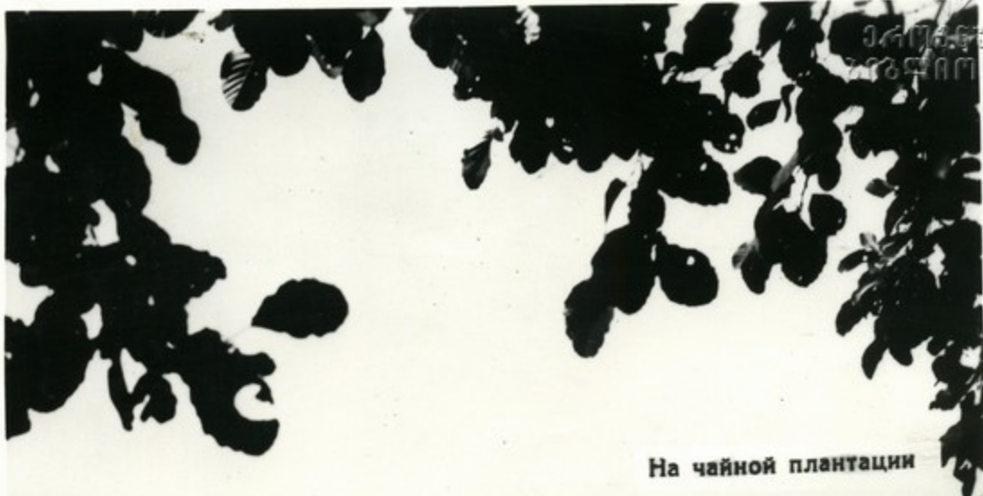
На чайной плантации