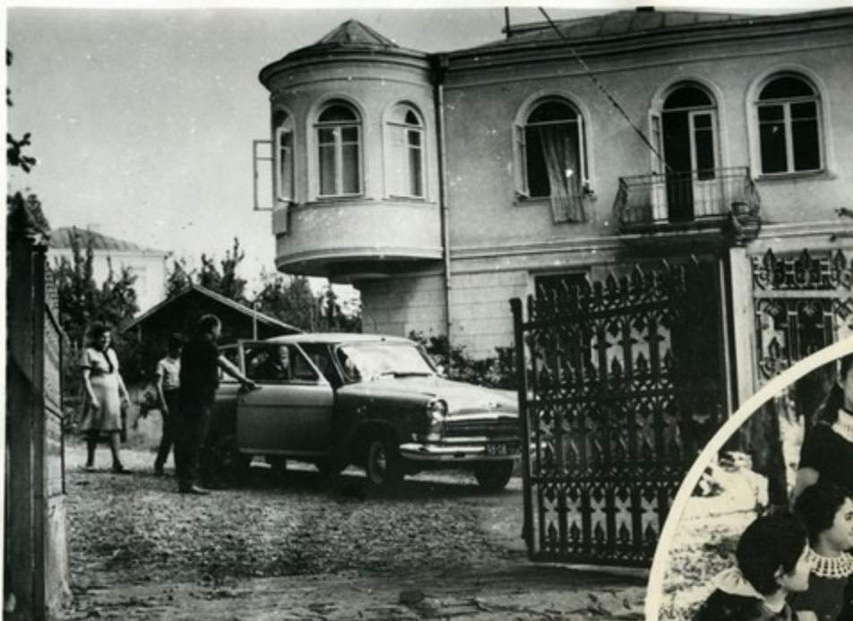
Так выглядит дом колхозника С. Хо- мерики

Зажиточно живут колхозники из Шрома. Разве сравнить сегодня дома земледельцев с теми, что были в 1931 году, когда организовался колхоз имени С. Орджоникидзе! В прошлом году доход колхозной семьи составил примерно 1800 рублей.