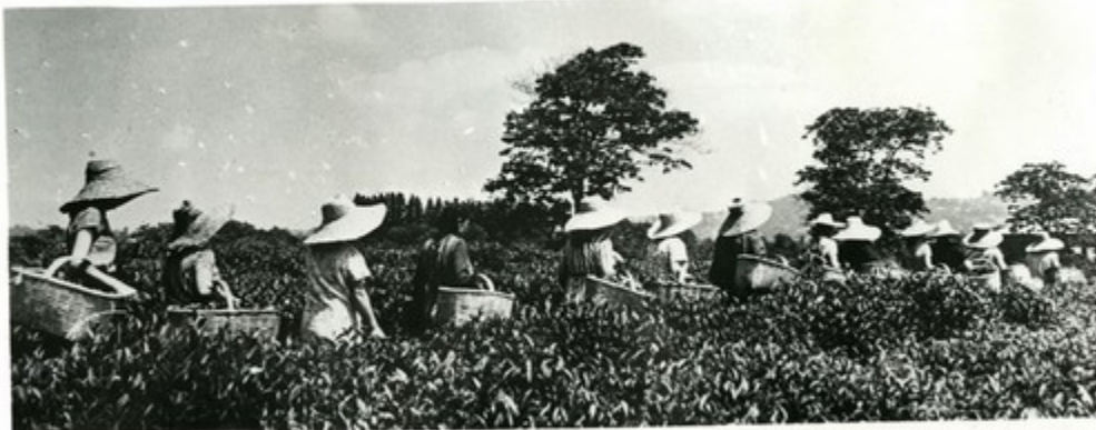
Чаеводы идут за „зеленым золотом“

Грузинские кинодокументалисты снимают фильм о делах передового колхоза