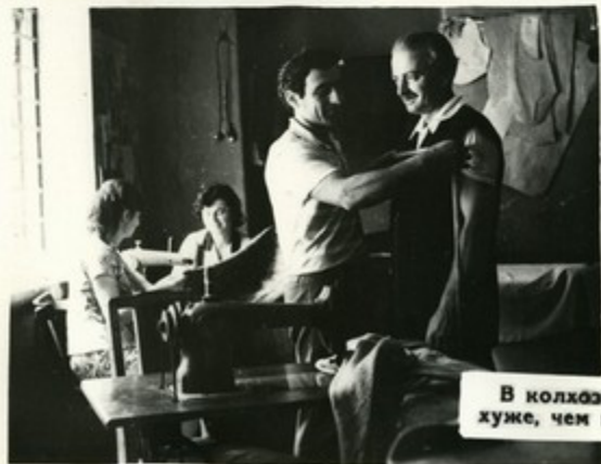
В колхозном ателье мод шьют не хуже, чем в городском!

Только за последние два года в селе построены: двухэтажный универмаг, новый школьный корпус со спортивным залом, комбинат бытового обслуживания, вошла в строй колхозная АТС.