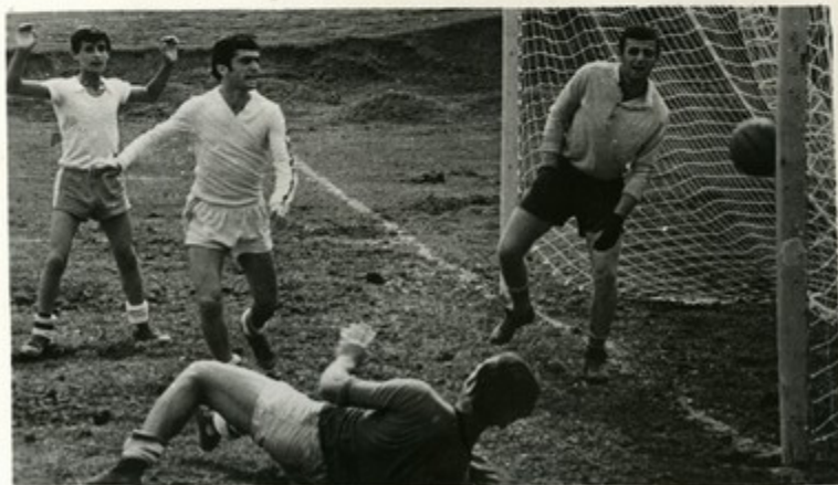
Лист 24 Фотохроника ГрузинФОРМа

На снимках: тренируются шромские спортсмены.