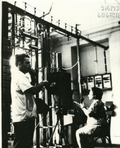
В зале АТС

Только за последние два года в селе построены: двухэтажный универмаг, новый школьный корпус со спортивным залом, комбинат бытового обслуживания, вошла в строй колхозная АТС.