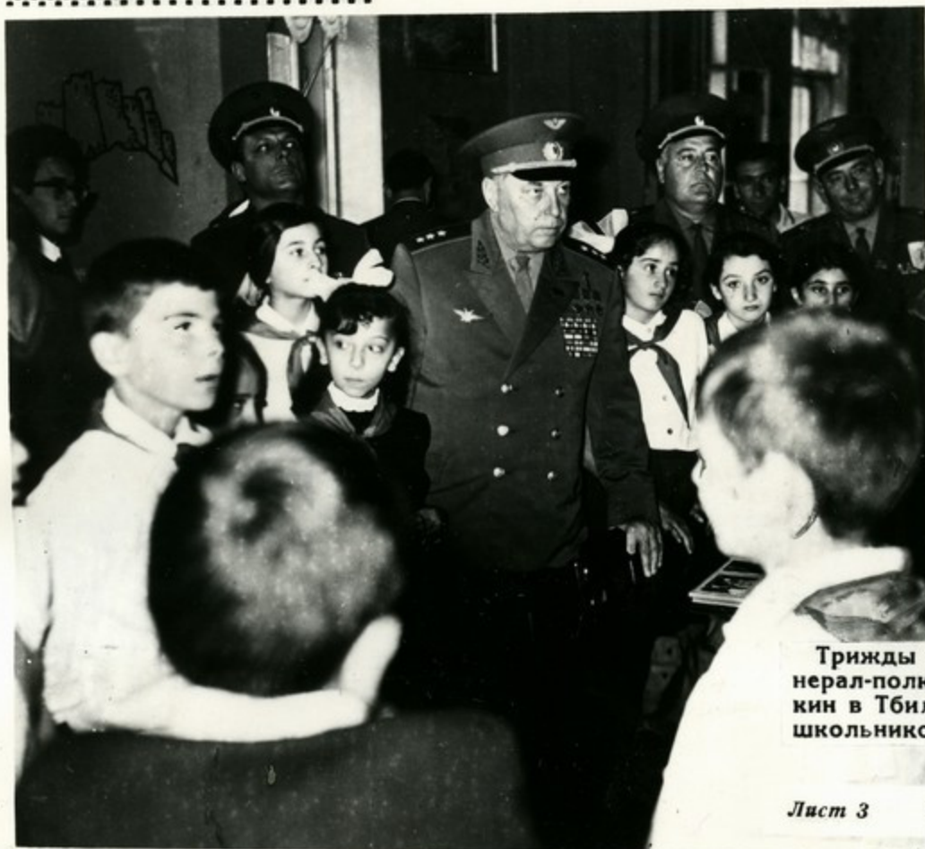
Трижды Герой Советского Союза генерал-полковник авиации Н. Покрышкин в Тбилисском Дворце пионеров и школьников

Республиканский Дворец пионеров и школьников имени Б. Дзnelадзе — очаг коммунистического воспитания подрастающего поколения. В залах и кабинетах, лабораториях и рабочих комнатах постоянно занимаются различные кружки и секции, устраиваются встречи, вечера, выставки и т. д.