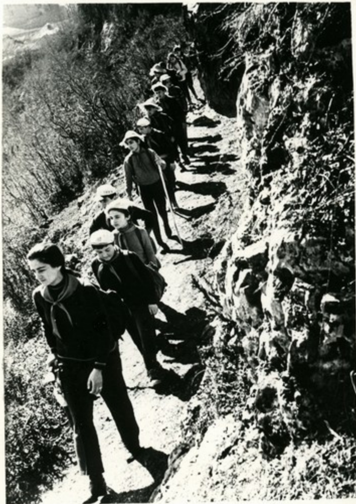
Пионеры во время похода

Кружок юных краеведов создан при Чнатурской средней школе № 3. Члены кружка к 50-летию пионерской организации организуют походы с целью собирания новых материалов для экспозиции школьного музея.