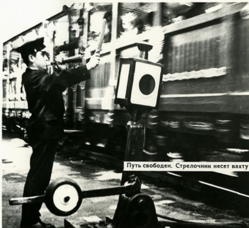
Путь свободен. Стрелочник несет вахту

Первая детская железная дорога в нашей стране была построена в Тбилиси 35 лет назад. С тех пор она обслужила миллионы юных пассажиров. Эту дорогу обслуживают пионеры-отличники школ города Тбилиси. Они работают машинистами, проводниками, стрелочниками, дежурными по станции, начальниками станций.