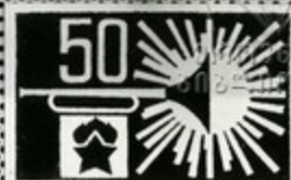
У памятника защитникам города

В городе-герое Волгограде был проведен Всесоюзный слет юных интернационалистов. В нем приняла участие и делегация пионеров Грузии.