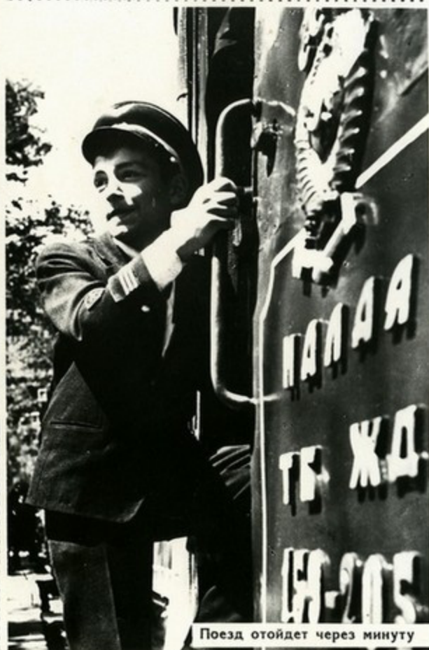
Поезд отойдет через минуту