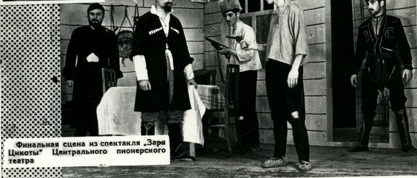
Финальная сцена из спектакля „Заря Цикоты“ Центрального пионерского театра