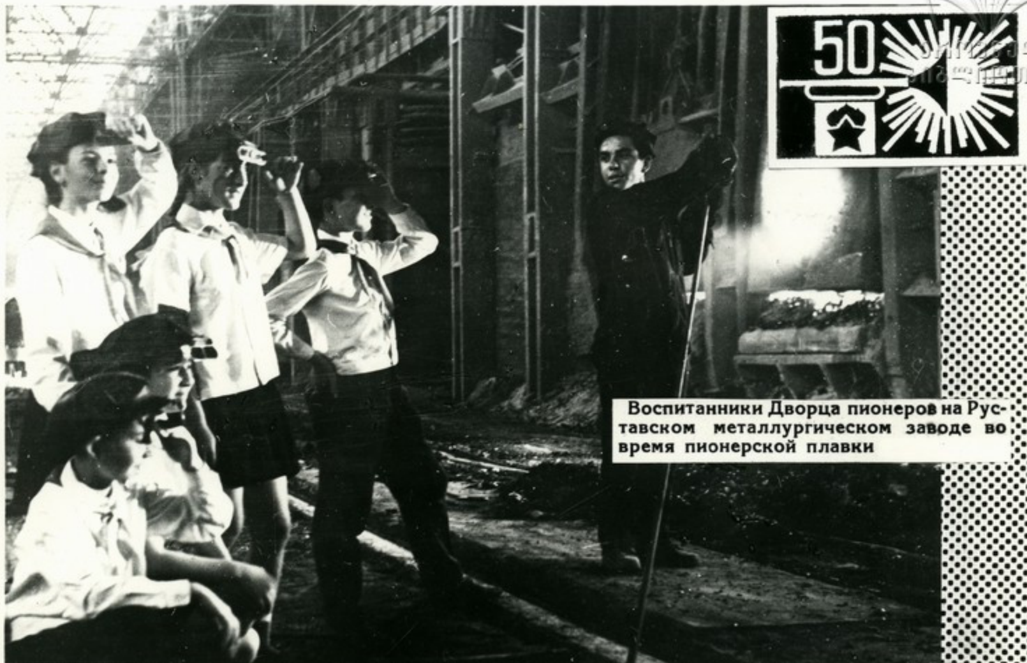
Воспитанники Дворца пионеров на Руставском металлургическом заводе во время пионерской плавки

Посещение пионерами передовых промышленных предприятий — своеобразное приобщение и подготовка их к будущей трудовой деятельности, к самостоятельной жизни.