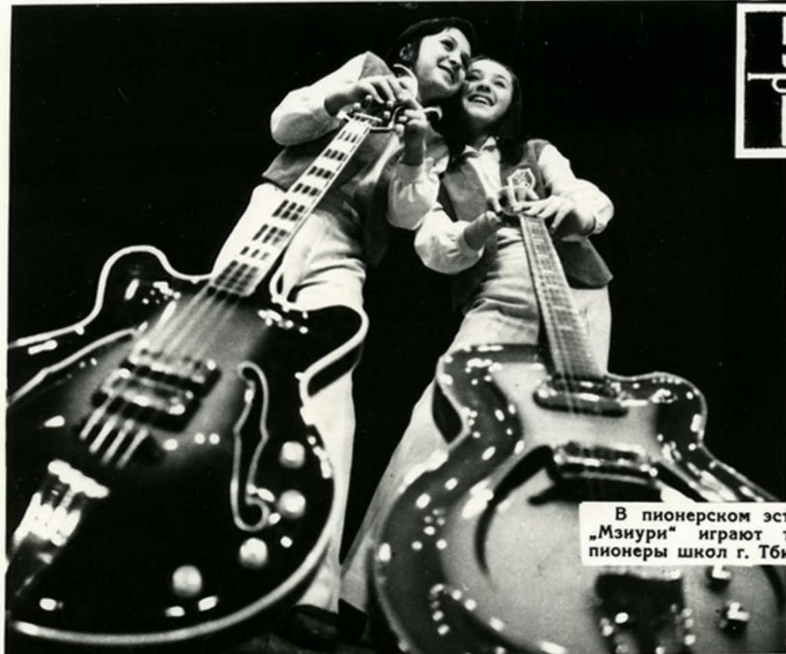
В пионерском эстрадном оркестре „Мзиури“ играют только девочки—пионеры школ г. Тбилиси

Клуб искусства Тбилисского Дворца пионеров и школьников объединяет юных любителей пения и музыки.