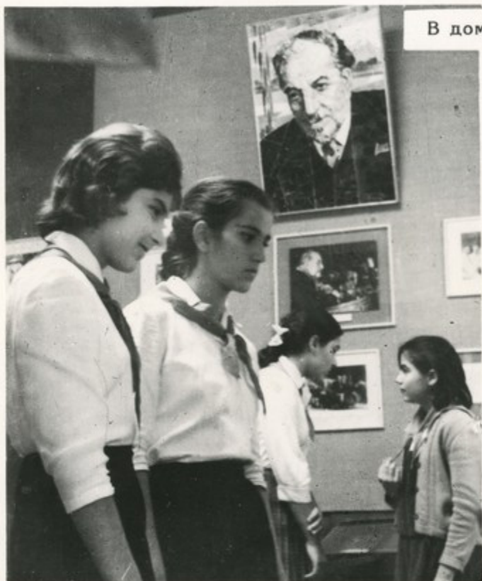
В доме-музее Ав. Исаакяна

С самых ранних лет приобщаются к прекрасному советские школьники. Они учатся петь и танцевать, рисовать и играть на музыкальных инструментах. К их услугам богатства музеев, картинных галерей, библиотек.