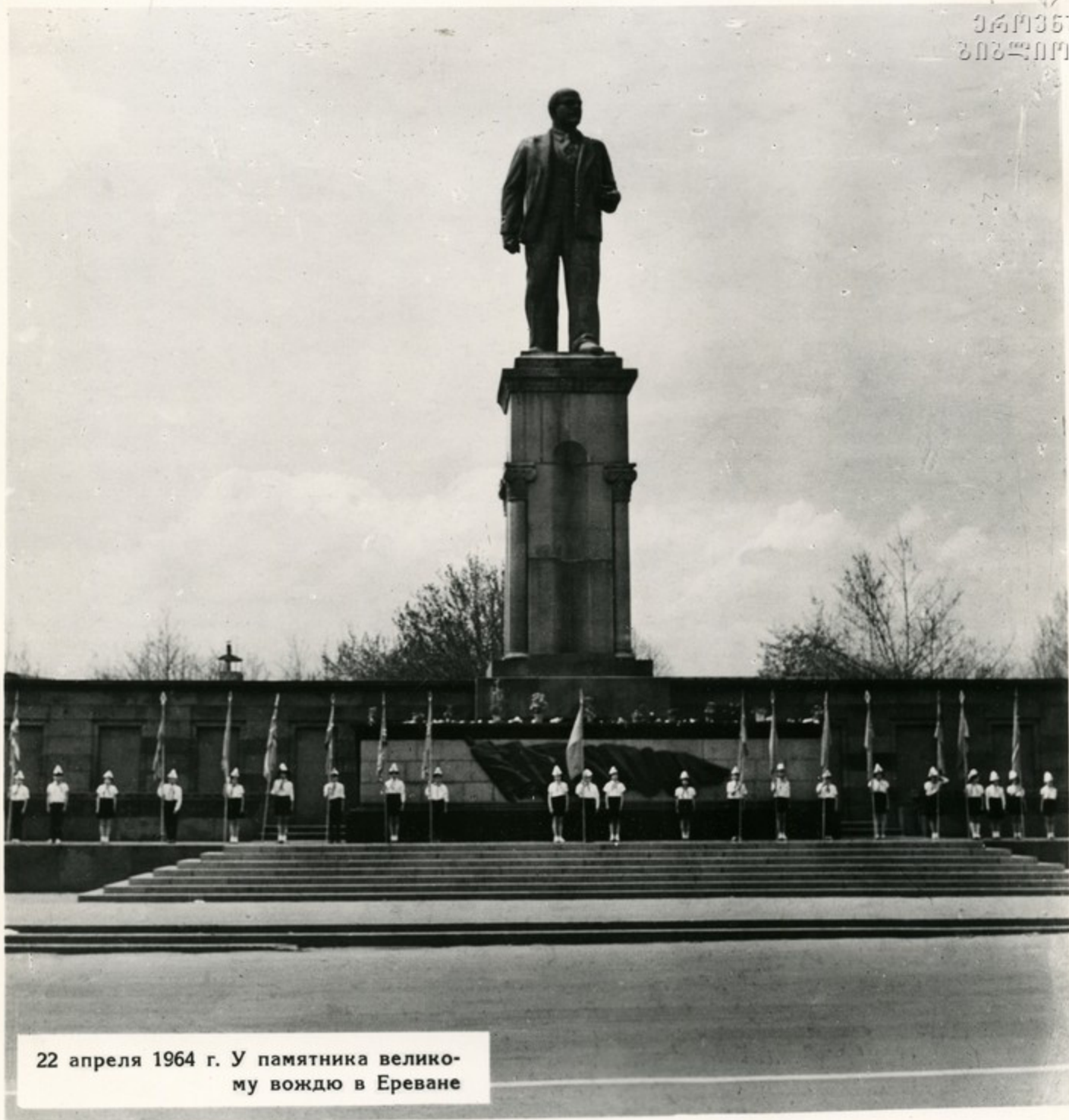
22 апреля 1964 г. У памятника великому вождю в Ереване

200 тысяч ребят—такова замечательная армия пионеров нашей республики. Каждый год, в день рождения В. И. Ленина, они выходят на торжественную линейку, чтобы рапортовать Родине о своих успехах в учебе и труде, многих хороших делах и начинаниях.