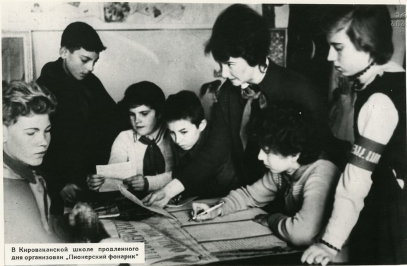
В Кироваканской школе продленного дня организован «Пионерский фонарик»

Яркими лучами вспыхнули в школах республики «Пионерские фонарики» — боевые помощники прожектористов заводов, фабрик, колхозных полей. «Пионерские фонарики» борются с нарушителями дисциплины, строго следят за сохранностью школьного инвентаря и общественной собственности.