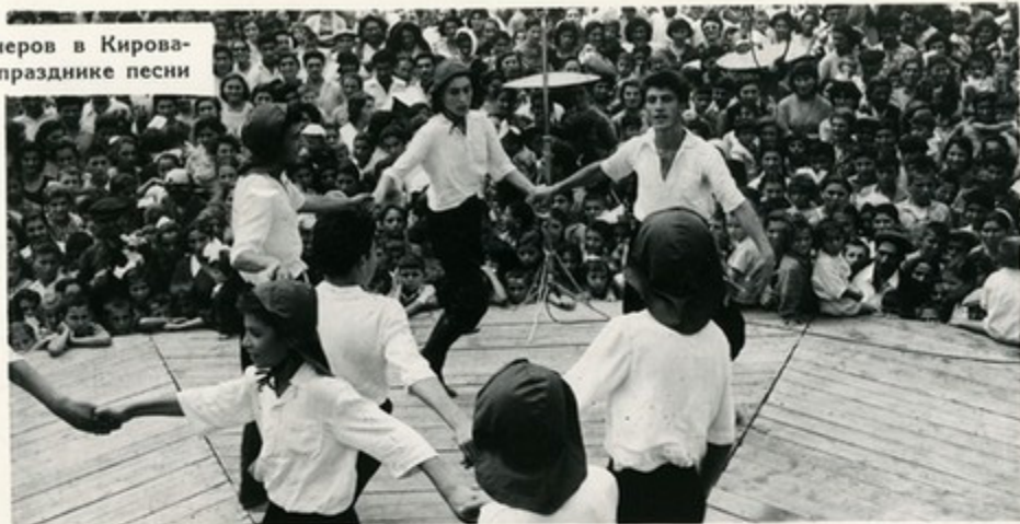
Танцоры дворца пионеров в Кировакране на празднике песни

Во всех городах и районных центрах Армении действуют Дворцы и Дома пионеров и школьников. Самый большой из них находится в Ереване. Его 204 кружка посещают 2800 детей.