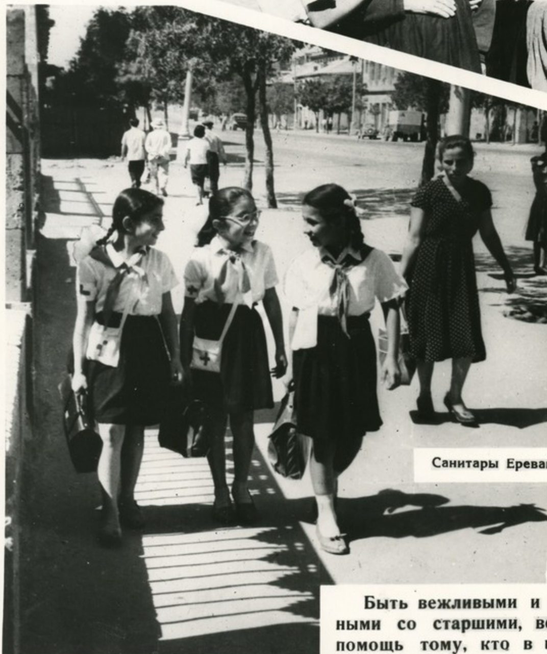
Санитары Ереванской школы № 18

Быть вежливыми и предупредительными со старшими, всегда оказывать помощь тому, кто в ней нуждается—таков закон юных тимуровцев.