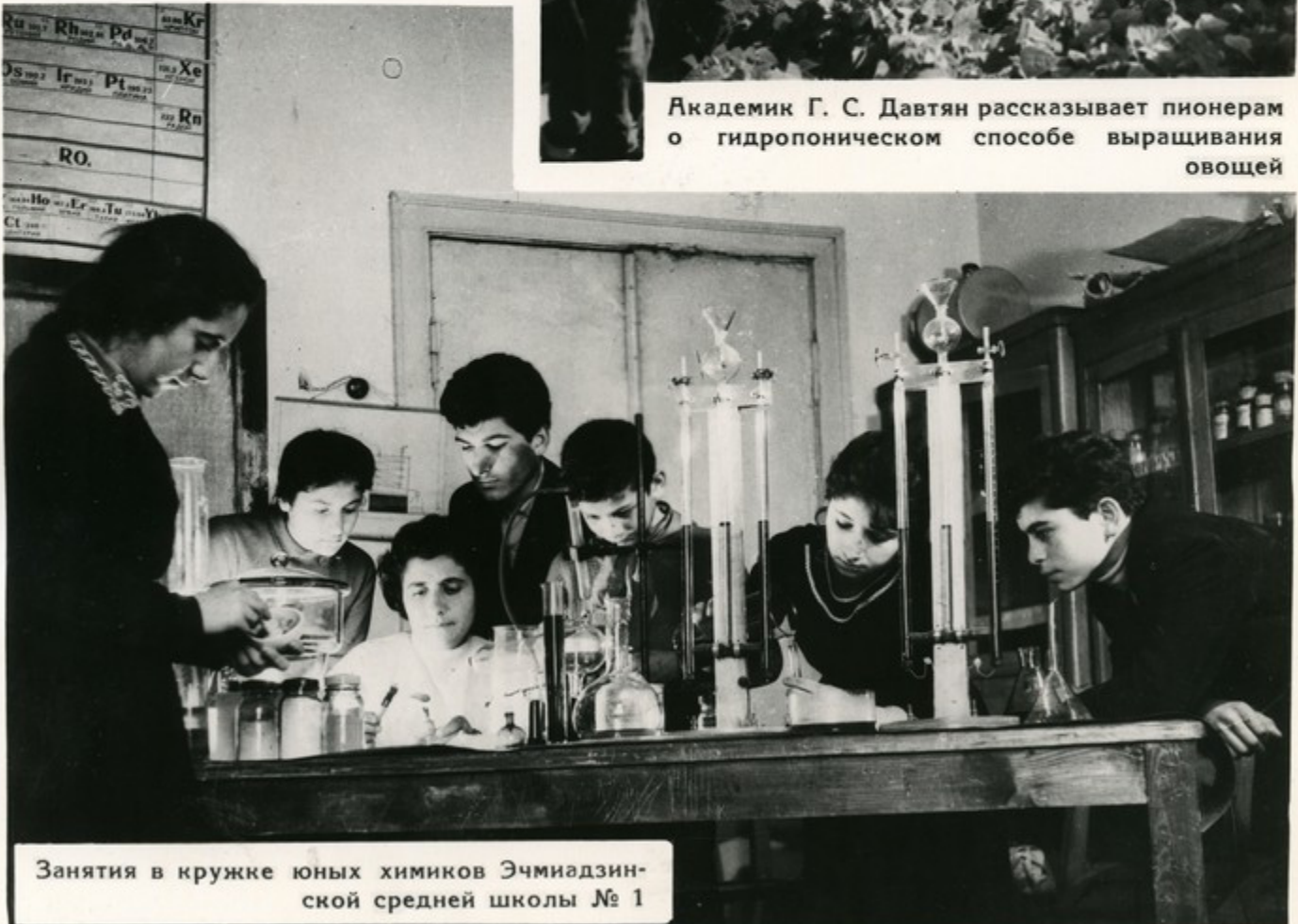
Занятия в кружке юных химиков Эчмиадзинской средней школы № 1