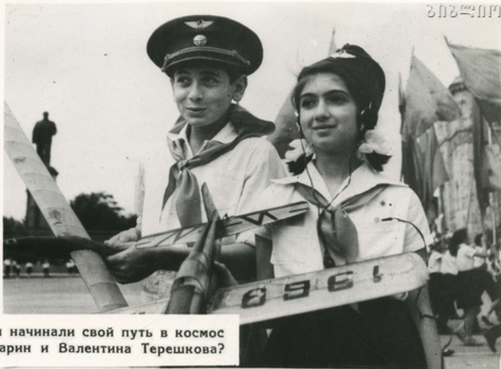
Не так ли начинали свой путь в космос Юрий Гагарин и Валентина Терешкова?

Авиамоделизм стал одним из любимых занятий многих пионеров республики. Созданные их руками крылатые модели — это первые шаги к конструированию быстроходных лайнеров, к искусству водить самолеты.