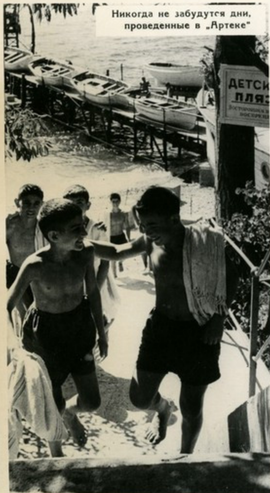
Никогда не забудутся дни, проведенные в „Артеке“