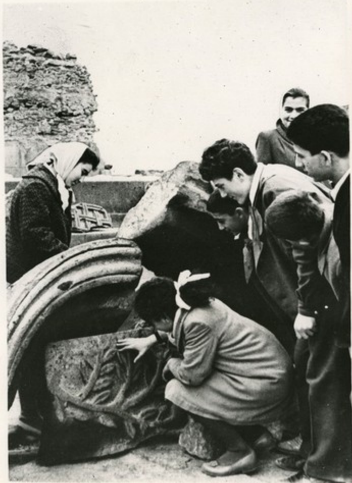
Пионеры Ереванской школы имени Орджоникидзе осматривают исторические памятники Звартноца