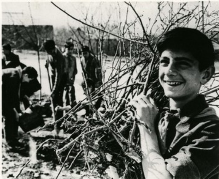
За посадкой деревьев

Замечательную работу по украшению и благоустройству городов и сел республики проводят пионеры. Сотни гектаров зеленых насаждений, огромное количество декоративных цветов выращено ими.