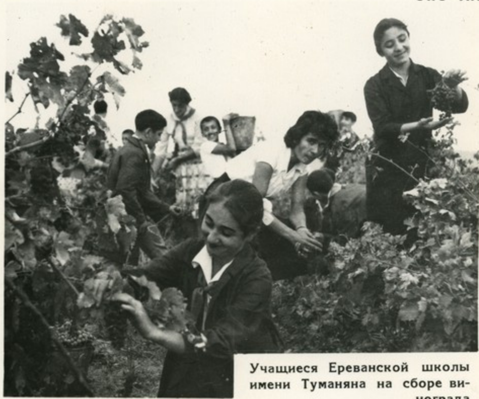
Учащиеся Ереванской школы имени Туманяна на сборе винограда

Вместе со своими старшими товарищами пионеры участвуют во всенародной борьбе за изобилие. Они не только помогают колхозникам, но и получают трудовые навыки, приобретают специальности. В 1963 году члены ученических производственных бригад обработали 2275 гектаров посевной площади.