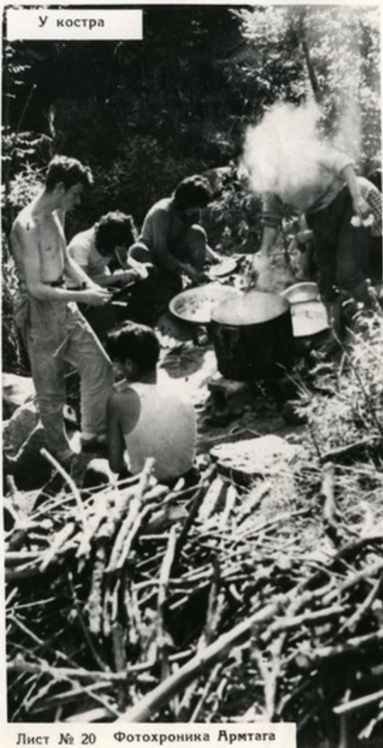
Лист № 20

Что может быть увлекательнее путешествий по родному краю, ярких ночных костров на привалах! С наступлением лета тысячи пионеров отправляются в дальние походы. На туристских тропах вырабатываются выносливость, смелость, умение всегда прийти на помощь товарищу.