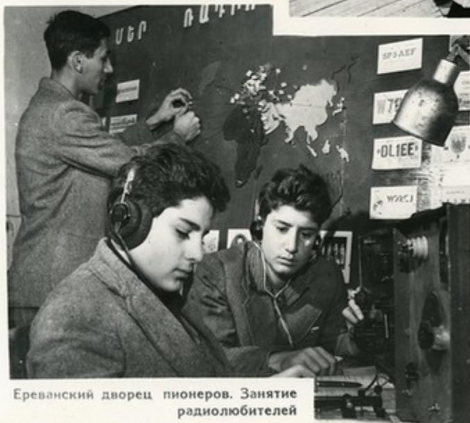
Ереванский дворец пионеров. Занятие радиолюбителей

Во всех городах и районных центрах Армении действуют Дворцы и Дома пионеров и школьников. Самый большой из них находится в Ереване. Его 204 кружка посещают 2800 детей.