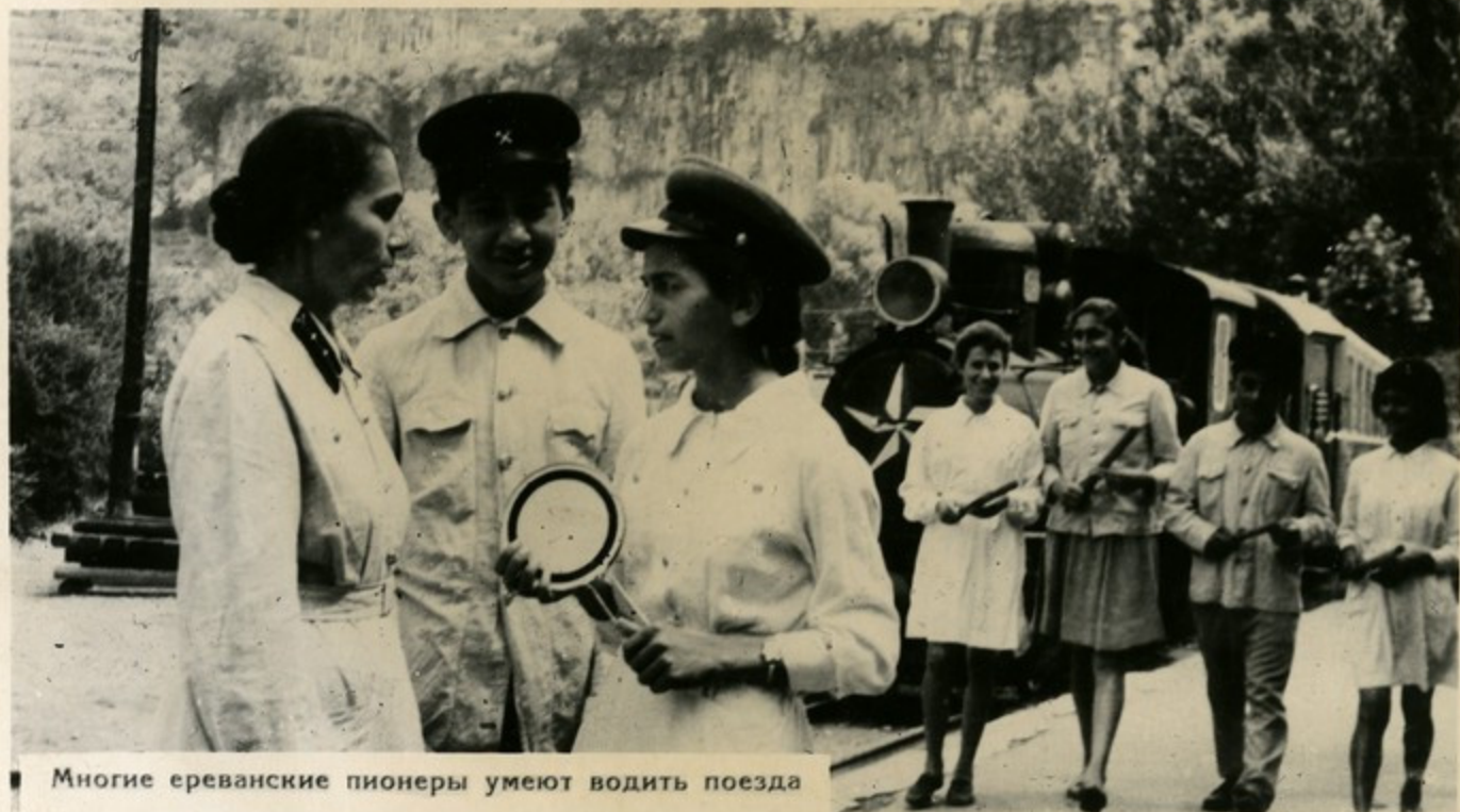
Многие ереванские пионеры умеют водить поезда

Все возможности предоставлены нашим школьникам для овладения трудовыми навыками. Только за последние годы школьные мастерские получили около 5 тысяч металлорежущих и деревообрабатывающих станков, столько же верстаков, 3 тысячи швейных машин. Много тракторов и комбайнов передано учащимся сельских районов республики