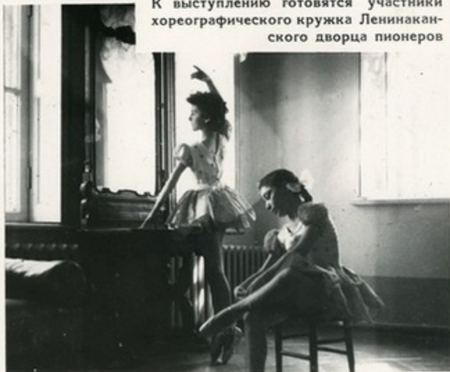
К выступлению готовятся участники хореографического кружка Ленинанканского дворца пионеров