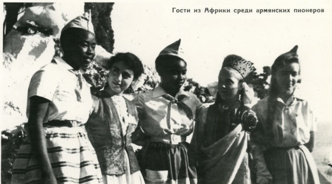
Гости из Африки среди армянских пионеров

Тесные узы дружбы связывают армянских пионеров с ребятами братских республик Советского Союза, многих зарубежных стран. Они обмениваются письмами и подарками, делятся своими планами и мечтами. Интересными всегда бывают вечера, проводимые в „Клубах интернациональной дружбы“.