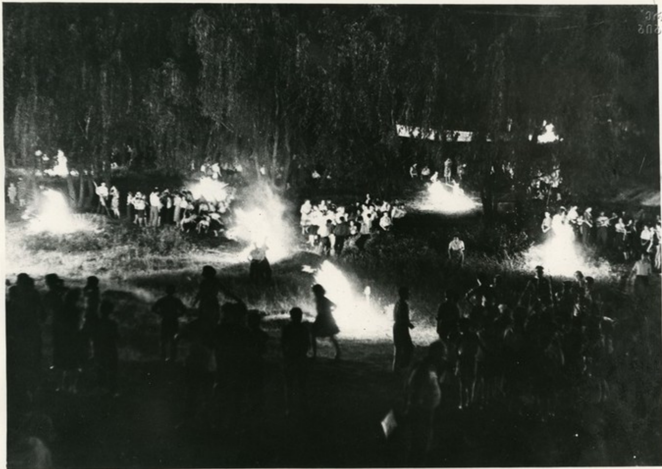
Ярко пылают костры, зажженные в честь традиционного праздника пионеров Армении.