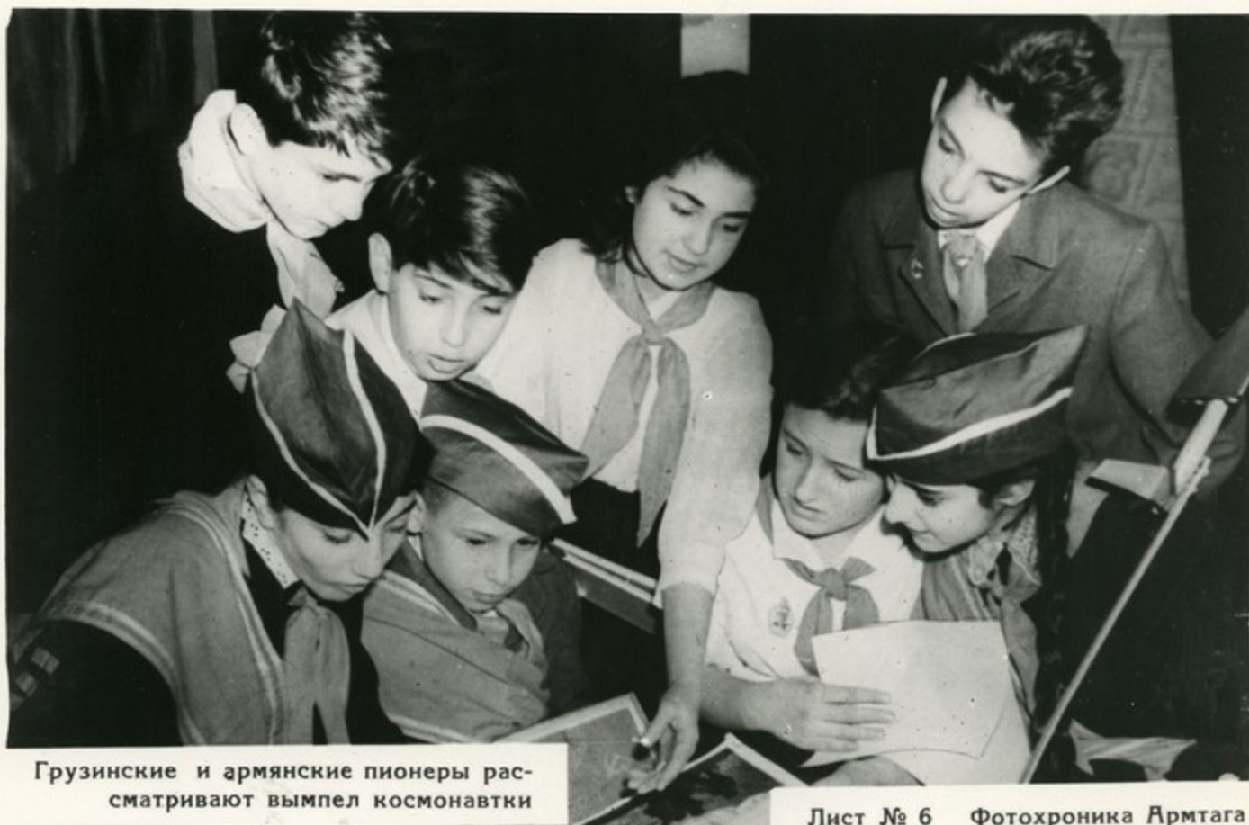
Грузинские и армянские пионеры рассматривают вымпел космонавтки