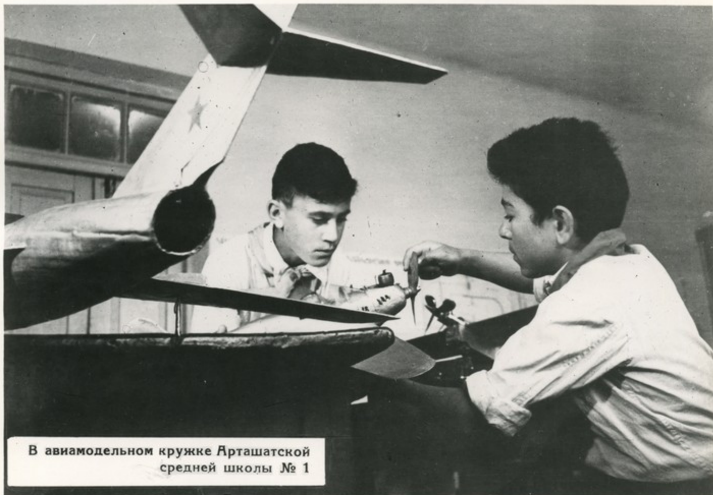
В авиамodelьном кружке Арташатской средней школы № 1