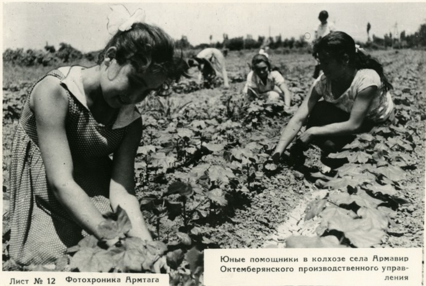
Юные помощники в колхозе села Армавир Октябрьянского производственного управления