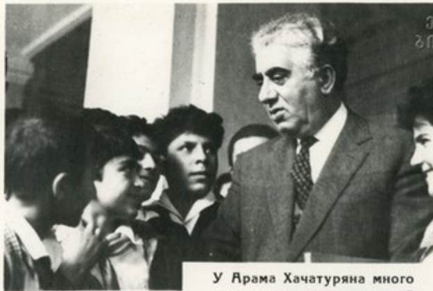
У Арама Хачатуряна много юных почитателей

Замечательной традицией стали встречи пионеров со знатыми людьми страны, выдающимися писателями, композиторами, художника- ми. И часто нелегко бывает им отвечать на многочис- ленные вопросы любозна- тельных ребят.