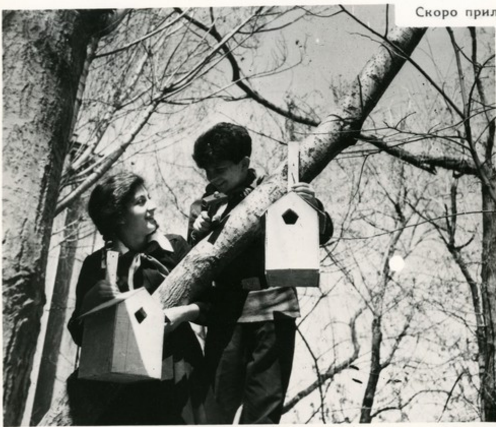
Скоро прилетят скворцы

Пионер—самый верный друг пернатых. Тысячи школьников Армении ежегодно участвуют в проведении традиционного дня птиц —большого и интересного праздника весны.