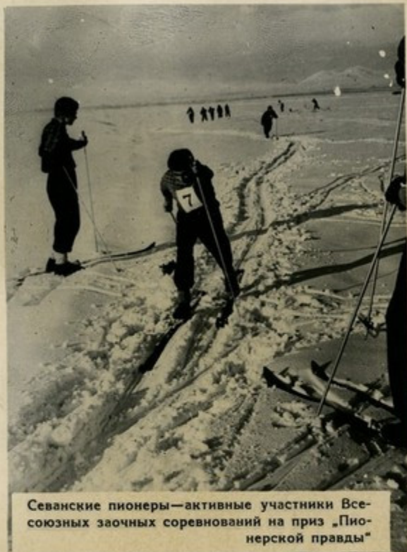
Севанские пионеры—активные участники Всесоюзных заочных соревнований на приз «Пионерской правды»

Настоящий пионер должен быть хорошим физкультурником. Сейчас 8630 мальчиков и девочек имеют спортивные разряды. В 1963 году нормы БГТО выполнили более 17 тысяч школьников.