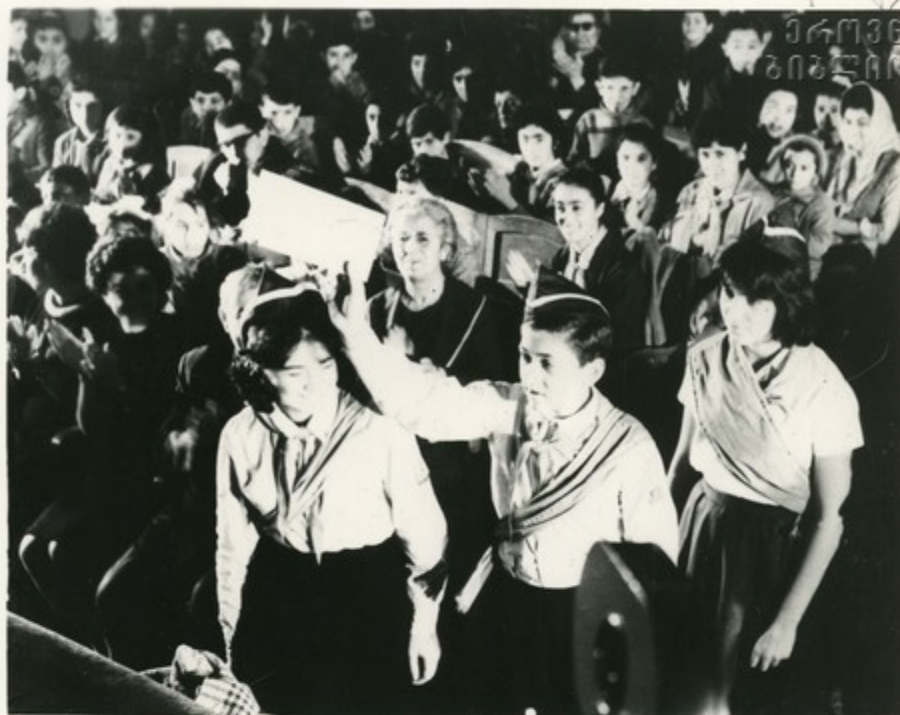
Драгоценная реликвия доставлена в Ереванский дворец пионеров и школьников

По всей стране совершил путешествие вымпел, который Валентина Николаева – Терешкова брала с собой в космический полет. Первым его хозяином в Армении стал пионерский отряд средней школы города Алаверди. Принимая эстафету, ребята сделали в альбоме такую запись: „Дорогая Валентина Николаева-Терешкова! Наш отряд всегда впереди. Приезжайте в наш солнечный край“.