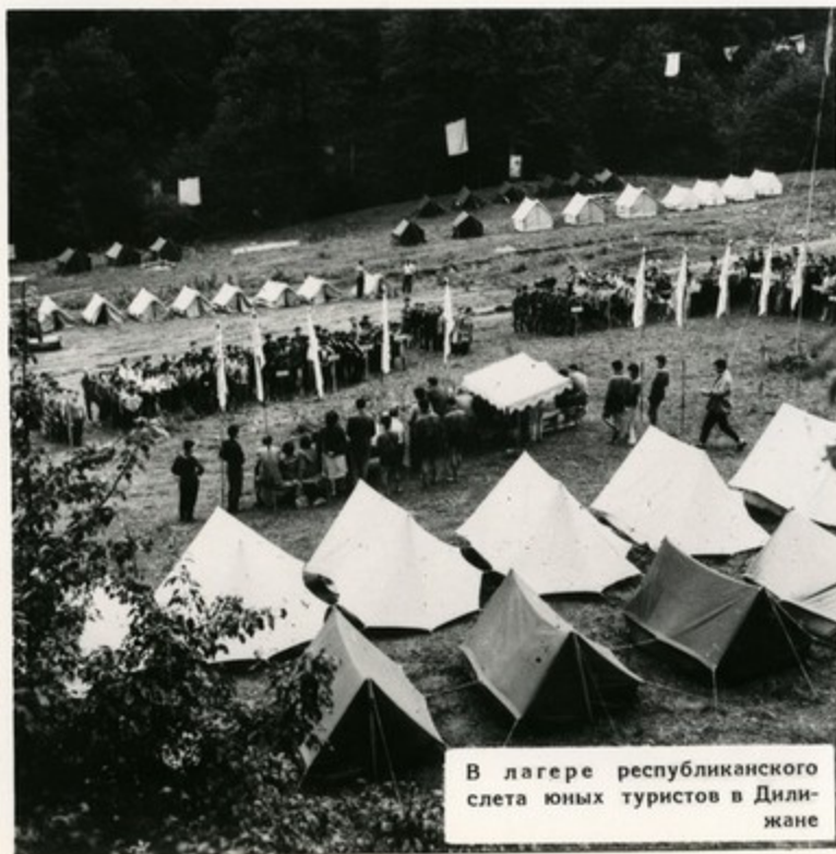
В лагере республиканского слета юных туристов в Дилижане

Что может быть увлекательнее путешествий по родному краю, ярких ночных костров на привалах! С наступлением лета тысячи пионеров отправляются в дальние походы. На туристских тропах вырабатываются выносливость, смелость, умение всегда прийти на помощь товарищу.