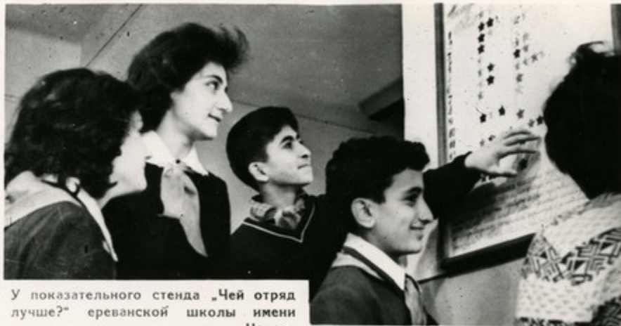
У показательного стенда „Чей отряд лучше?“ ереванской школы имени Чехова

Все пионеры республики приняли участие во Всесоюзном соревновании за право называться лучшим отрядом. В этом интересном конкурсе, проходившем по трем ступеням, отличились отряды школ Еревана, Эчмиадзина, Севана, Абовяна и других городов.