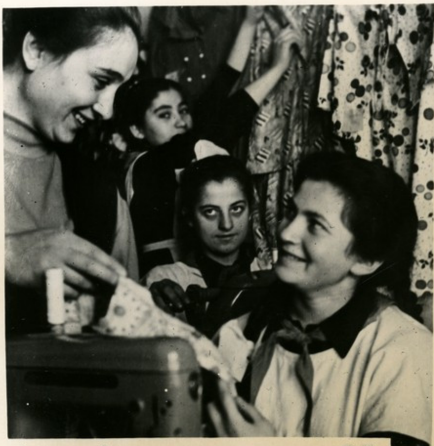
Ленинакан. Занятие по домоводству в школе № 29

Все возможности предоставлены нашим школьникам для овладения трудовыми навыками. Только за последние годы школьные мастерские получили около 5 тысяч металлорежущих и деревообрабатывающих станков, столько же верстаков, 3 тысячи швейных машин. Много тракторов и комбайнов передано учащимся сельских районов республики