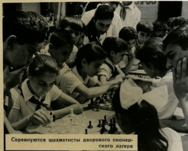
Состязаются шахматисты дворового пионерского лагеря