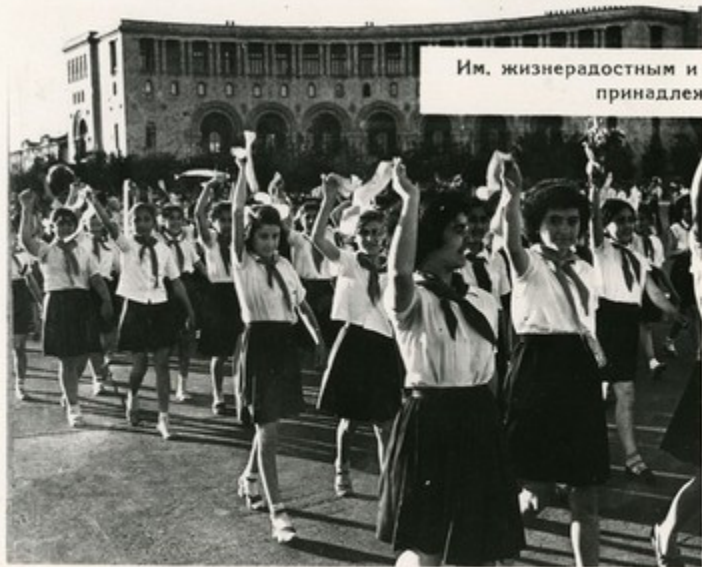
Им, жизнерадостным и счастливым, принадлежит будущее

Все пионеры республики приняли участие во Всесоюзном соревновании за право называться лучшим отрядом. В этом интересном конкурсе, проходившем по трем ступеням, отличились отряды школ Еревана, Эчмиадзина, Севана, Абовяна и других городов.