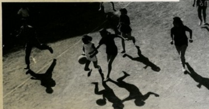
На республиканских соревнованиях по баскетболу на приз газеты «Пионер канч»

Настоящий пионер должен быть хорошим физкультурником. Сейчас 8630 мальчиков и девочек имеют спортивные разряды. В 1963 году нормы БГТО выполнили более 17 тысяч школьников.