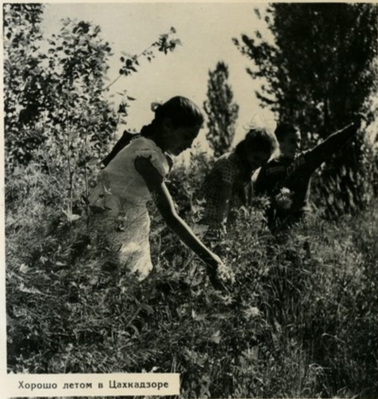
Хорошо летом в Цахкадзоре

Весело и интересно проводят школьники республики свой летний отдых. К их услугам—десятки пионерских лагерей, расположенных в живописнейших уголках Армении. А лучшие из лучших получают право побывать в прославленных детских здравницах страны.