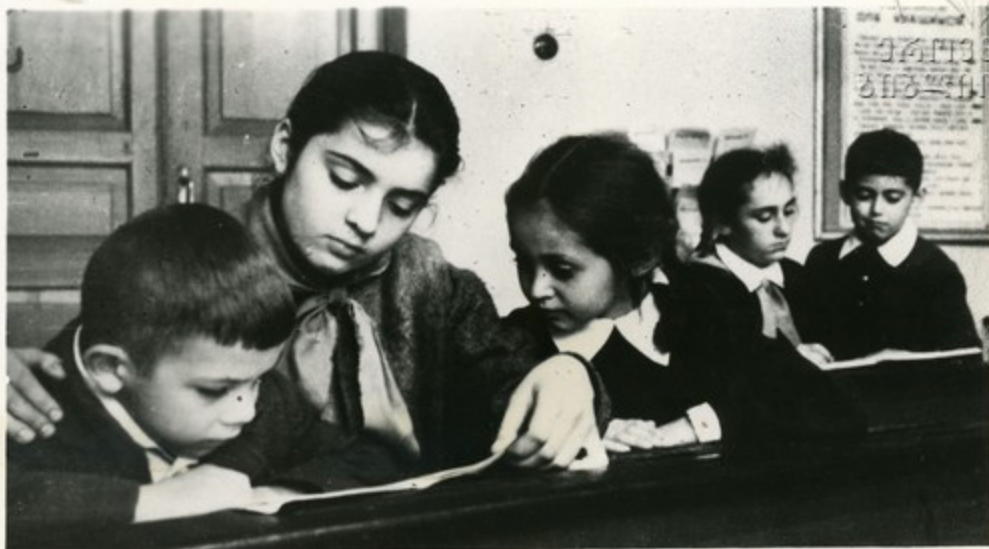
Пионер—заботливый друг октябрят

Большую шефскую работу проводят пионеры. Ребят в красных галстуках можно встретить и на полевом стане, и в воинской части, и в детском саду.