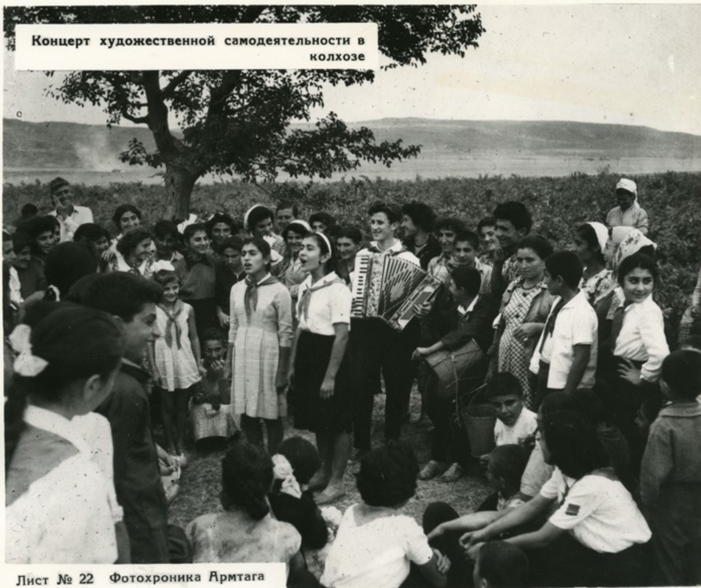
Лист № 22

Концерт художественной самодеятельности в колхозе