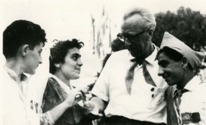
Армянские пионеры беседуют с композитором Дмитрием Ка- балевским