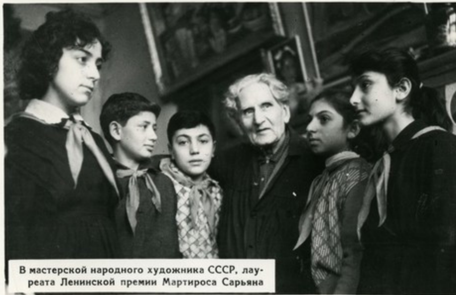
В мастерской народного художника СССР, лау- реата Ленинской премии Мартироса Сарьяна

Замечательной традицией стали встречи пионеров со знатыми людьми страны, выдающимися писателями, композиторами, художника- ми. И часто нелегко бывает им отвечать на многочис- ленные вопросы любозна- тельных ребят.