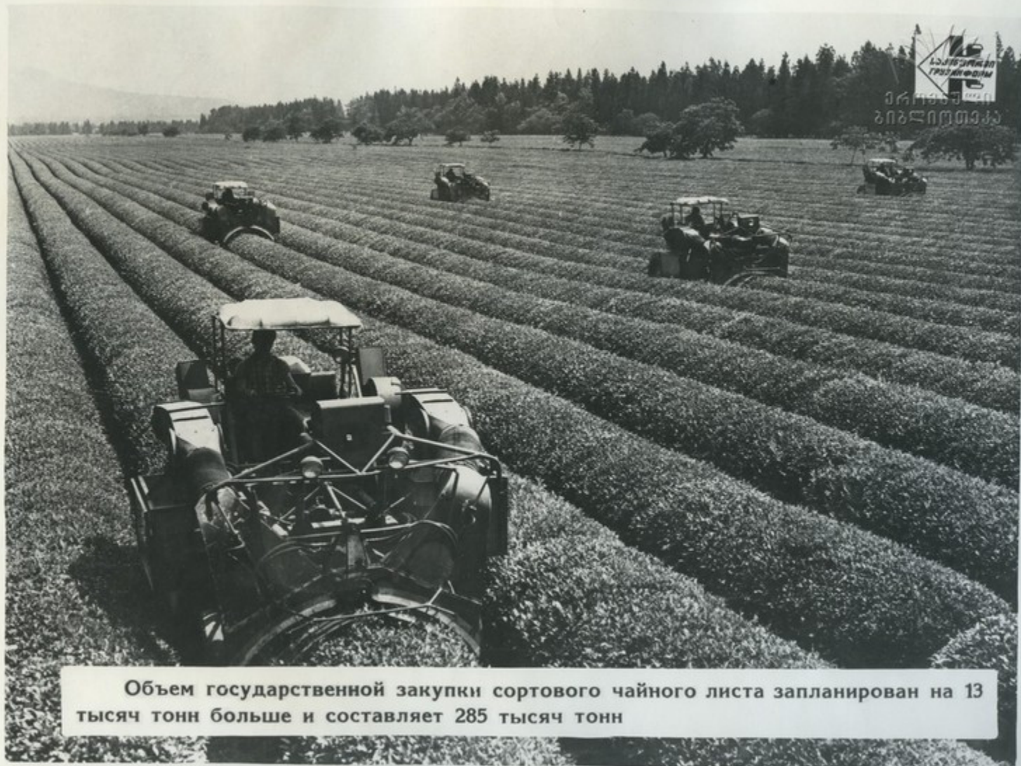
Объем государственной закупки сортового чайного листа запланирован на 13 тысяч тонн больше и составляет 285 тысяч тонн