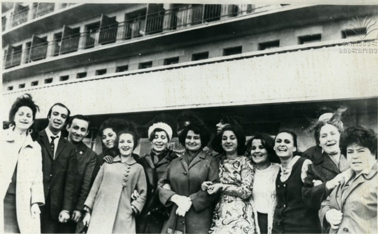
В Тбилиси прибыла большая группа мастеров искусств Армении—участников Дней Армянской ССР в Грузии. На снимке: гости из Армении у гостиницы „Иверия“ в Тбилиси.