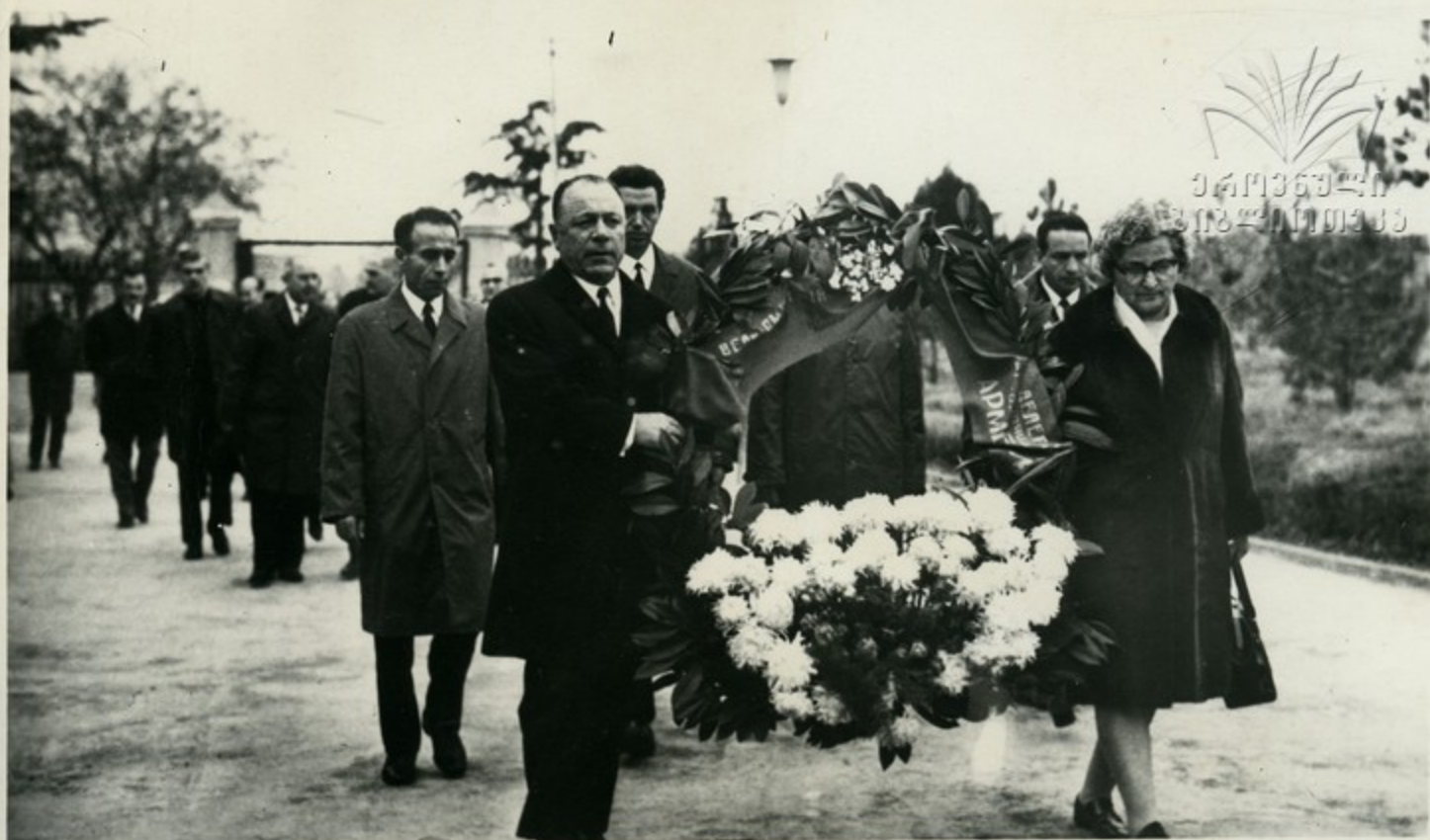
В парк культуры и отдыха имени 26 комиссаров, где находится могила Ованеса Туманяна, пришли члены делегации трудящихся Армении. Они возложили венок на могилу поэта.