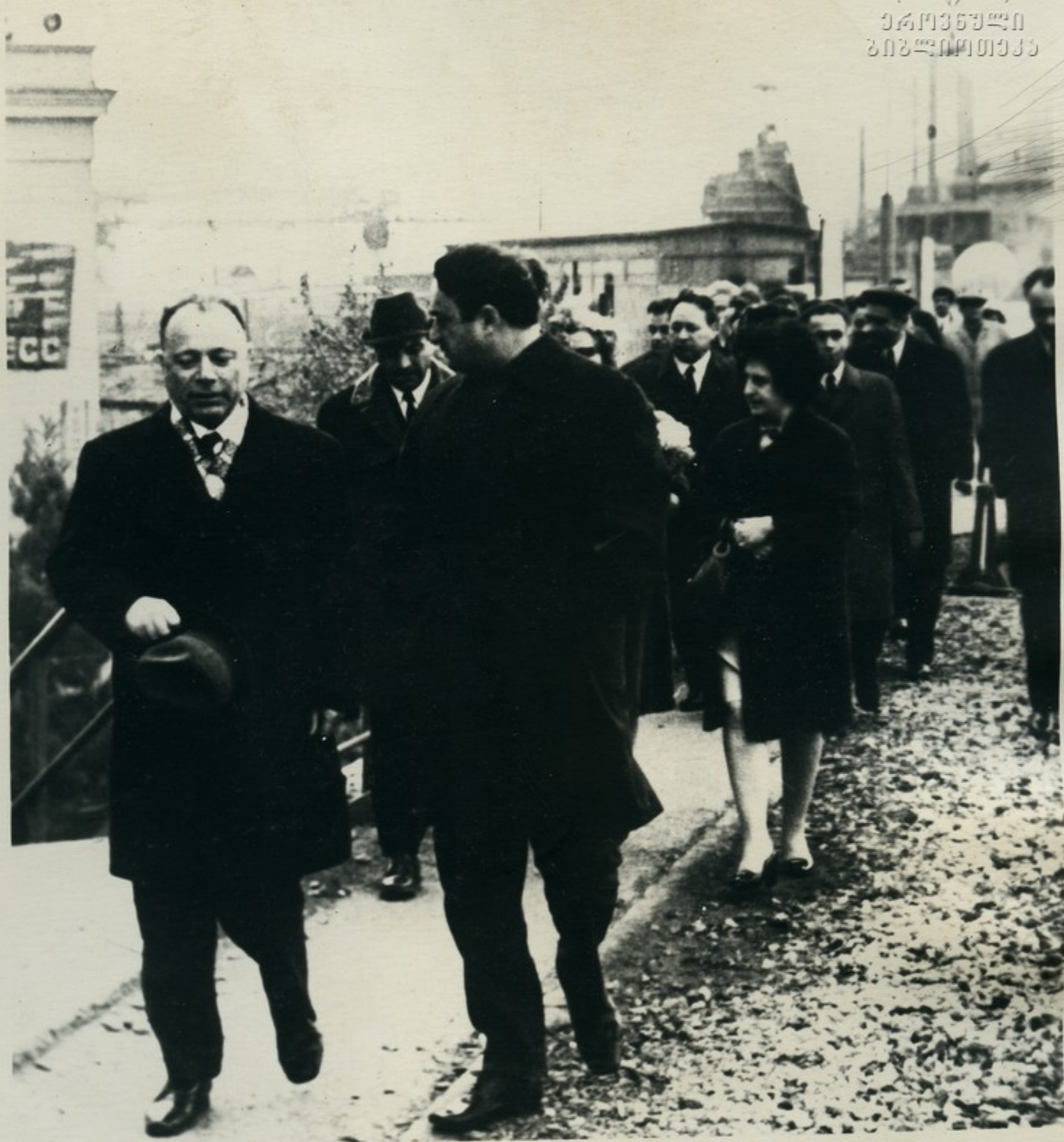
Делегация Армянской ССР посетила город грузинских металлургов— Рустави, осмотрела Руставский металлургический завод.