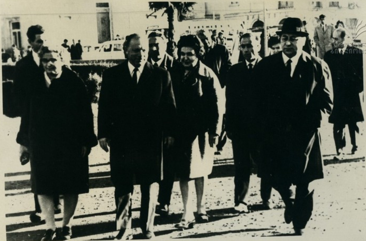
Члены армянской делегации и сопровождающие их лица побывали в Доме-музее И. В. Сталина и городском музее Славы.