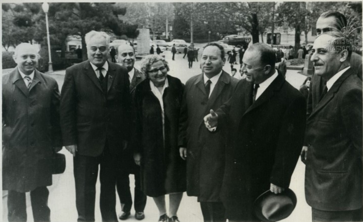
Члены делегации трудящихся Армении побывали в Тбилисском ордена Трудового Красного Знамени государственном университете.