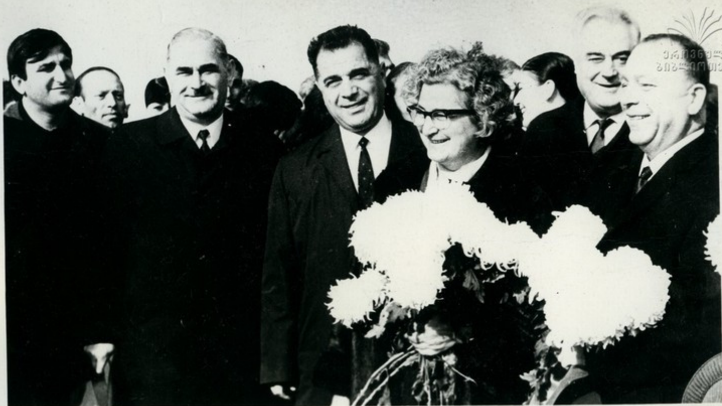
Члены делегации трудящихся Армении и сопровождавшие их лица осмотрели столицу нашей республики Тбилиси.