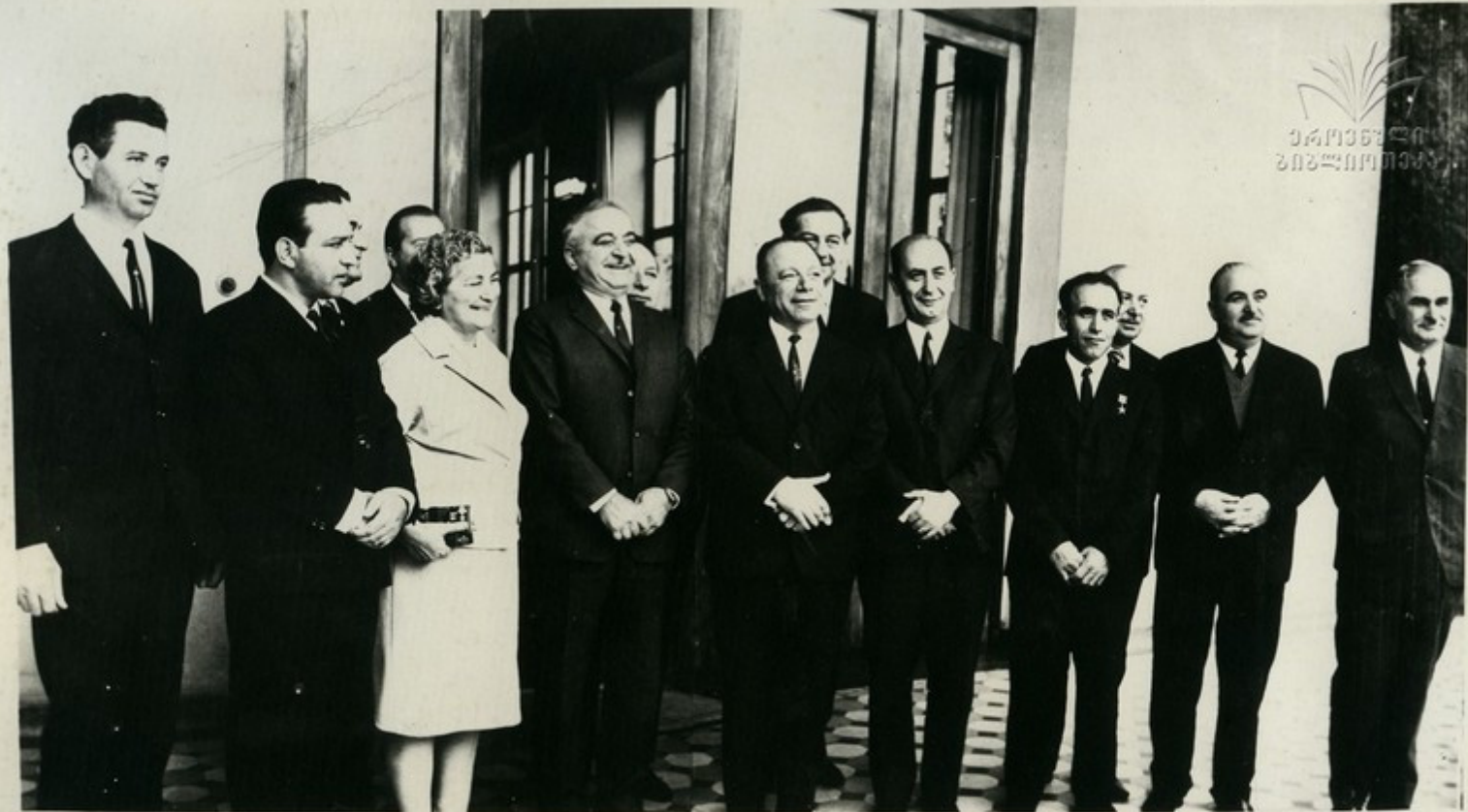
Делегация Армении в гостях у кандидата в члены Политбюро ЦК КПСС, первого секретаря ЦК КП Грузии В. П. Мжаванадзе.