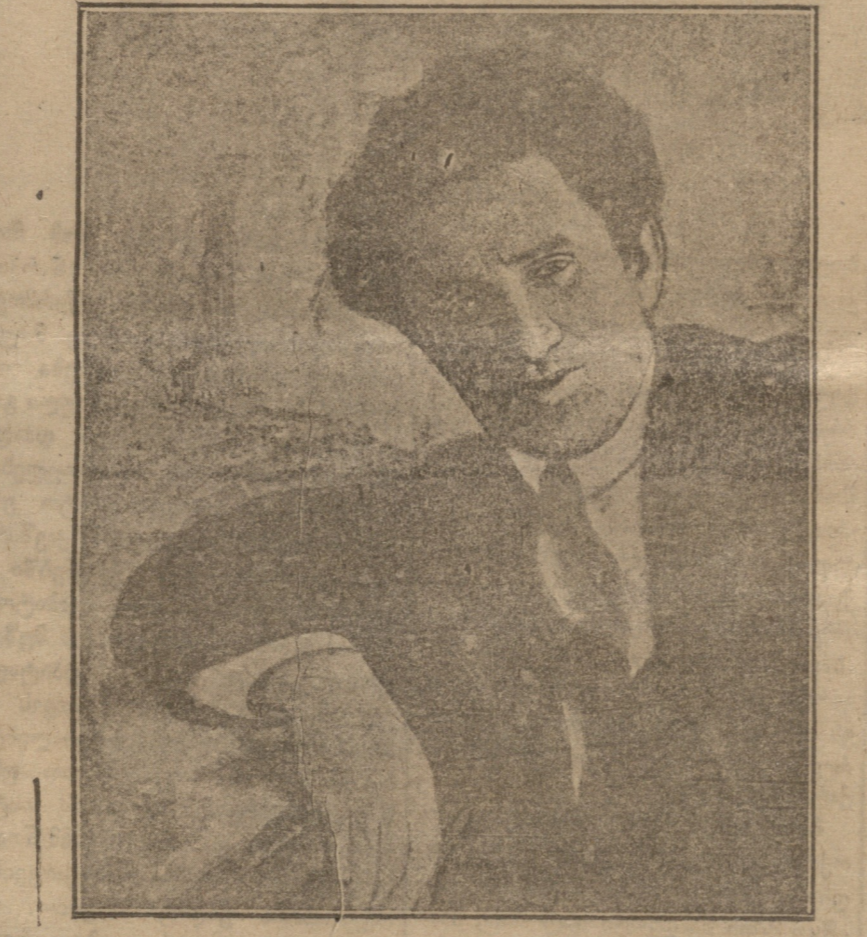
საქართველოს სახელმწიფო მმართველობის 1923 წლის