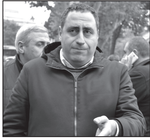
„დეპუტატები პარლამენტში ვირთხებივით მიიპარებოდნენ“

– რას ამბობთ? – ვამბობთ მშვიდობიანი პროტესტის გაგ-