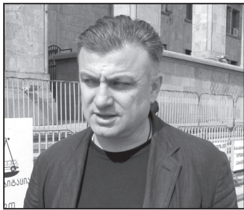
„სიძულვილის ნიადაგზე გაერთიანებას ბოროტი ნაყოფი მოაქვს“

– „ქართული ოცნება“ რომ საშინლად მოიქცა, ამაზე არ ვკამათობ. ამაში გასაკვირი არაფერია. რომელი დაპირება შეუსრულდება ივანიშვილის