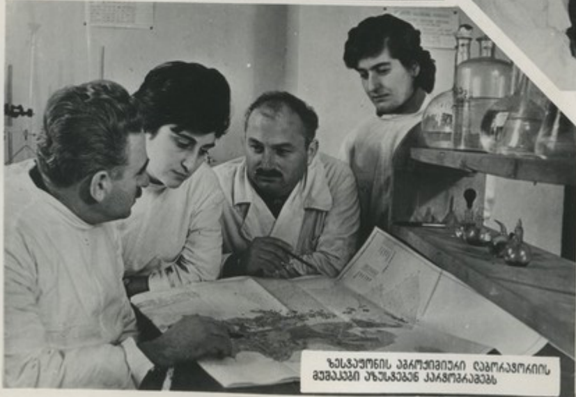
ზანჯაუშენის აგროქიმიკური ლაბორატორიის მუშაკები აუზსაბანე კარგობაზე

საქართველოს სსრ მთხრობის განყოფილების ვალდაქანიის, ავრომატიკისა და ელექტრონიკის ინსტიტუტში შექმნილია სპეციალური ავარჯს ტიპილის გაზის მუხრანოვის ვალდაქანიის განყოფილება.