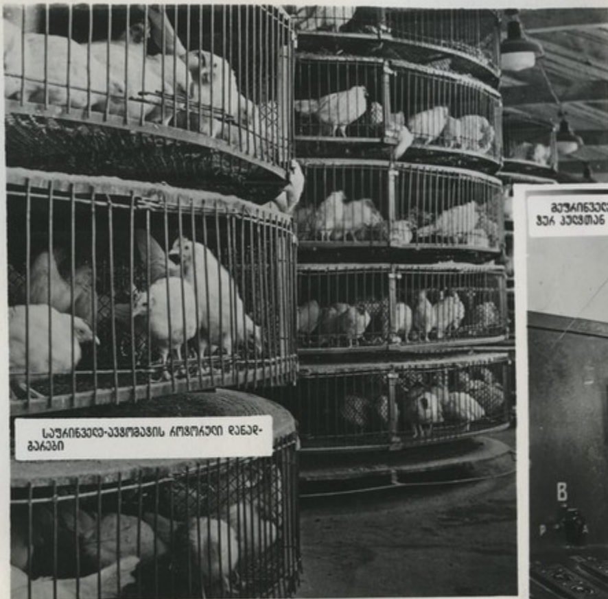
საზიწვედა-აპრომაზის აროგრაფი რანდ-ბარანი

ოკ პაჰანა რაგბაში დარგულია ოს-ოში აროგრაფი რანდ-ბარანი. ეს აკის მგზვანი ხუთიკანსიანი გელიანი. თვითუდ მათგანში 45 ლით ათავსებან 800 ჴითა ჴიწვედს. „ხუთ-სატიუღიანი სახლი“ თავისი მსოპრადგით წედნა ბან-ნავს. ამ როს ჴიწვედი იღავს საკვავს გავგინან. ეკთი ჴიწვედის ნაგაში აკსაბუდ გელიანი კვავასთან შუდარეგით იწარება 100-120 გრამით.