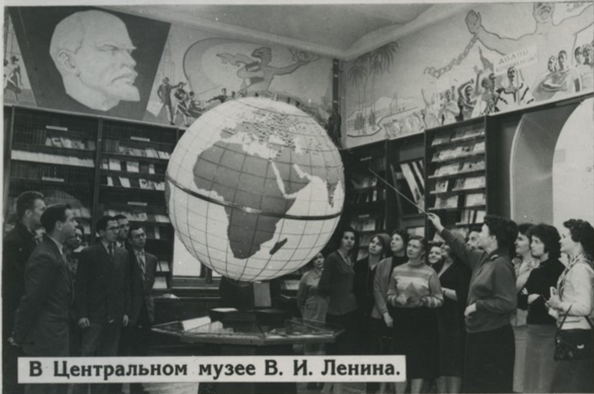
В Центральном музее В. И. Ленина.

По данным Юнеско произведения В. И. Ленина среди переводной литературы занимают первое место.