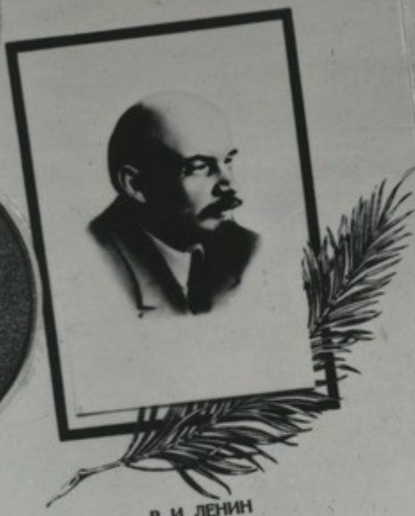
В. И. ЛЕНИН V. I. LENINE