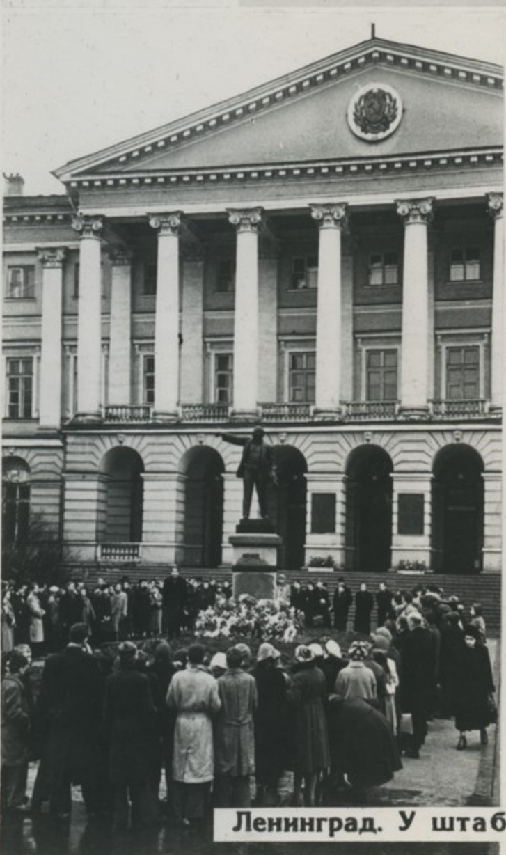
Ленинград. У штаба революции—Смольного.