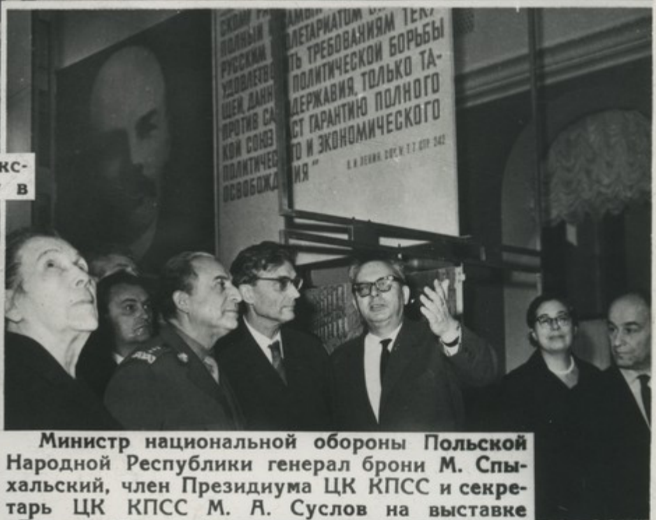
Министр национальной обороны Польской Народной Республики генерал брони М. Спычальский, член Президиума ЦК КПСС и секретарь ЦК КПСС М. А. Суслов на выставке „Ленин в Польше“.