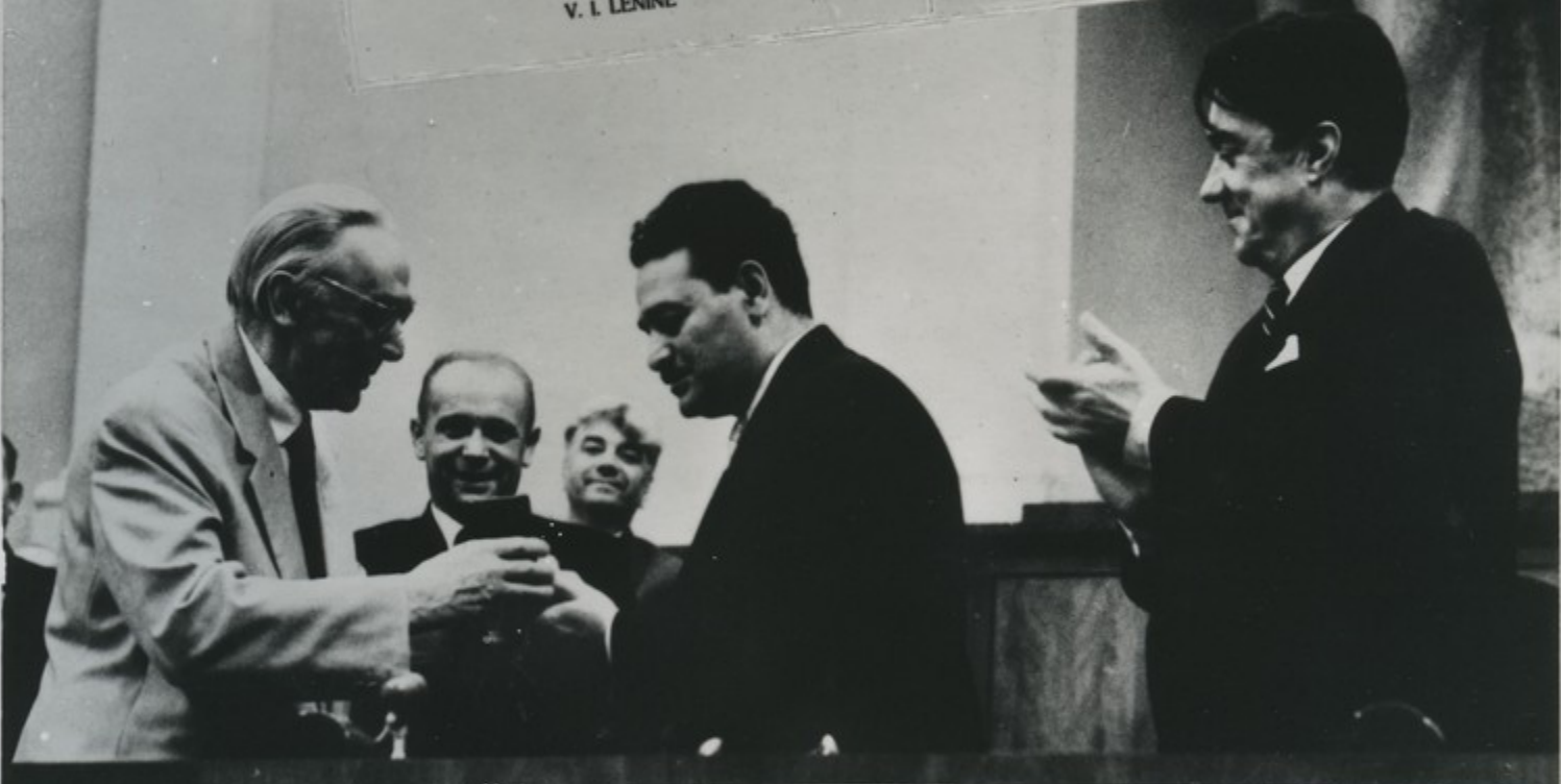
Вручение международной Ленинской премии „За укрепление мира между народами“ выдающемуся общественному деятелю Греции Манолису Глезосу.

Заместитель председателя Комитета Vice-Président du Comité des Prix Lénine internationaux