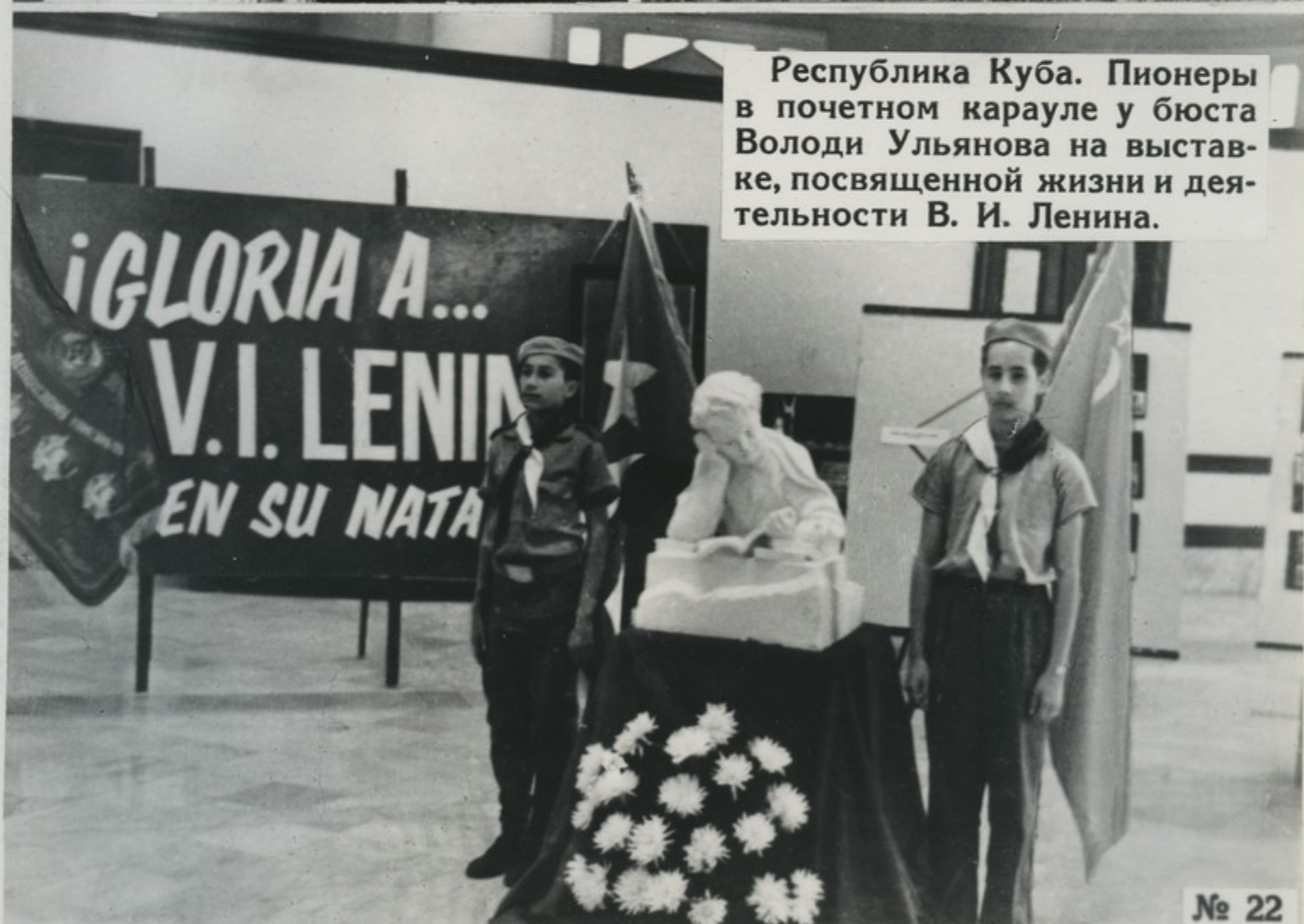
Республика Куба. Пионеры в почетном карауле у бюста Володи Ульянова на выставке, посвященной жизни и деятельности В. И. Ленина.