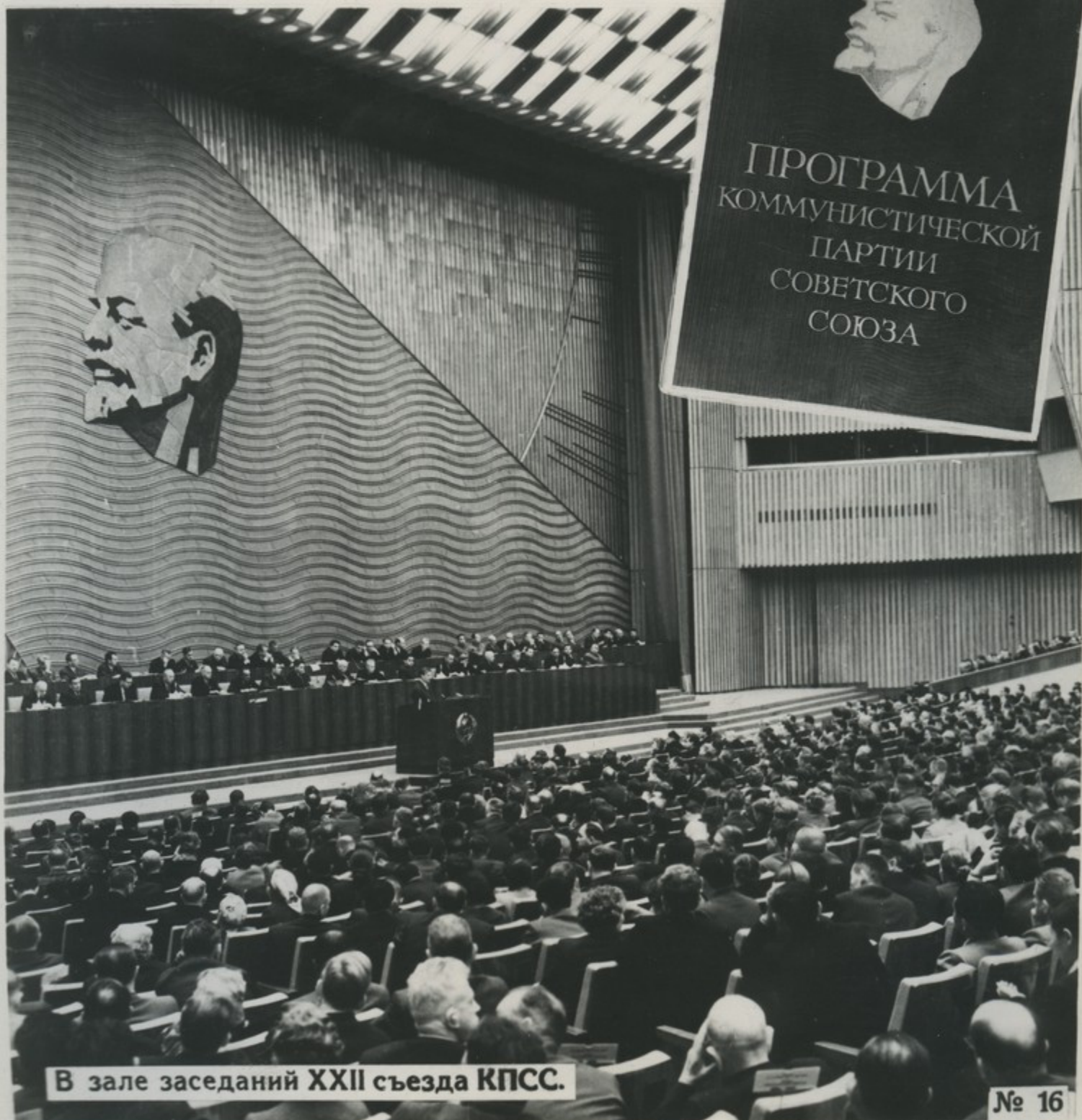
В зале заседаний XXII съезда КПСС.