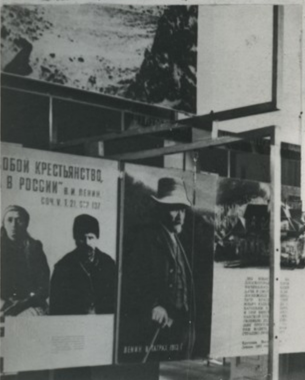
Ленинградский филиал Центрального музея В. И. Ленина. Выставка „Ленин в Польше“.