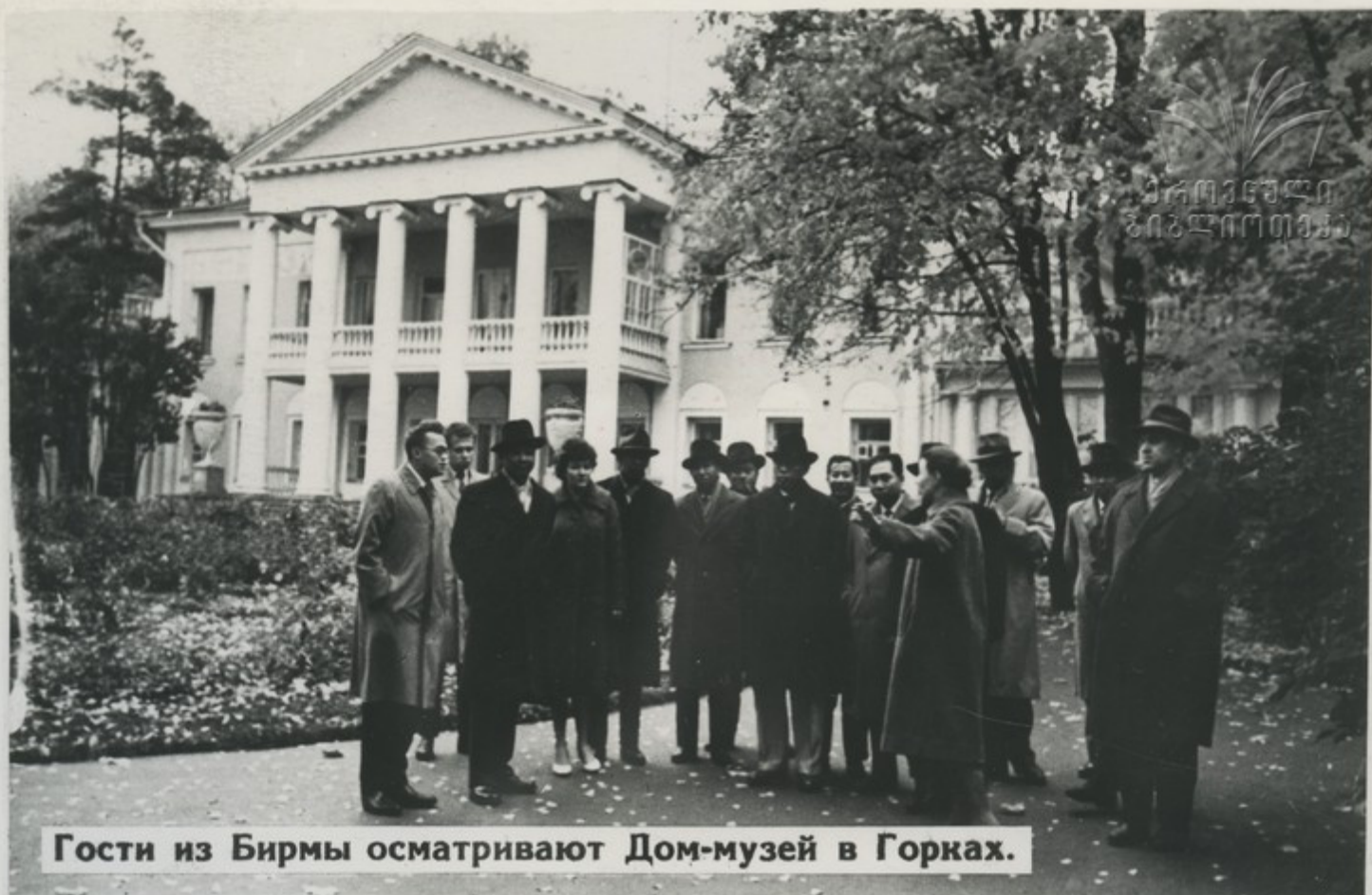
Гости из Бирмы осматривают Дом-музей в Горках.