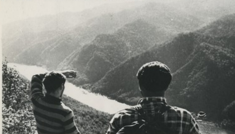
Место, где будет строиться Саяно-Шушенская ГЭС.

В Сибири, на реке Енисее, недалеко от села Шушенского, где жил сосланный царским правительством В. И. Ленин, будет возведена самая крупная в мире Саяно-Шушенская гидроэлектростанция. Ее проектная мощность—6 млн. 360 тысяч киловатт.