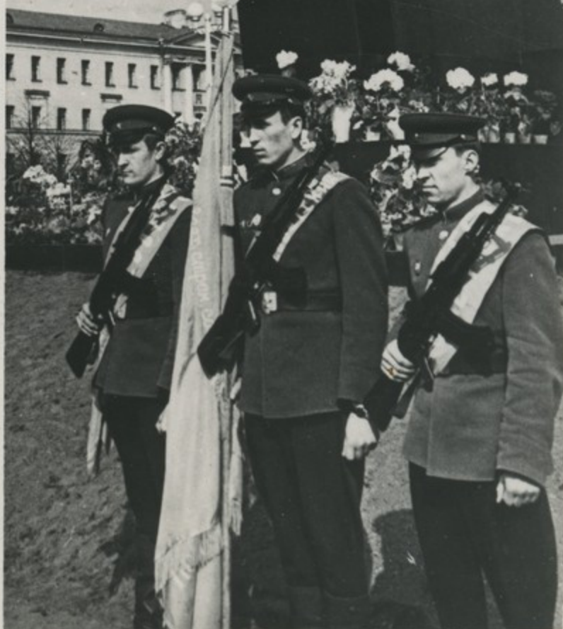
Памятник В.И. Ленину у Финляндского вокзала в Ленинграде.