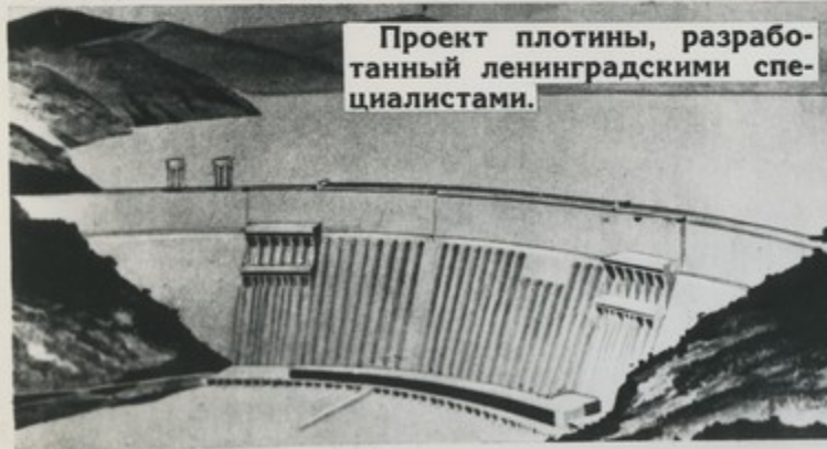
Проект плотины, разработанный ленинградскими специалистами.