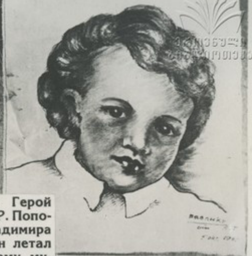
Портрет Ленина, побывавший в космосе.

Летчик - космонавт Герой Советского Союза П. Р. Попович дарит портрет Владимира Ильича, с которым он летал в космос, Центральному музею В. И. Ленина.