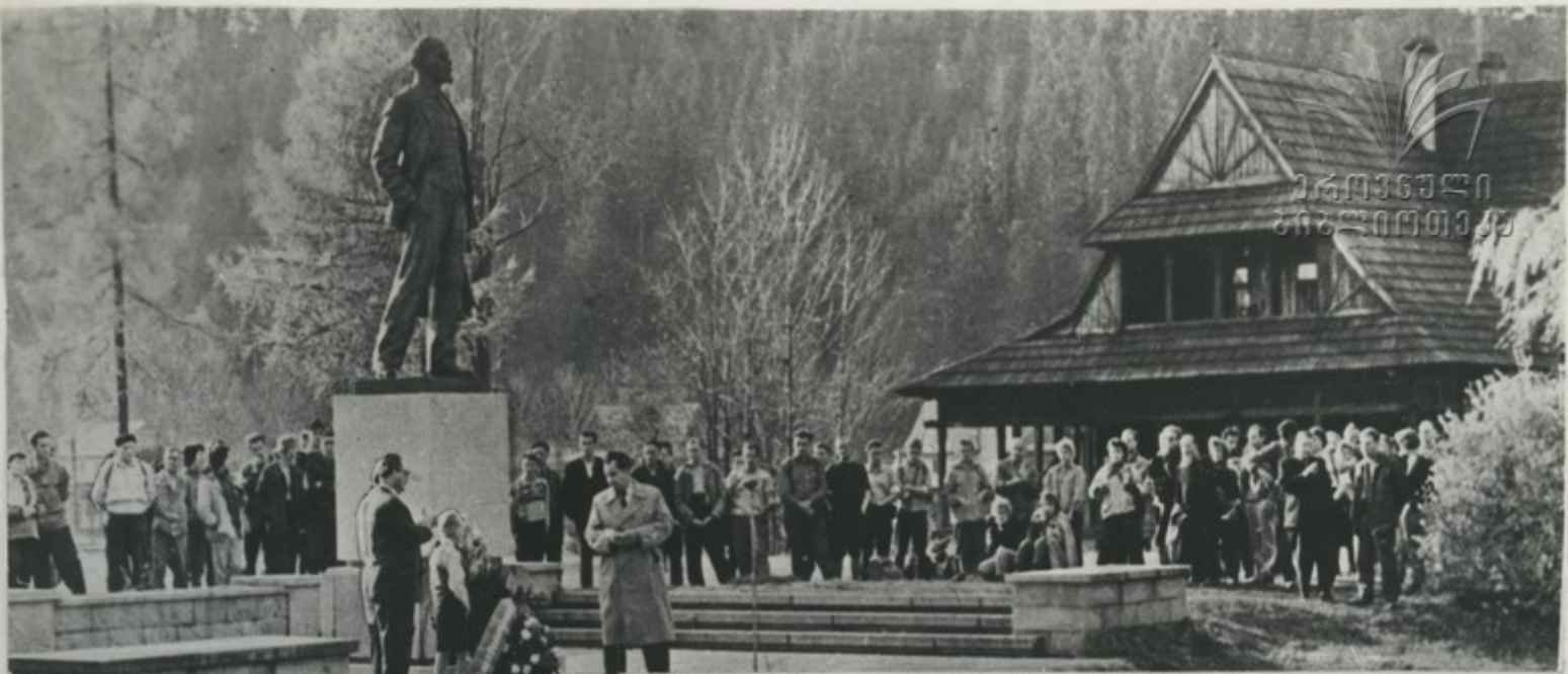
Польская Народная Республика. Экскурсаны у памятника В. И. Ленину в селе Поронино.