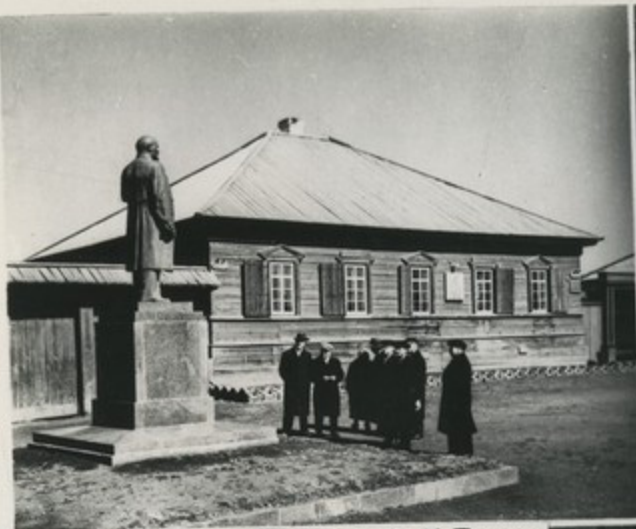
Красноярский край. У Дома-музея В. И. Ленина в селе Шушенском.

В далекой Сибири, где три года был в ссылке В. И. Ленин, теперь как памятник, как воплощение его мечты, стоит Красноярская ГЭС.