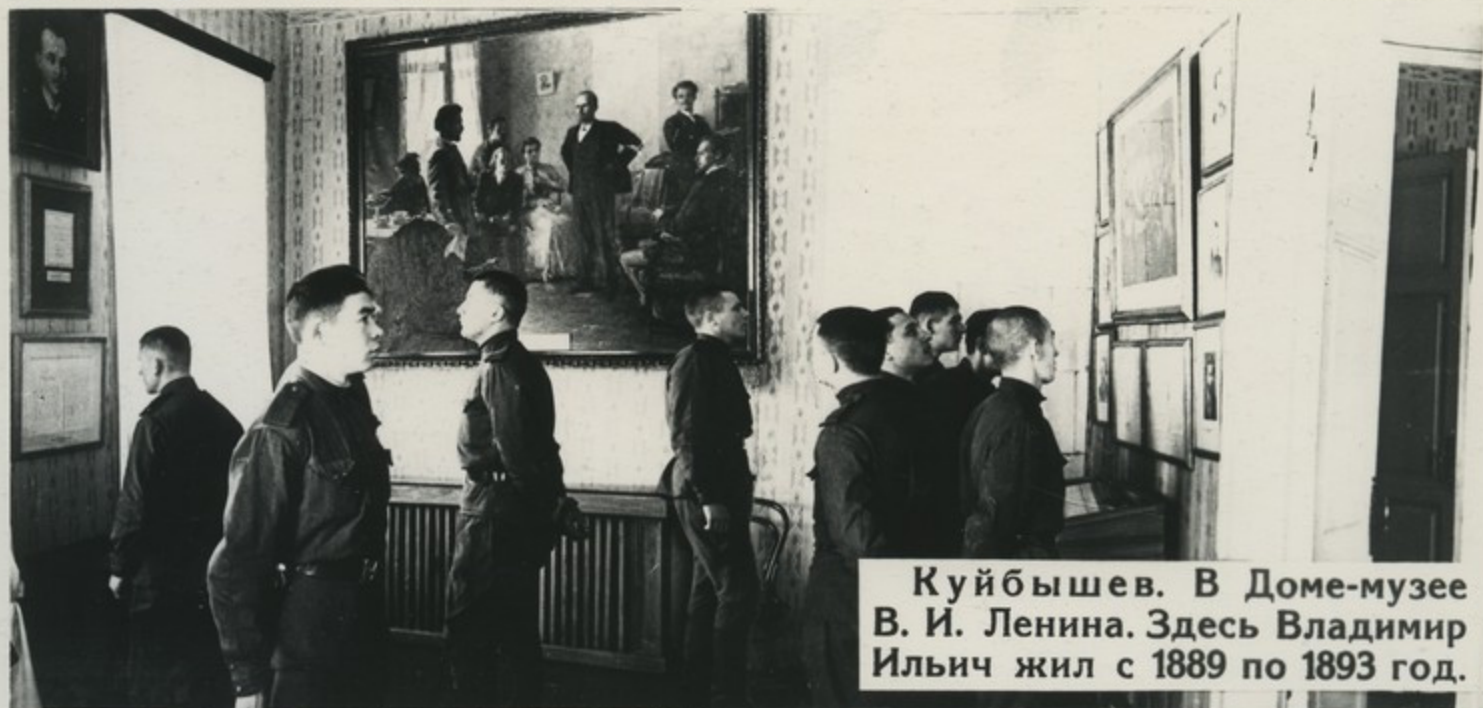
Куйбышев. В Доме-музее В. И. Ленина. Здесь Владимир Ильич жил с 1889 по 1893 год.

Здесь, в Самаре, сложились и оформились марксистские убеждения В. И. Ленина. Потомки тех, кто под водительством Ильича поднял победоносное Знамя Октября, сегодня успешно осуществляют то, чем жил Ленин, что он планировал, о чем мечтал.