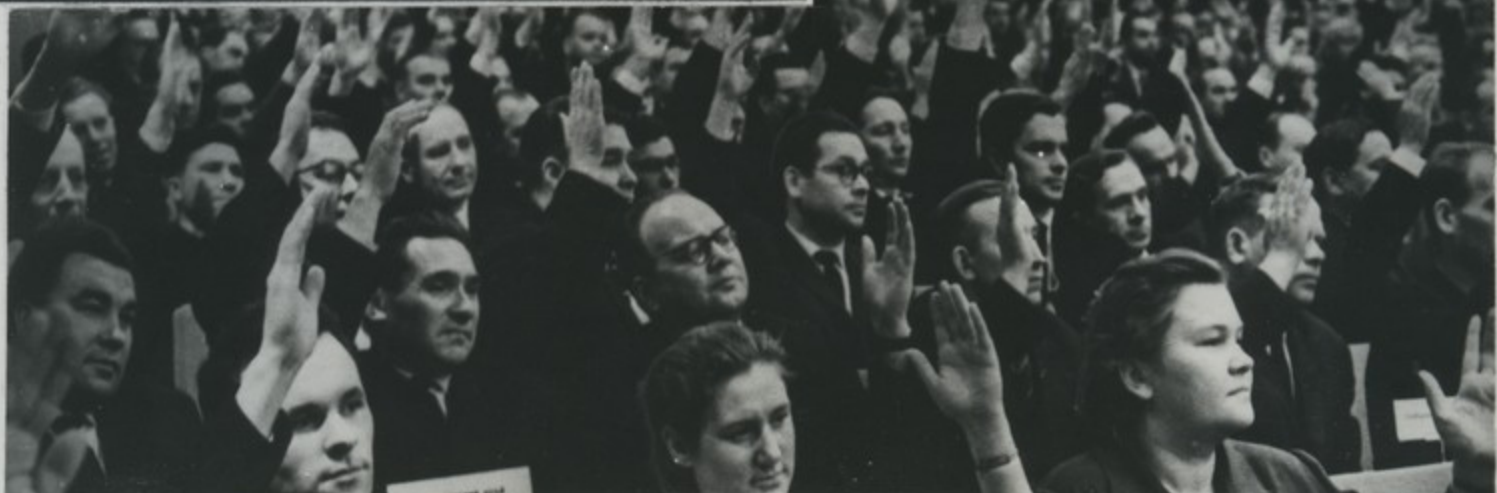
На декабрьском Пленуме ЦК КПСС (1963 год).