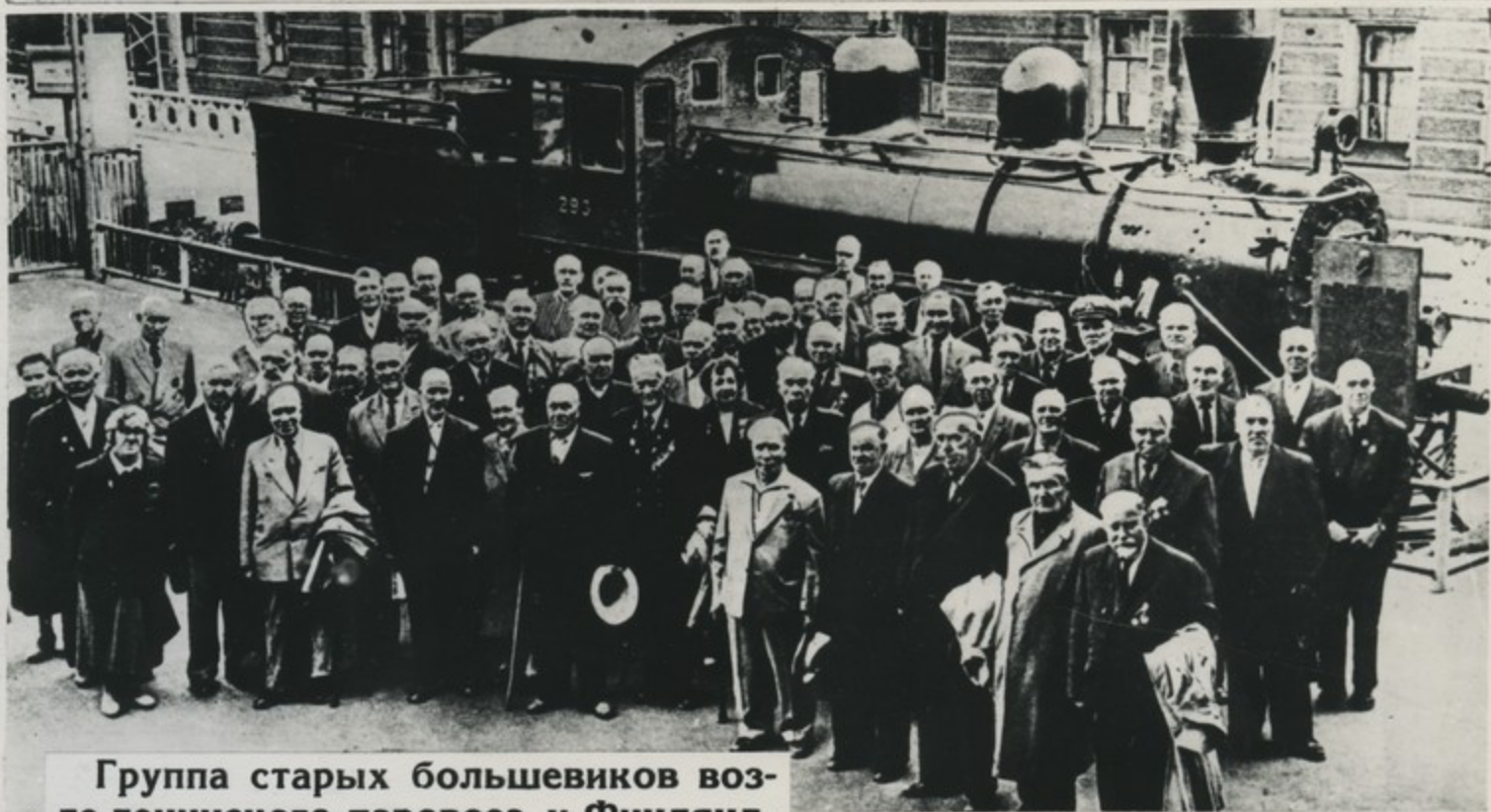
Группа старых большевиков возле ленинского паровоза у Финляндского вокзала.