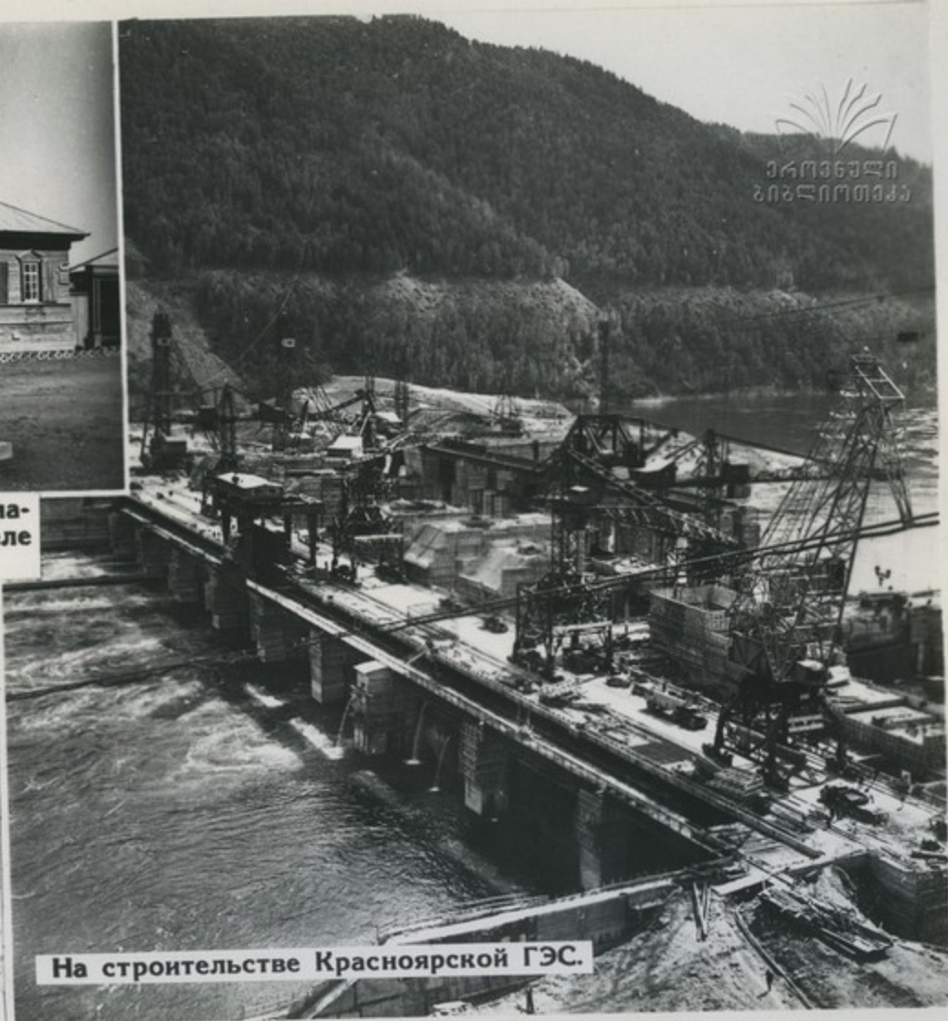
На строительстве Красноярской ГЭС.

В далекой Сибири, где три года был в ссылке В. И. Ленин, теперь как памятник, как воплощение его мечты, стоит Красноярская ГЭС.