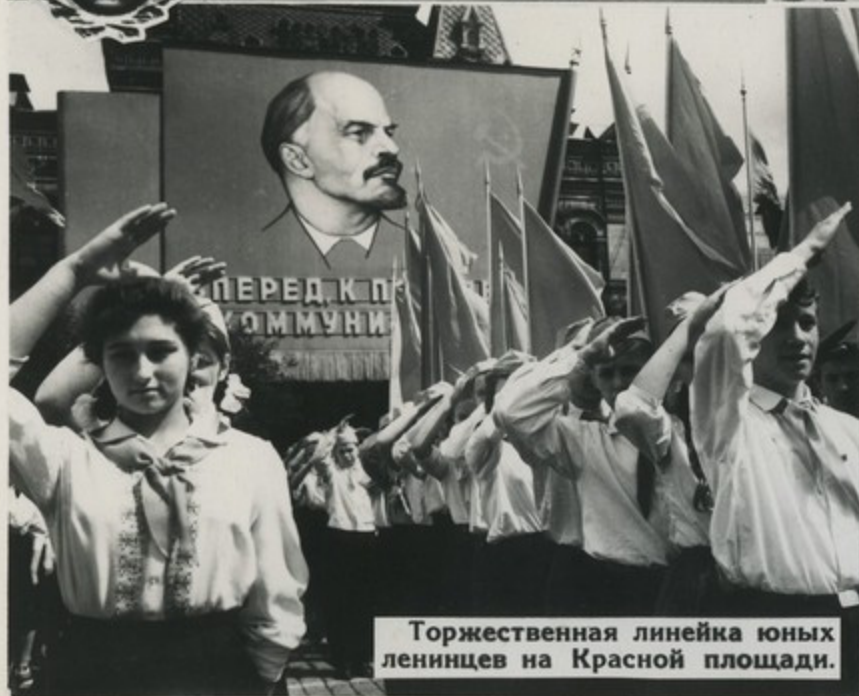
Торжественная линейка юных ленинцев на Красной площади.

Имя Ленина в сердце каждом, Верность Ленину делом докажем!