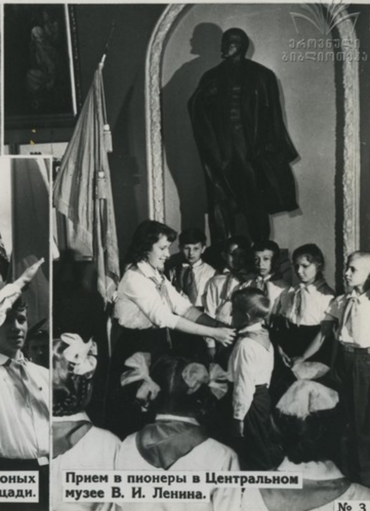
Прием в пионеры в Центральном музее В. И. Ленина.