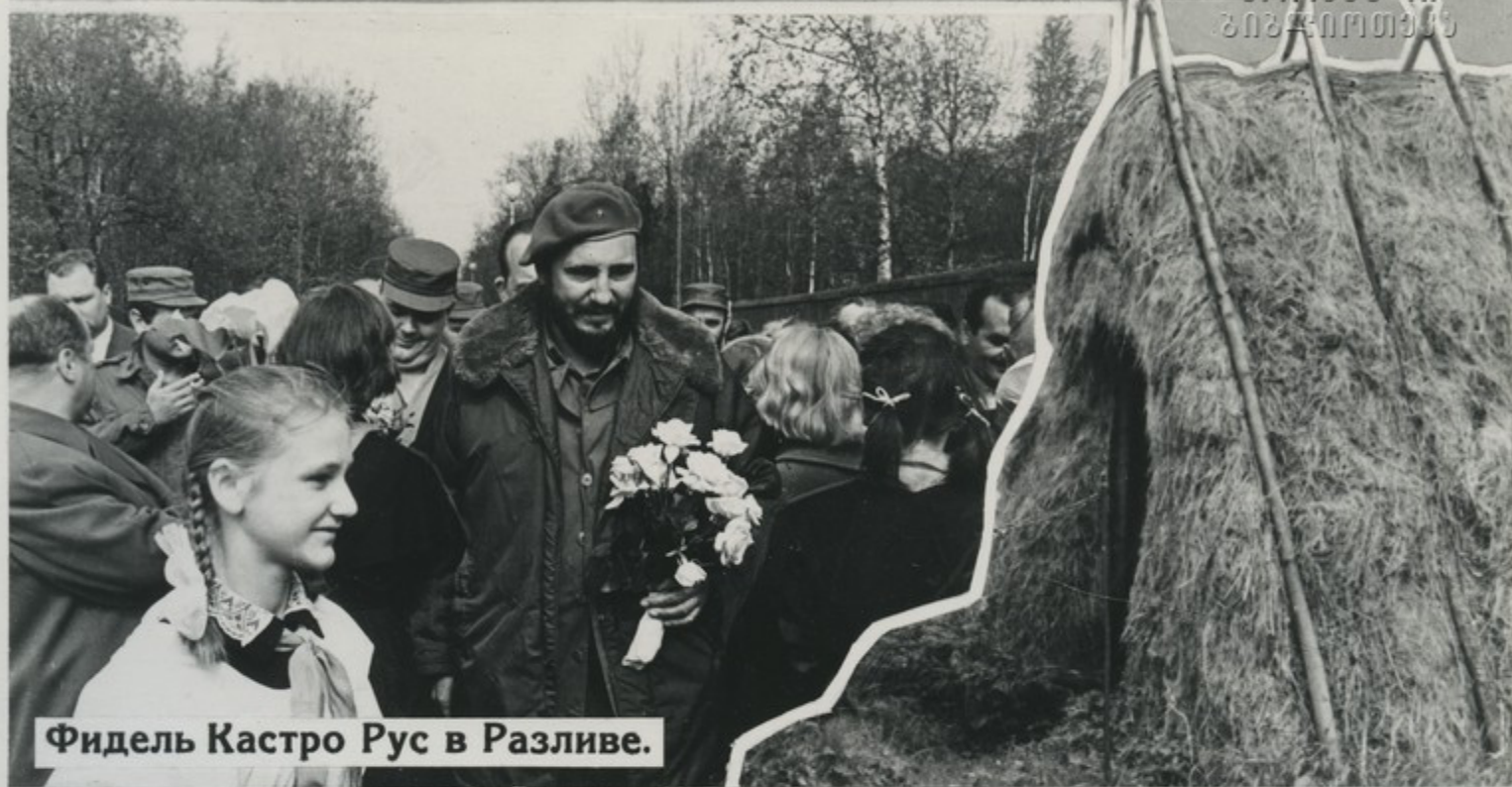
Фидель Кастро Рус в Разливе.