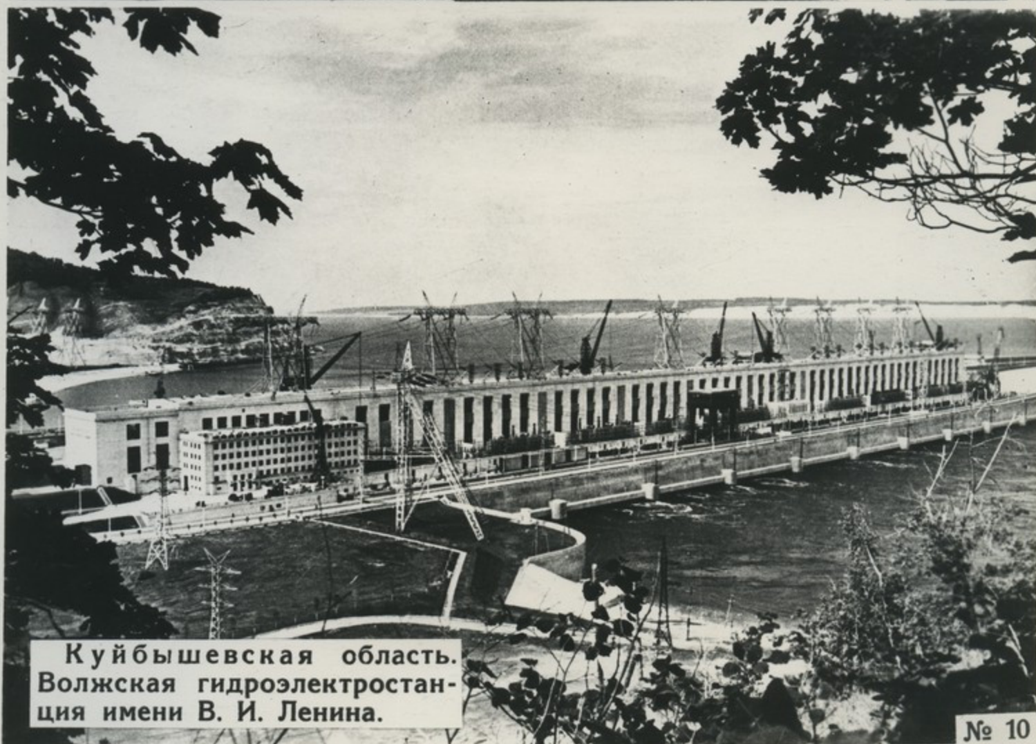
Куйбышевская область. Волжская гидроэлектростанция имени В. И. Ленина.