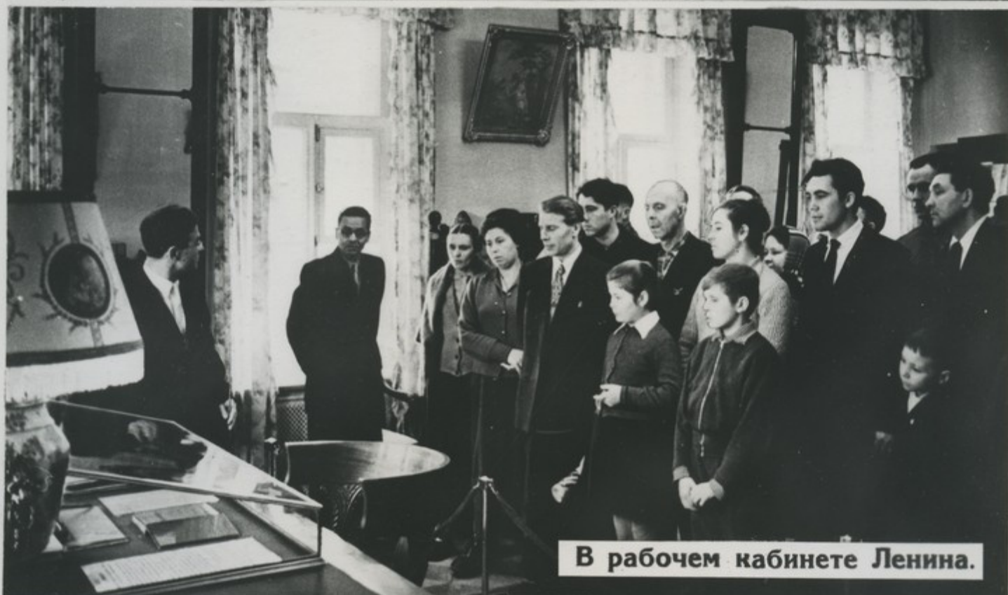
В рабочем кабинете Ленина.

Горки Ленинские. Нескончаем поток людей со всех концов страны и из-за рубежа к месту, где жил, работал, отдыхал и умер В. И. Ленин. Мемориальный Дом-музей В. И. Ленина в Горках уже посетило более миллиона трудящихся.