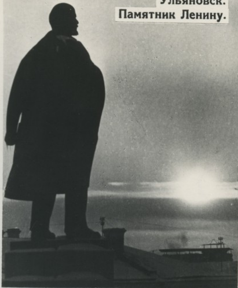
Ульяновск. Памятник Ленину.

Ульяновск, где родился В. И. Ленин, в прошлом небольшой купеческий город Симбирск. Теперь это крупный индустриальный центр.