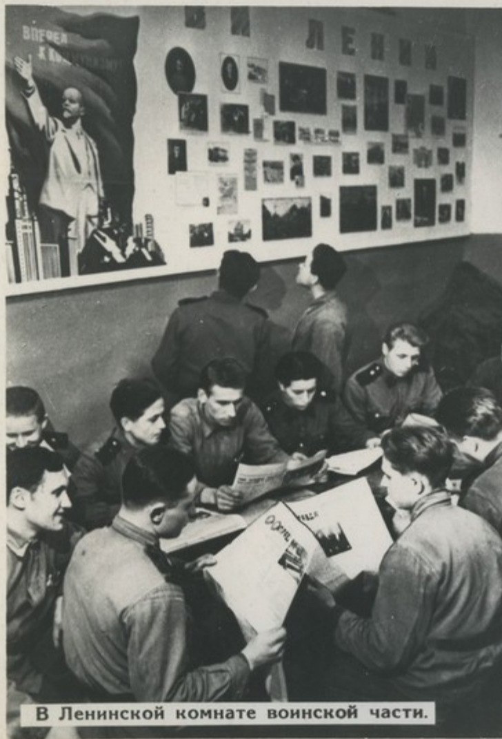
В Ленинской комнате воинской части.