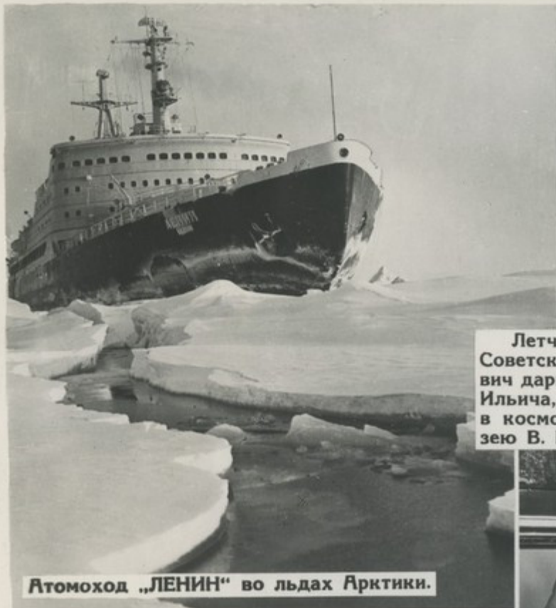
Атомоход „ЛЕНИН“ во льдах Арктики.

Сыны и внуки тех, кто под водительством Ильича поднял знамя Октября, сегодня запустили в космос ракеты, отправили в плавание первый в мире атомоход „Ленин“, раскрывают тайны Вселенной.