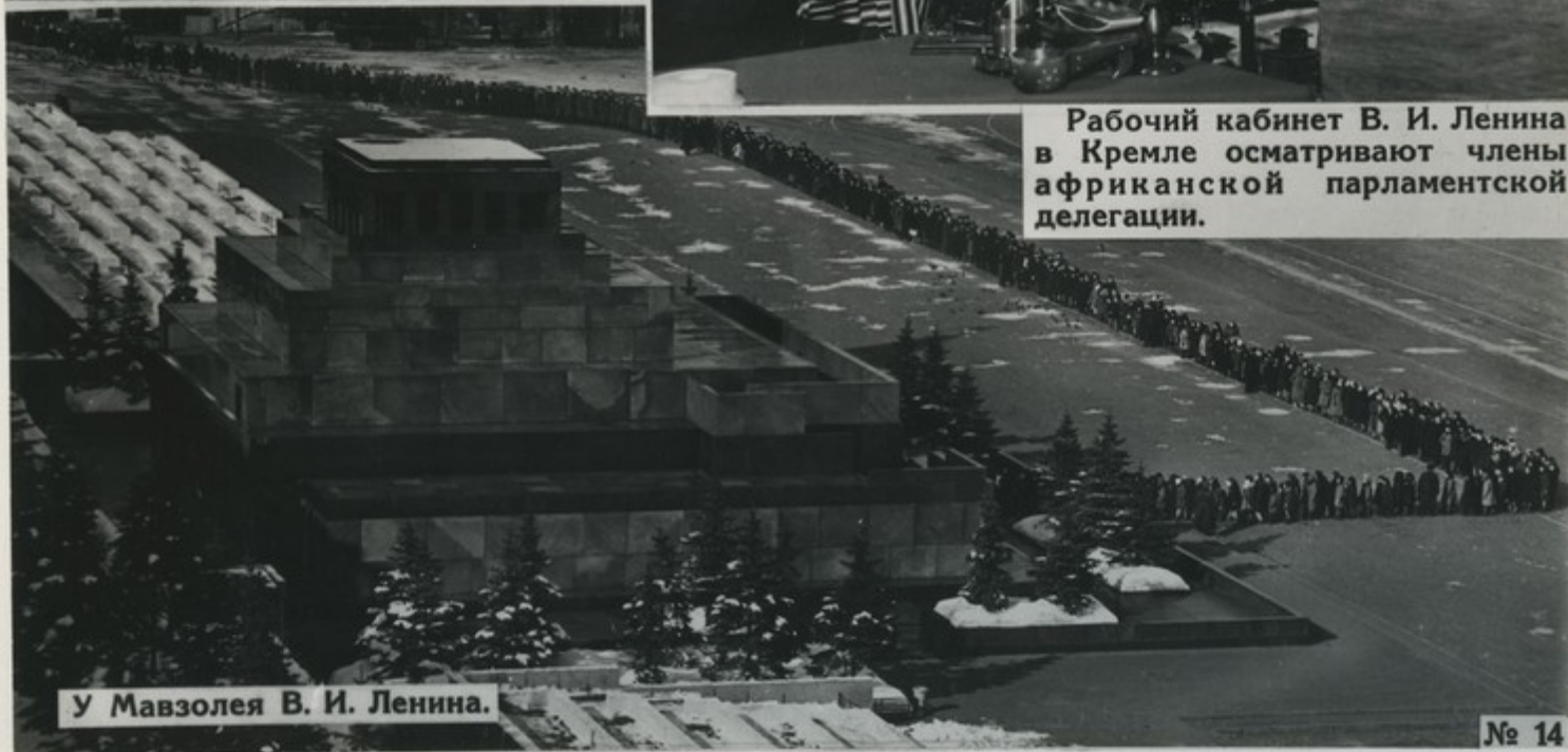
У Мавзолея В. И. Ленина.