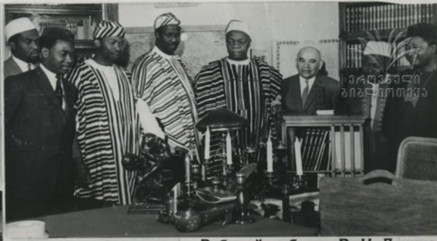
Рабочий кабинет В. И. Ленина в Кремле осматривают члены африканской парламентской делегации.