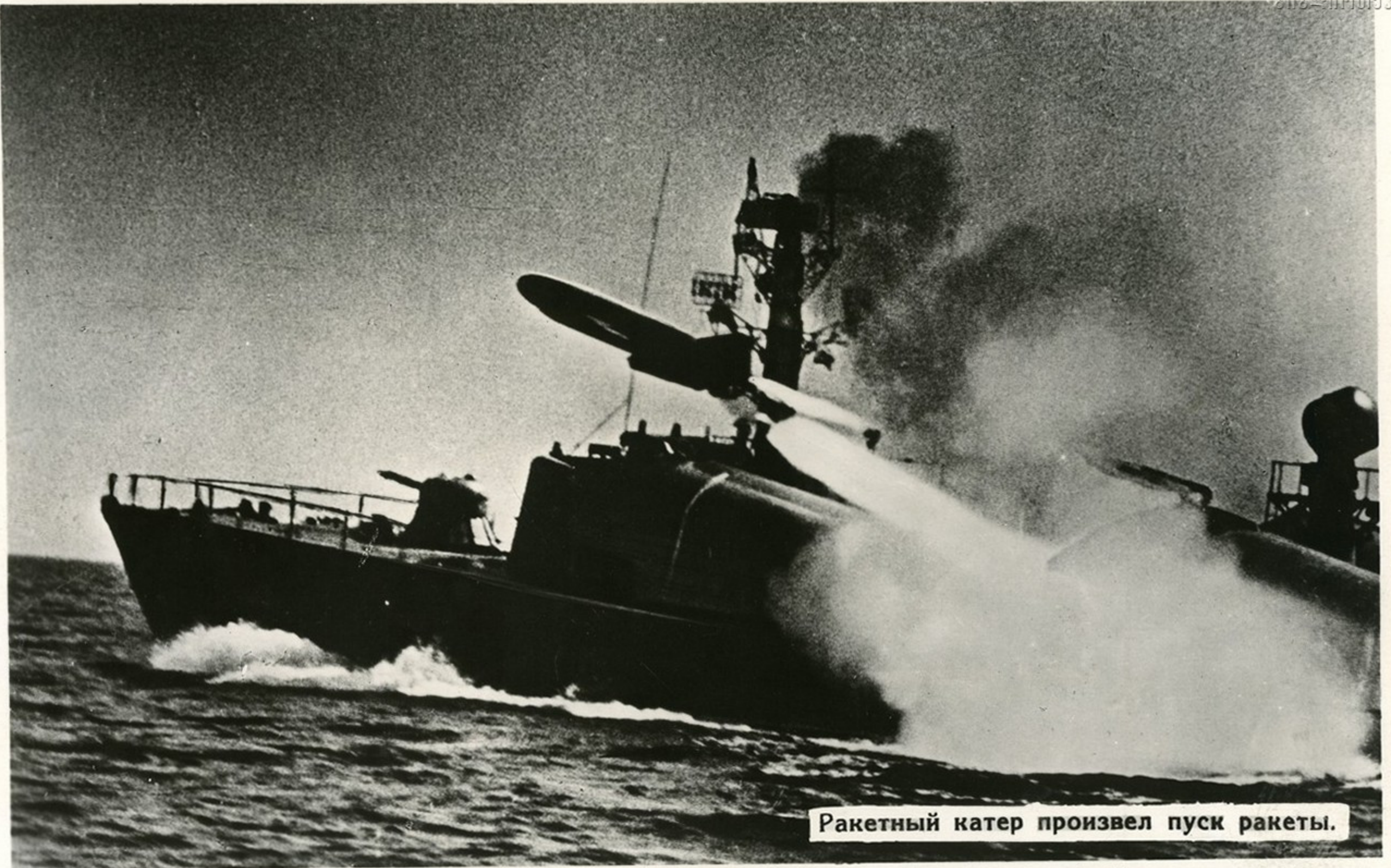
Ракетный катер произвел пуск ракеты.

На командирском пульте управления ракетной стрельбой вспыхивает красная лампочка: все готово к пуску!