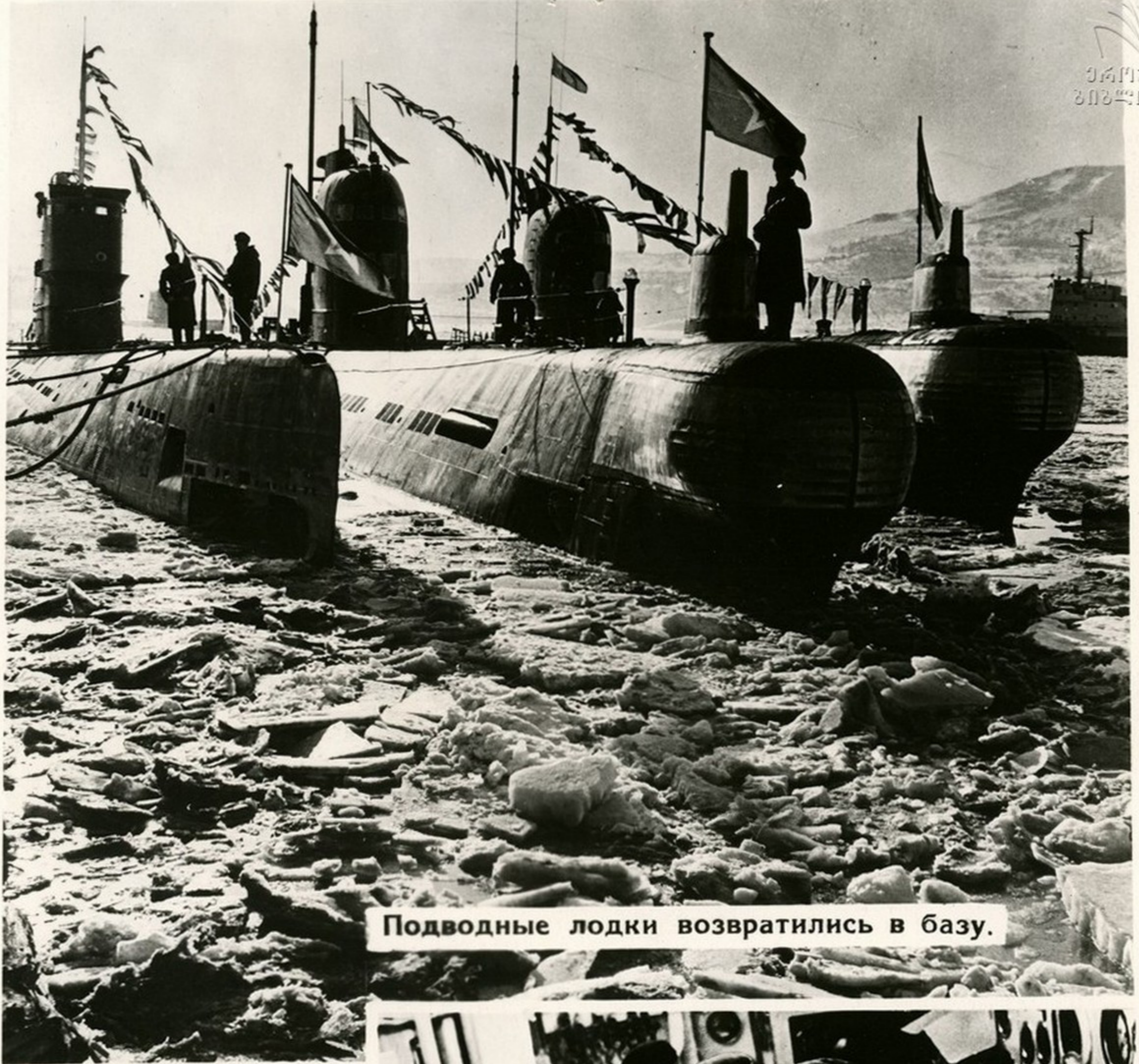
Подводные лодки возвратились в базу.

Советских моряков не пугают ни штормы, ни жгучие морозы, ни тропическая жара. Они в самых суровых условиях умеют хорошо применять оружие, уверенно пользоваться новейшей аппаратурой и механизмами.