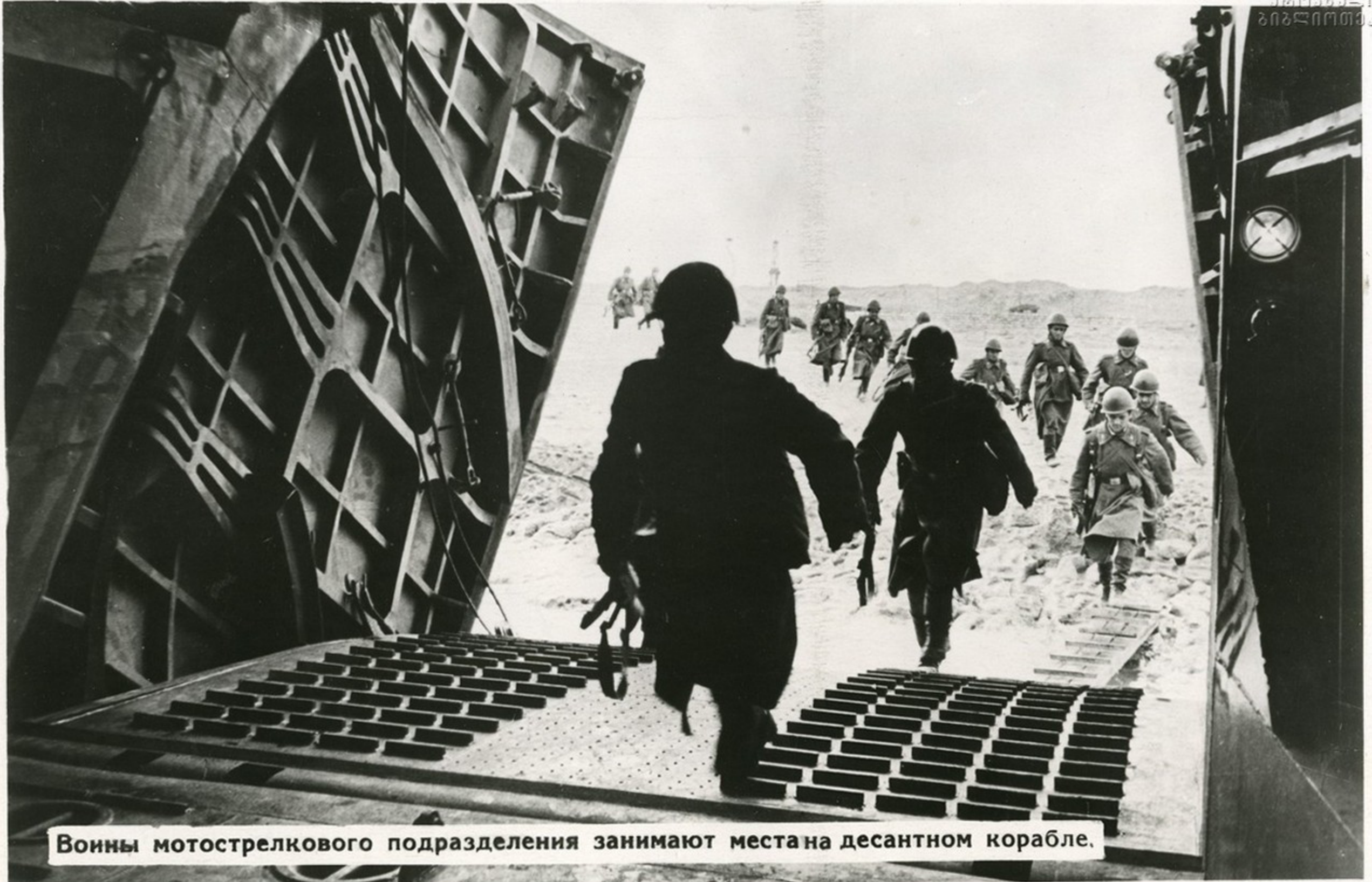
Воины мотострелкового подразделения занимают места на десантном корабле.

Закон о всеобщей воинской обязанности, принятый третьей сессией Верховного Совета СССР, предъявляет новые повышенные требования к обучению и политическому воспитанию личного состава армии и флота.