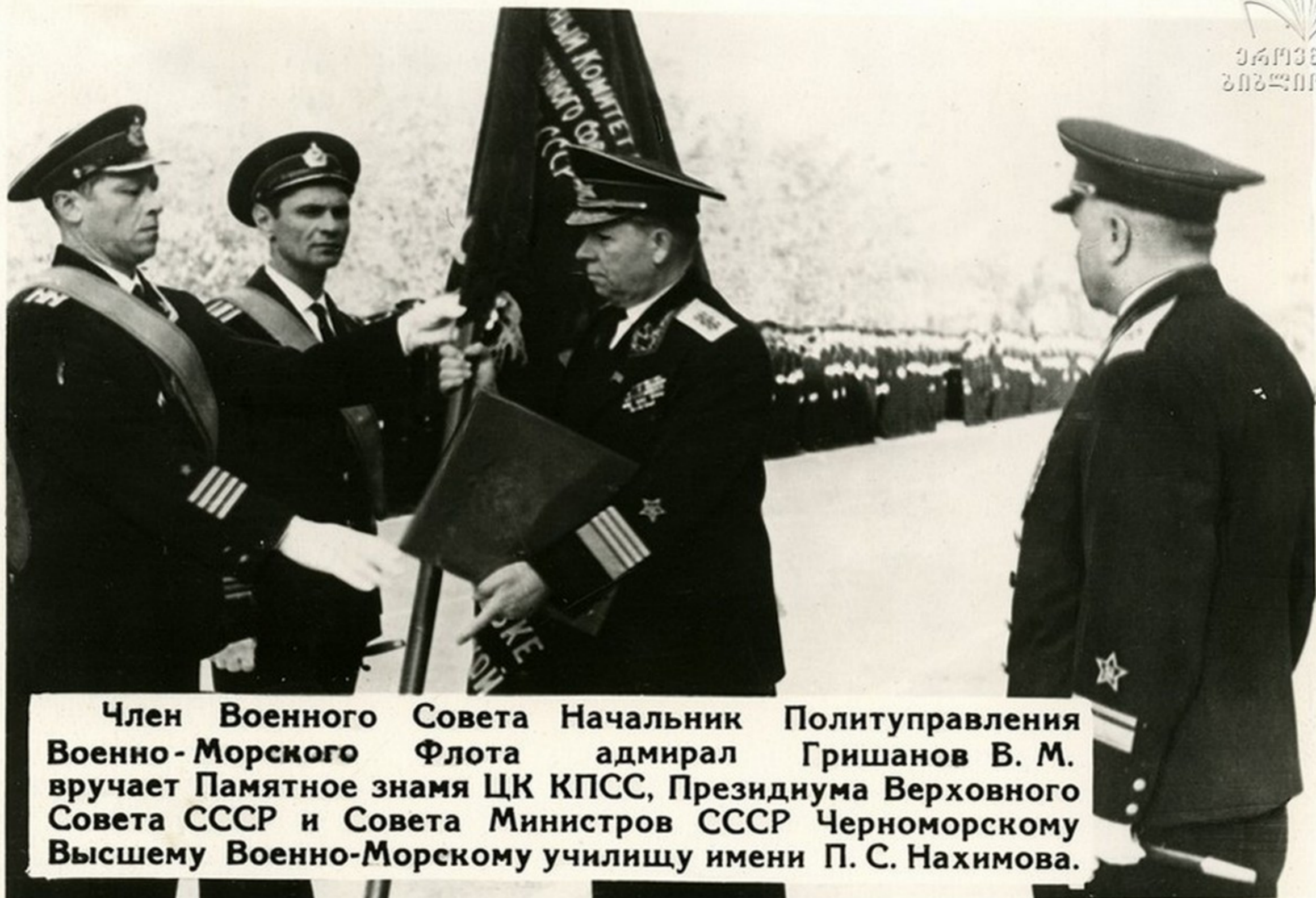
Член Военного Совета Начальник Политуправления Военно-Морского Флота адмирал Гришанов В. М. вручает Памятное знамя ЦК КПСС, Президиума Верховного Совета СССР и Совета Министров СССР Черноморскому Высшему Военно-Морскому училищу имени П. С. Нахимова.