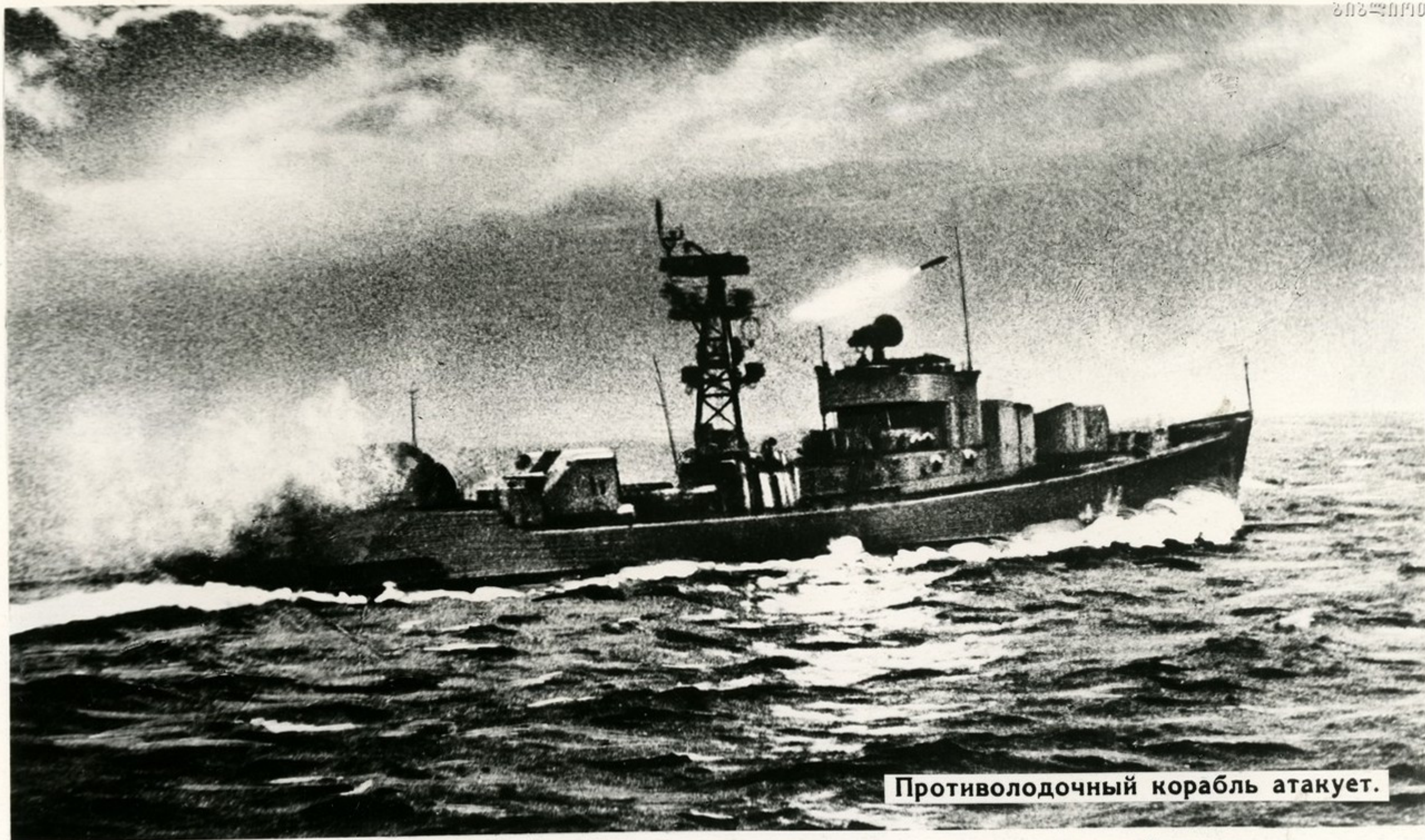
Противолодочный корабль атакует.

Резкий звон колоколов громкого боя возвестил сигнал боевой тревоги на противолодочном корабле.