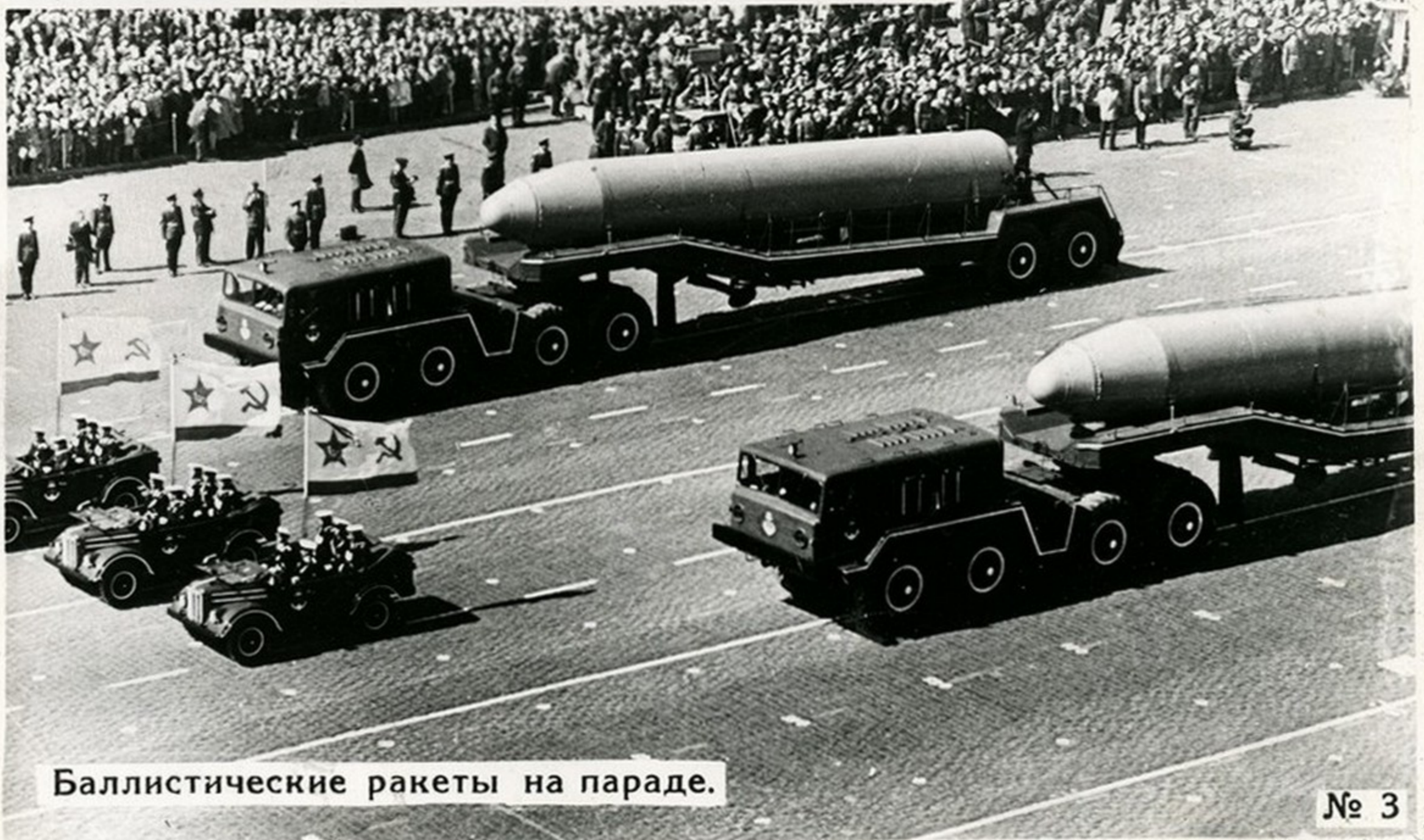
Баллистические ракеты на параде.