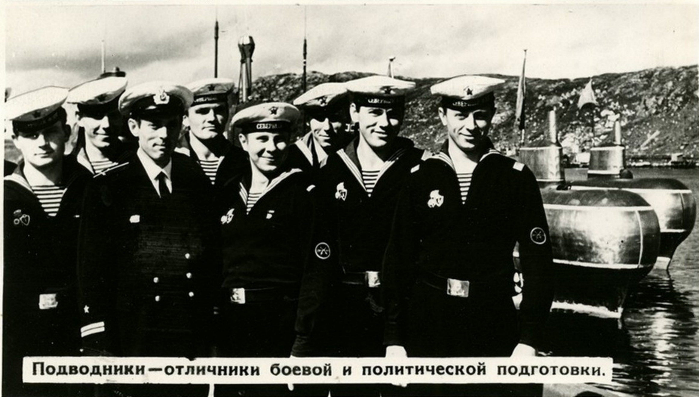
Подводники — отличники боевой и политической подготовки.

В отличной выучке и высокой боевой готовности личного состава флота живут и приумножаются славные традиции военных моряков.