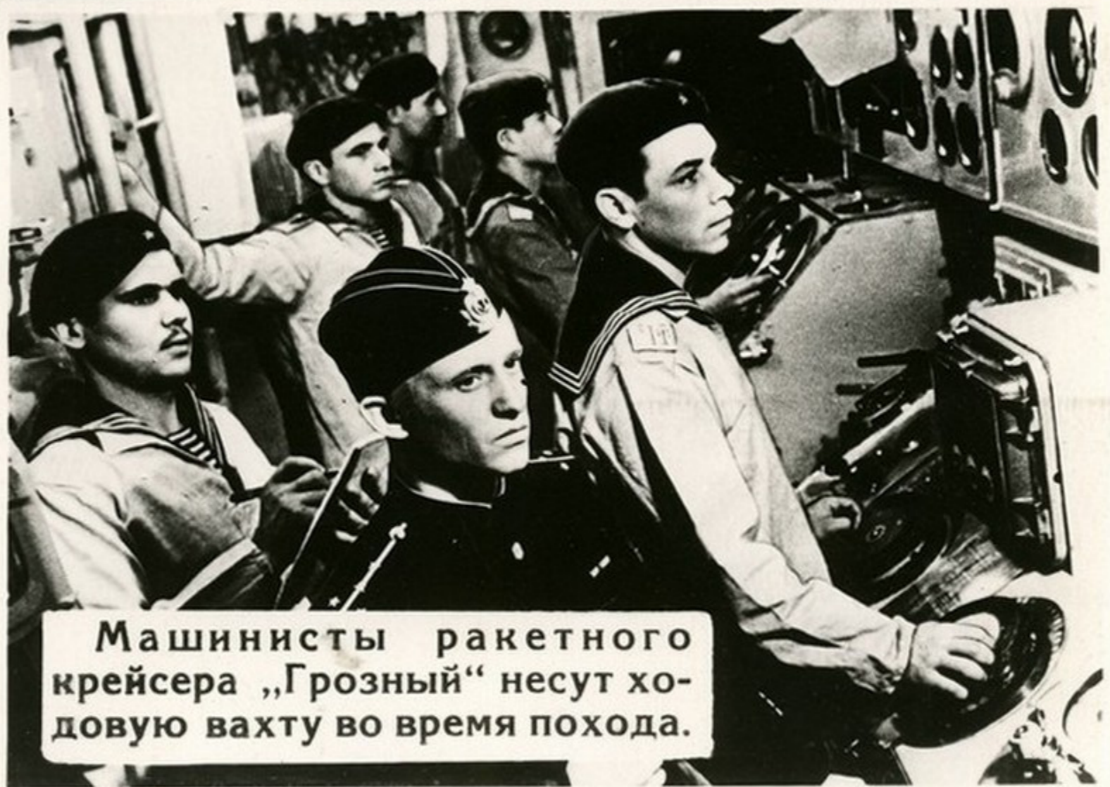
Машинисты ракетного крейсера „Грозный“ несут ходовую вахту во время похода.