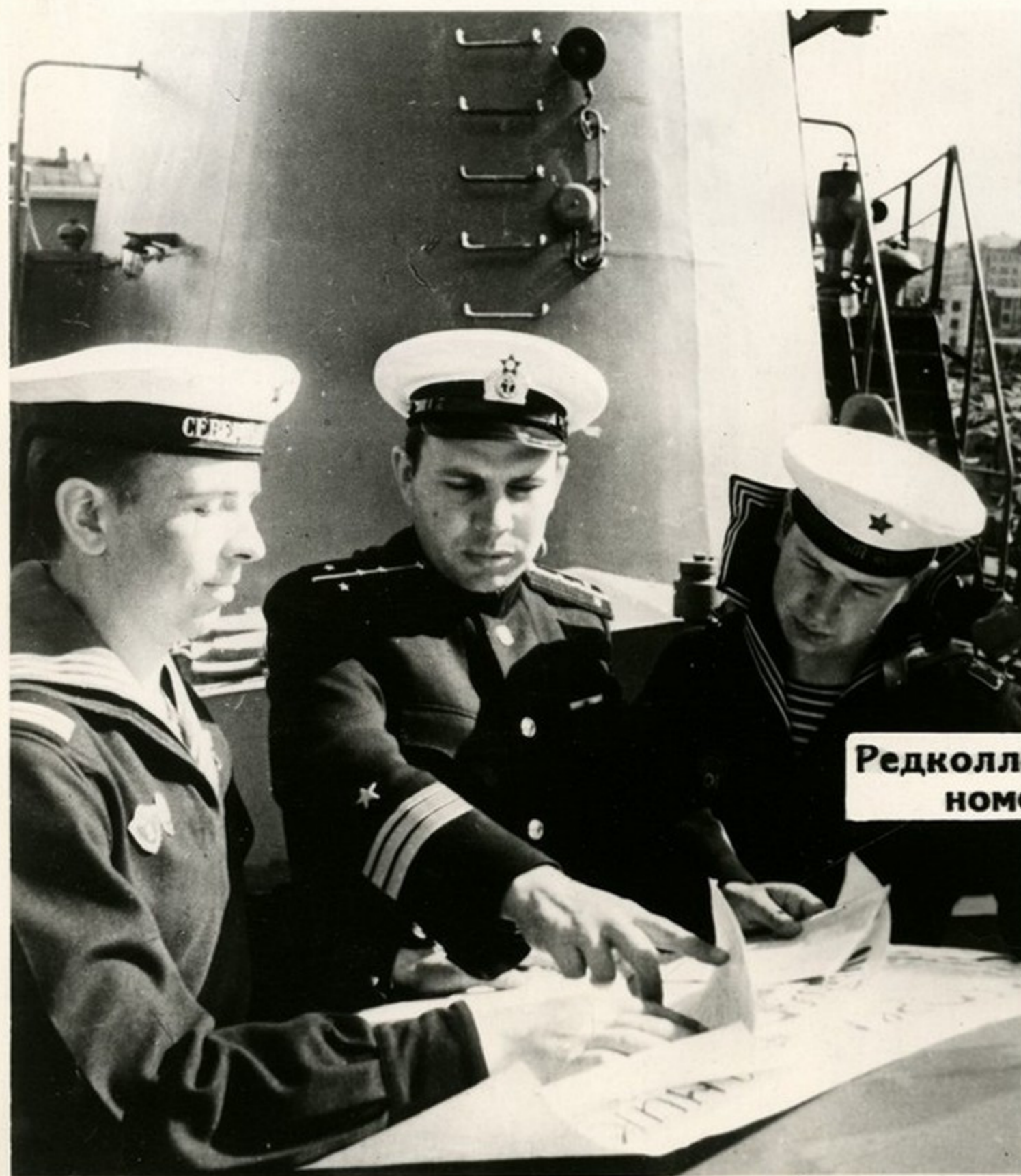
Редколлегия готовит очередной номер стенной газеты.

Много внимания уделяется полити- ческому и воинско- му воспитанию мо- ряков. Идейная за- калка определяет высокий мораль- ный дух воинов в бою, зовет их на героические под- виги.