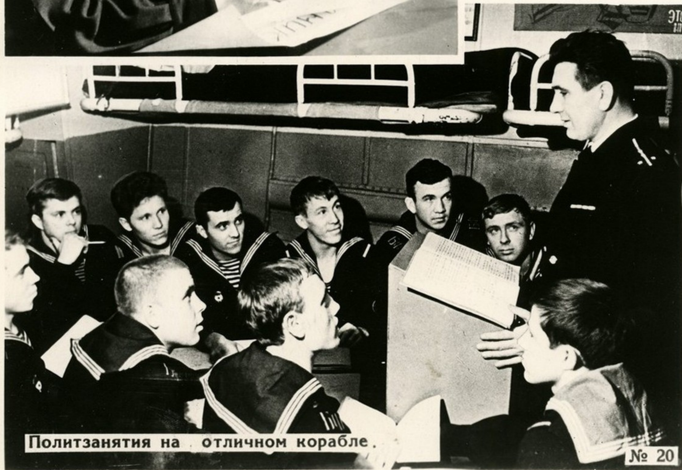
Политзанятия на отличном корабле.