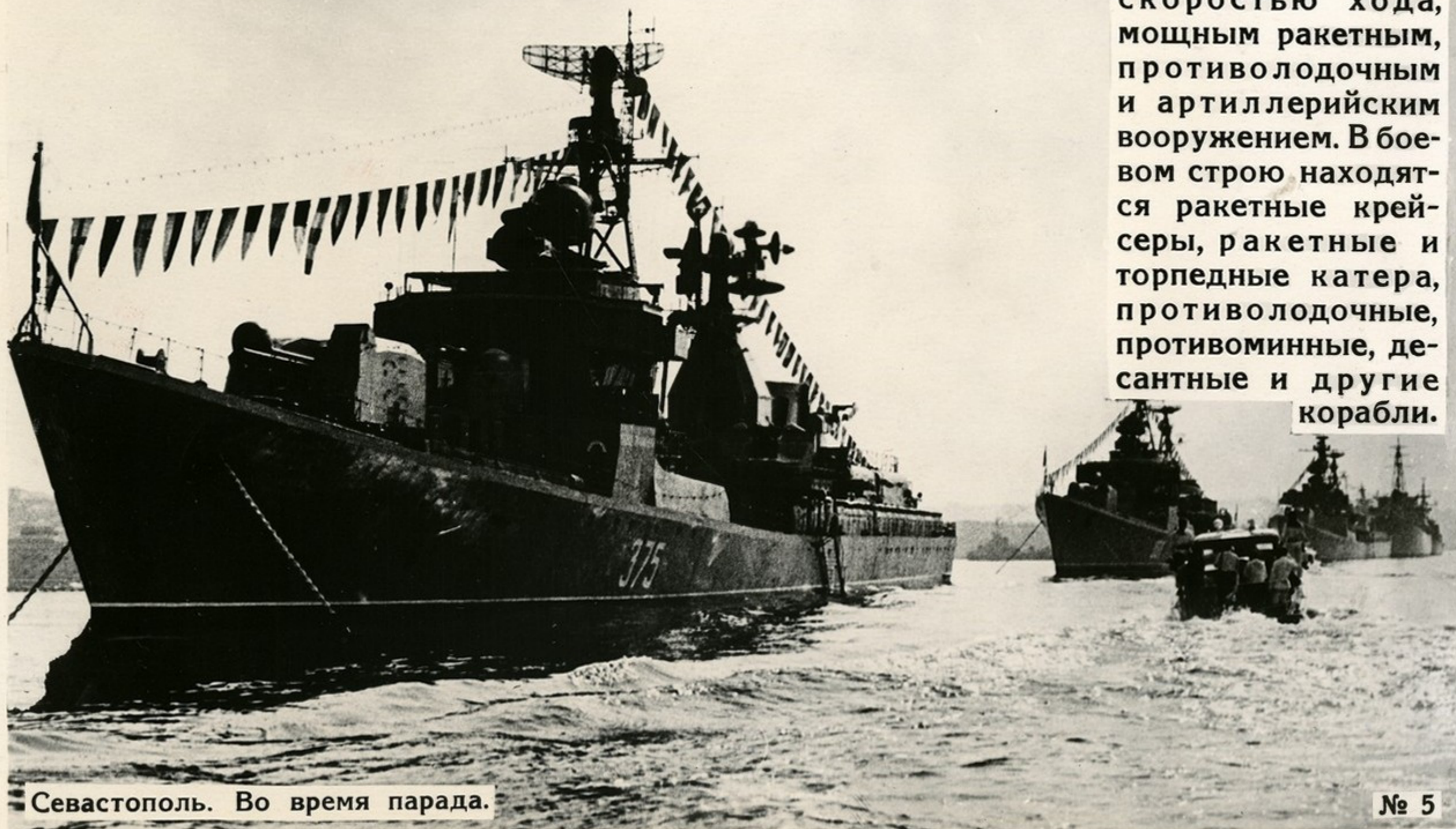
Севастополь. Во время парада.

За последние го- ды флот пополнил- ся надводными кораблями, обла- дающими большой скоростью хода, мощным ракетным, противолодочным и артиллерийским вооружением. В бое- вом строю находят- ся ракетные крей- серы, ракетные и торпедные катера, противолодочные, противоминные, де- сантные и другие корабли.