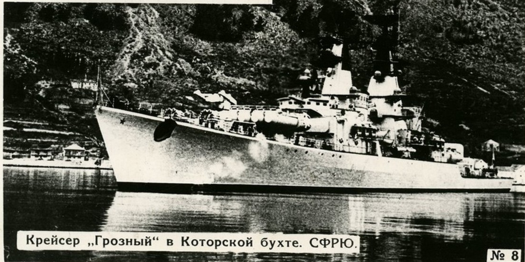
Крейсер „Грозный“ в Которской бухте. СФРЮ.