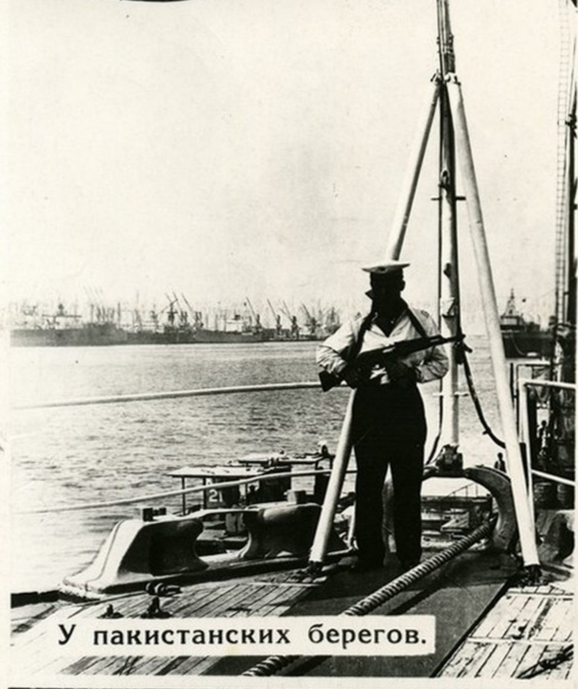
У пакистанских берегов.

Нашим кораблям доступны самые отдаленные районы мирового океана. Их можно видеть в Атлантике, Тихом океане и во льдах суровой Арктики. Дальние походы стали подлинной школой боевой выучки военных моряков и проверкой надежности корабельной техники.