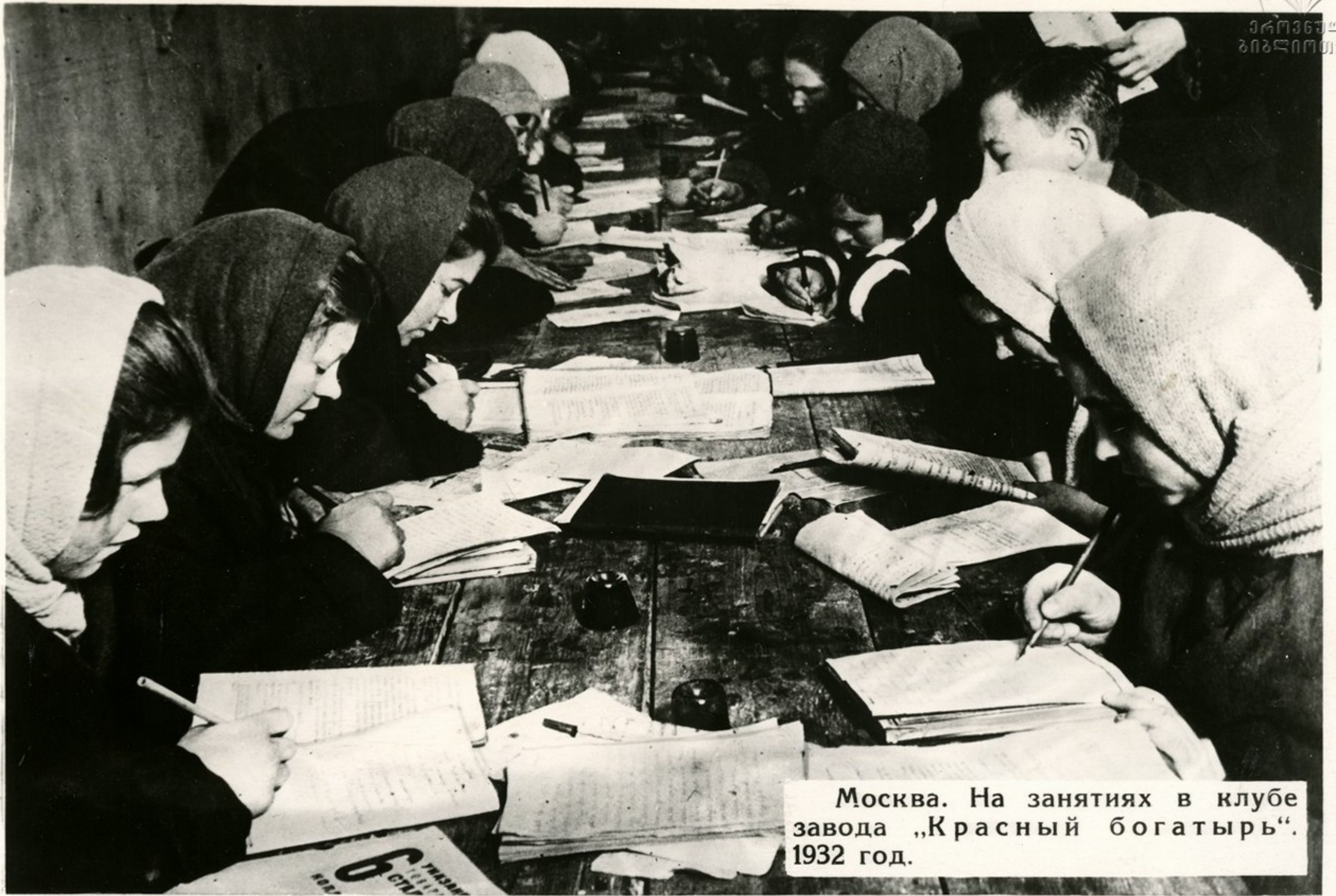
Москва. На занятиях в клубе завода „Красный богатырь“. 1932 год.

В бурные годы индустриализации страны и коллективизации сельского хозяйства миллионы рабочих и крестьян, ранее неграмотных и полуграмотных, сели за парту. Армия учителей и культурмейцев пошла в невиданный по масштабу поход против неграмотности.