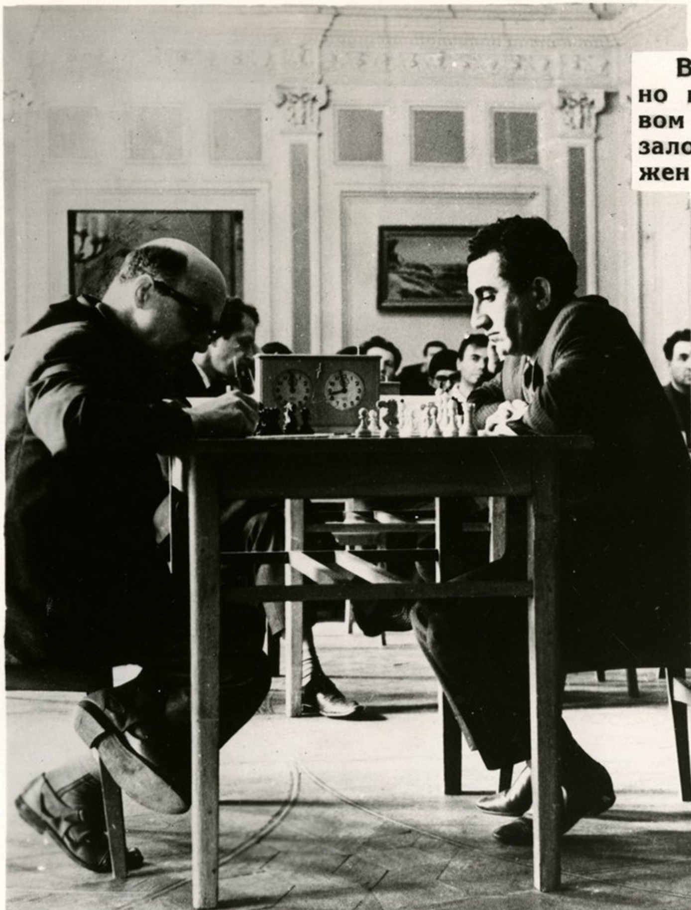
Играют Д. Бронштейн и чемпион мира Т. Петросян.

В Центральном шахматном клубе проведено первенство Москвы по шахматам. На первом месте Д. Бронштейну и Т. Петросяну оказалось тесно. Спор между ними будет продолжен в дополнительном матче.