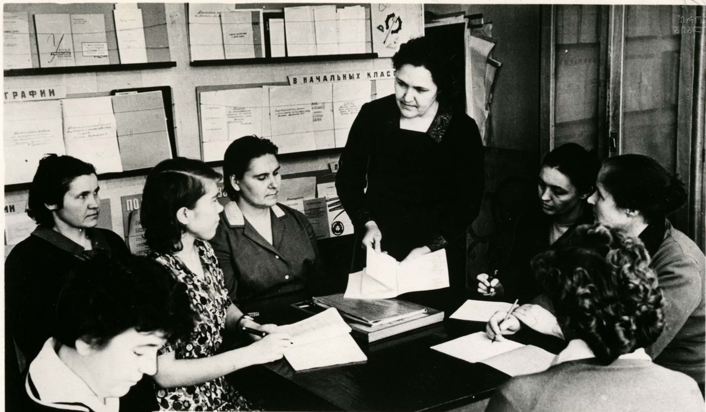
Заседание методического совета учителей начальных классов школы № 61 города Воронежа. Все лучшее, что можно использовать в работе с учащимися, методический совет распространяет у себя в школе.

В тесной связи школы, семьи и общественности советское учительство видит один из основных путей дальнейшего поднятия уровня обучения и коммунистического воспитания подрастающего поколения.