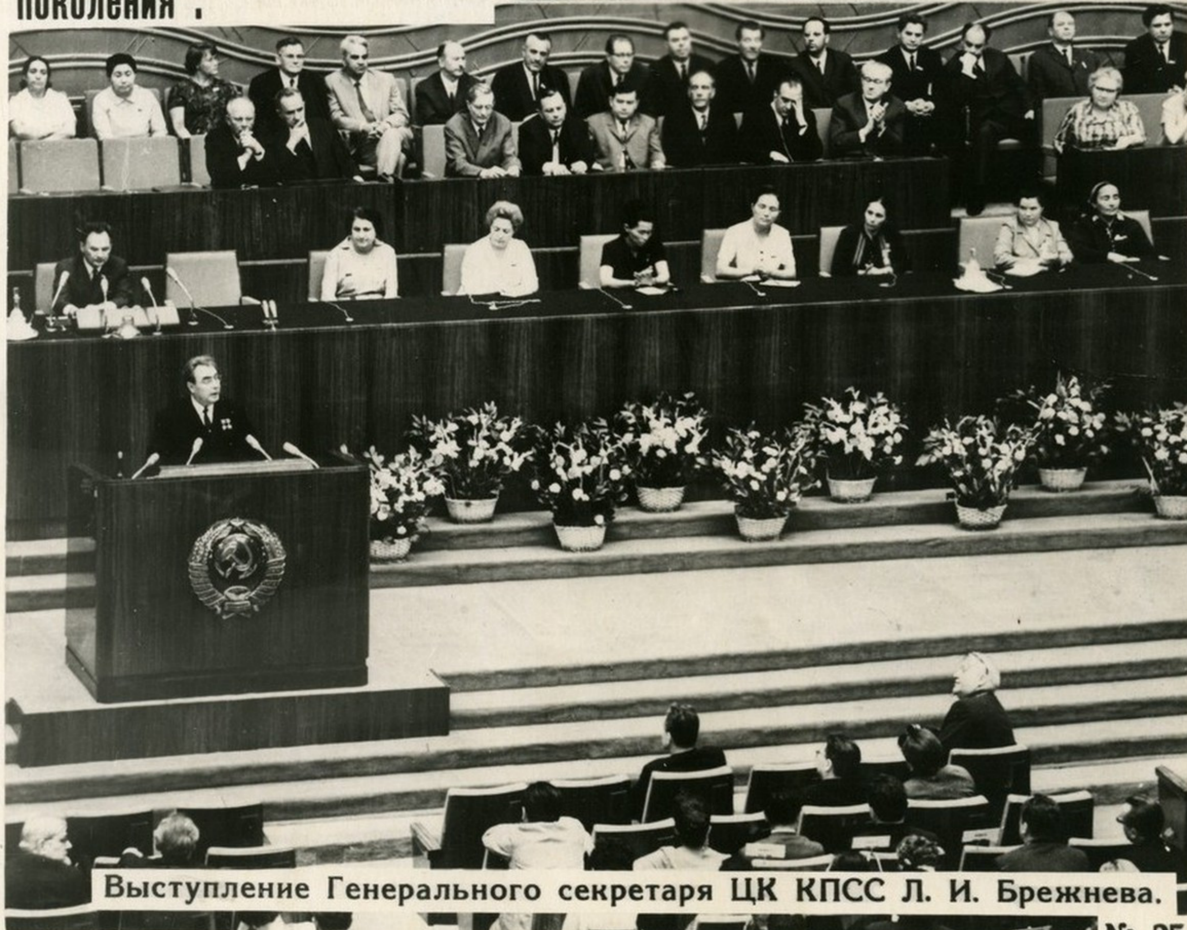
Выступление Генерального секретаря ЦК КПСС Л. И. Брежнева.