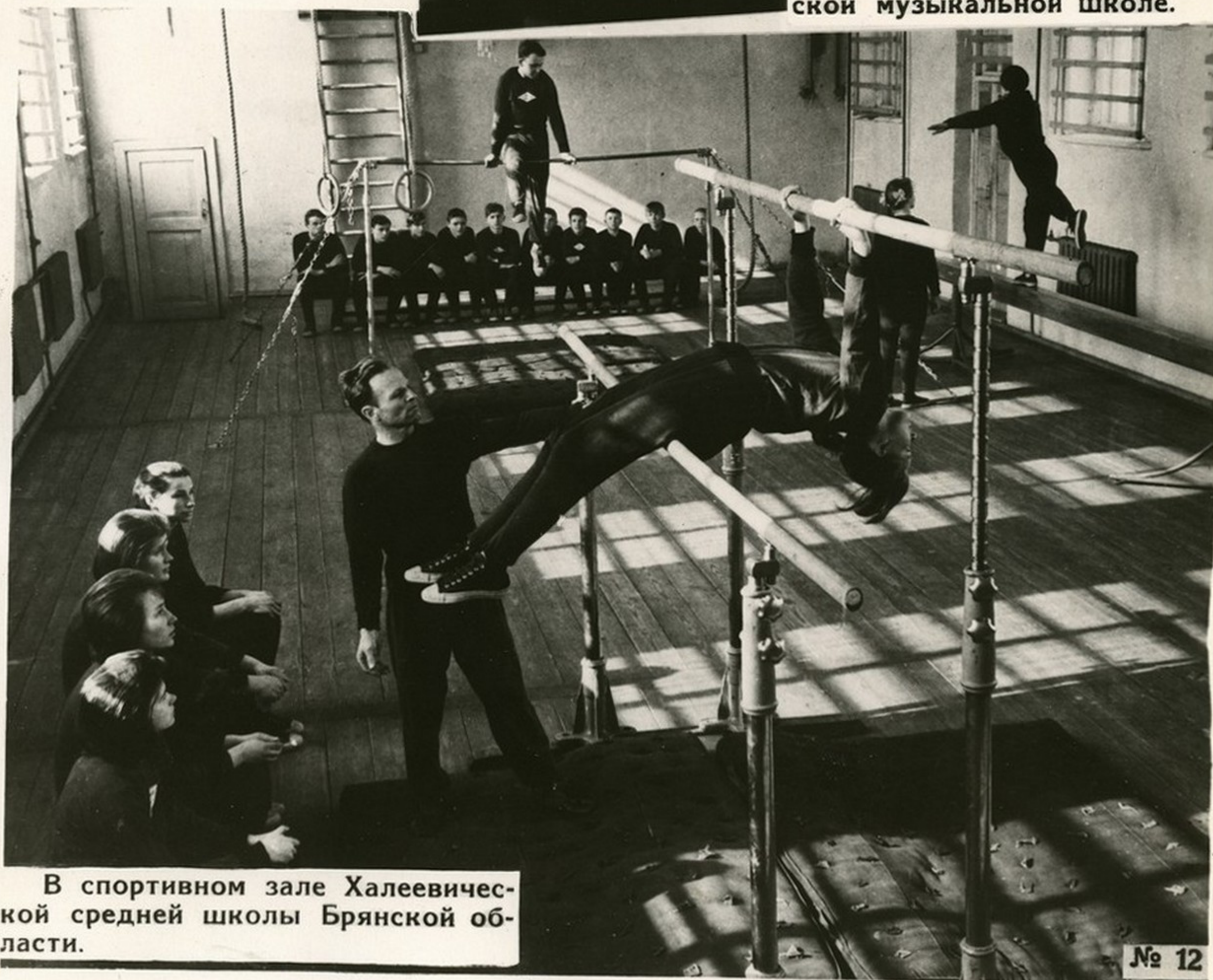
В спортивном зале Халеевической средней школы Брянской области.