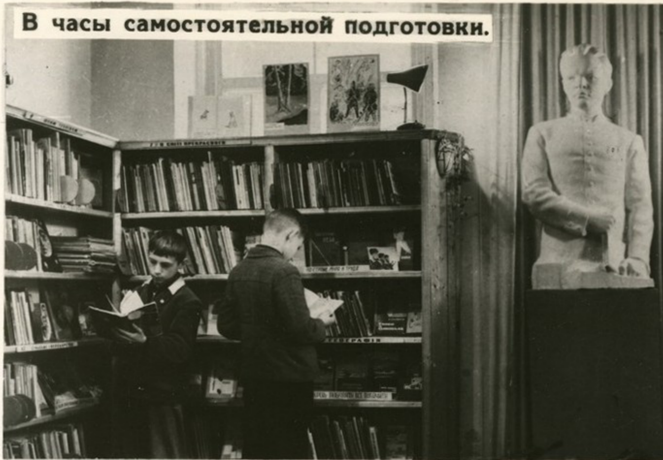
В часы самостоятельной подготовки.