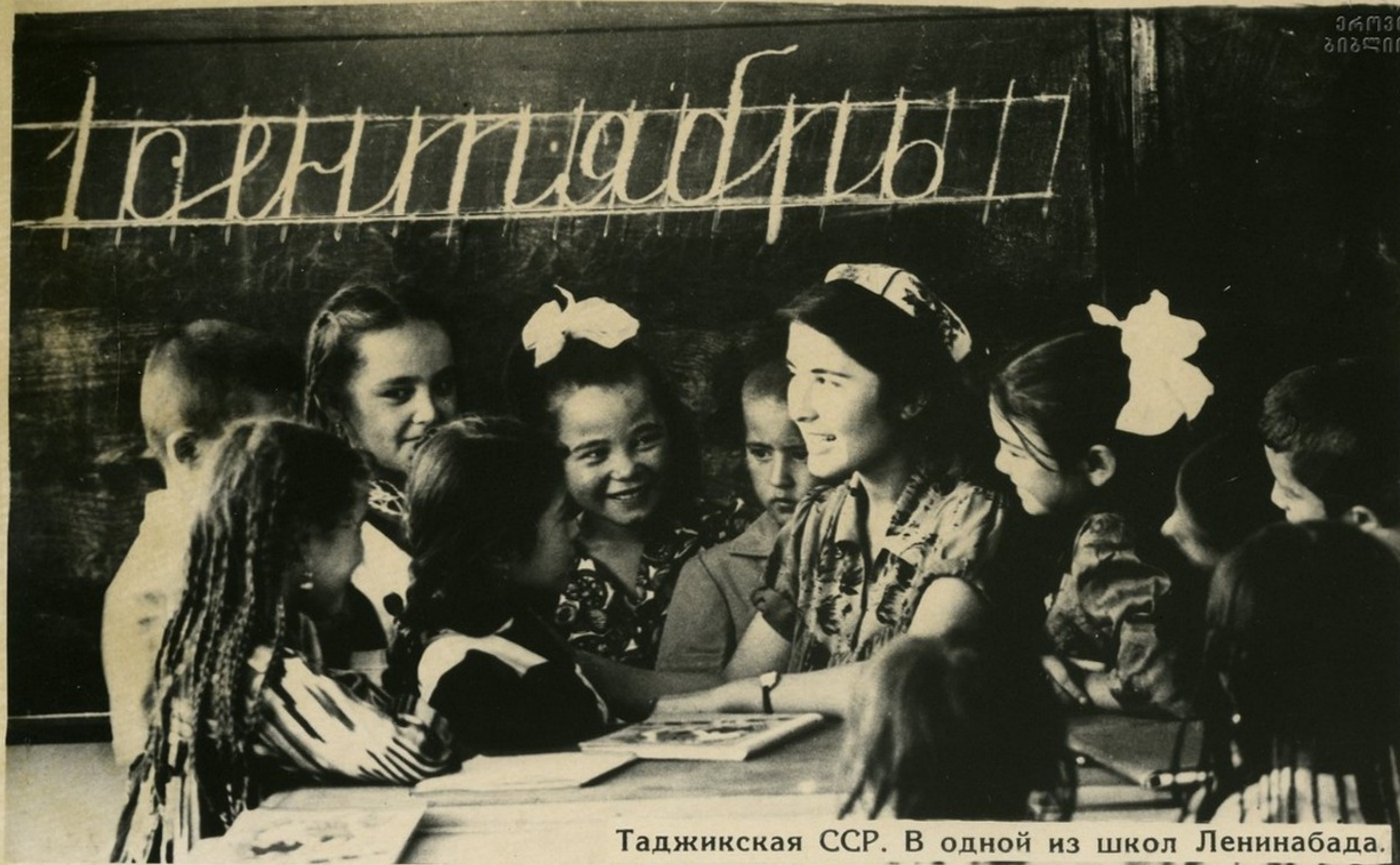
Таджикская ССР. В одной из школ Ленинабада.

Вместе с ростом числа школ и других учебных заведений, с поднятием уровня образованности увеличивалась численность, менялся социальный и национальный состав учительства.