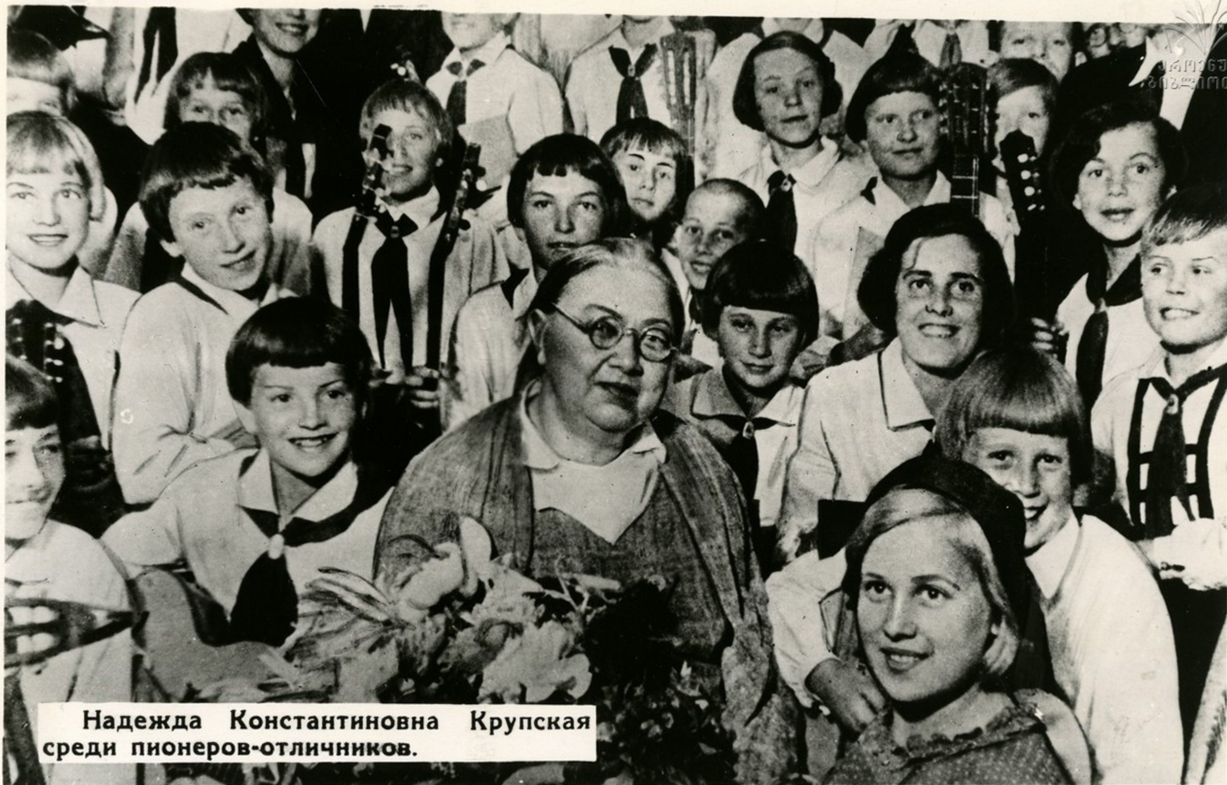
Надежда Константиновна Крупская среди пионеров-отличников.

В. И. Ленин, Н. К. Крупская, М. И. Калинин, А. В. Луначарский и другие видные деятели Коммунистической партии и Советского государства постоянно общались с учителями, хорошо знали их нужды и запросы, помогали в трудном деле просвещения народа.