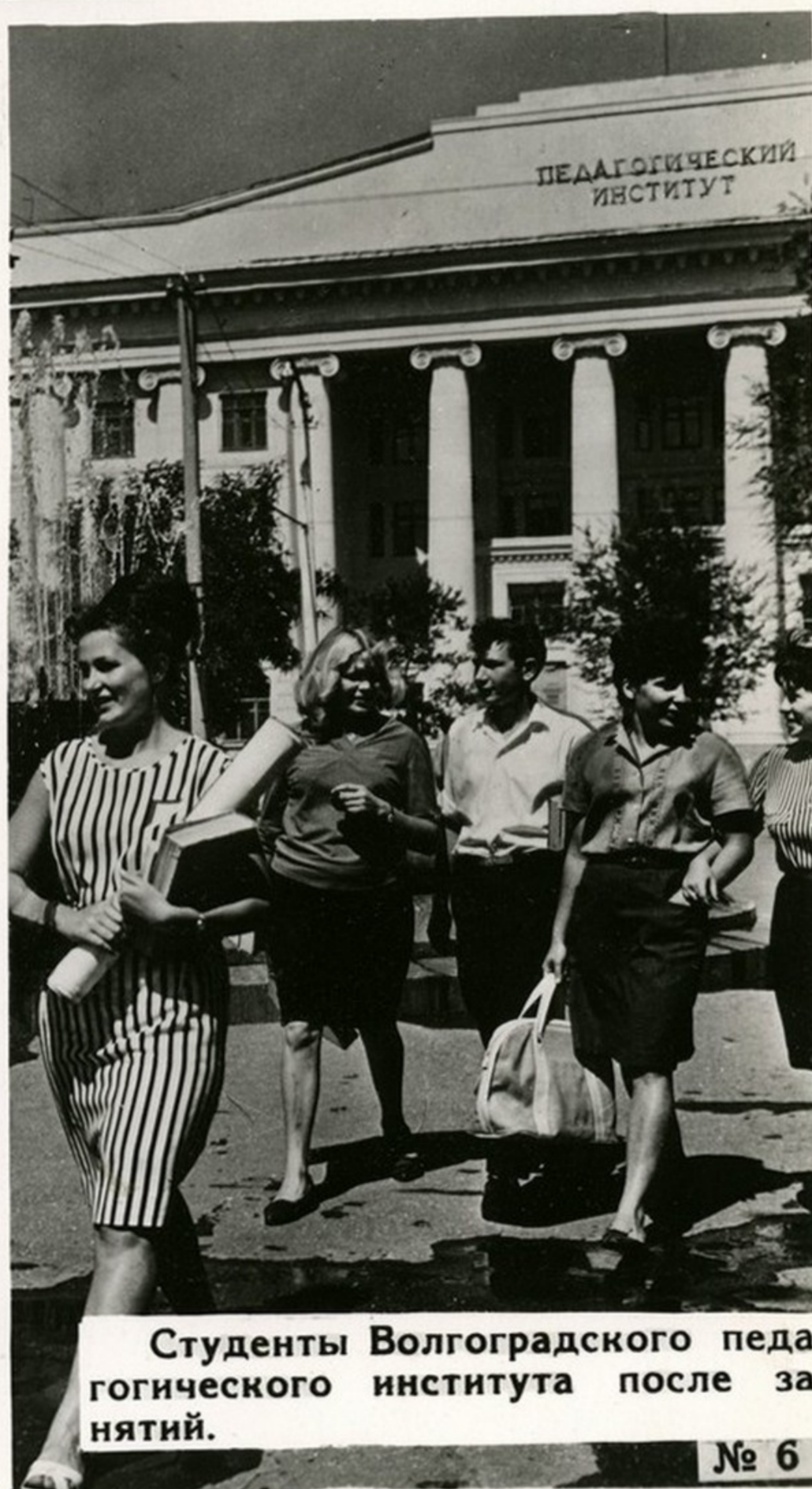
Студенты Волгоградского педагогического института после занятий.

За годы Советской власти создана широкая сеть средних и высших педагогических учебных заведений, которые ежегодно выпускают тысячи высококвалифицированных специалистов-педагогов. Около трех миллионов учителей сегодня трудятся в школах страны.