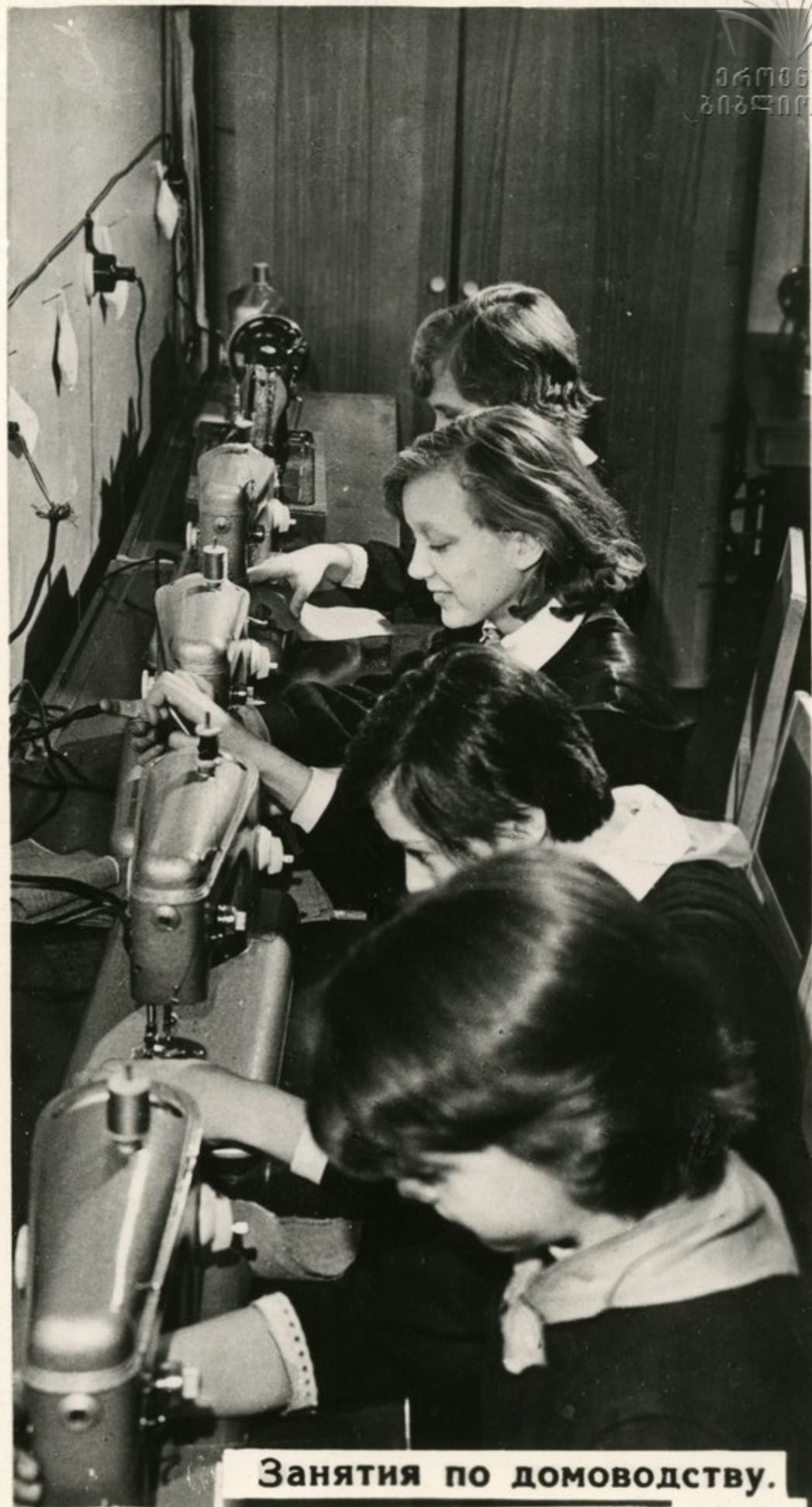
Занятия по домоводству.