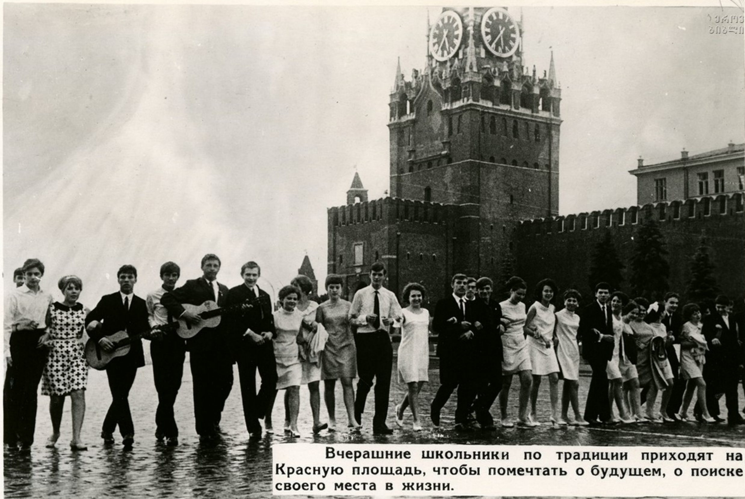
Вчерашние школьники по традиции приходят на Красную площадь, чтобы помечтать о будущем, о поиске своего места в жизни.

Начав в 30-е годы переход ко всеобщему начальному обязательному обучению, сейчас наша страна первой в мире осуществляет практический переход ко всеобщему среднему образованию. И в этом немалая заслуга советского учителя.