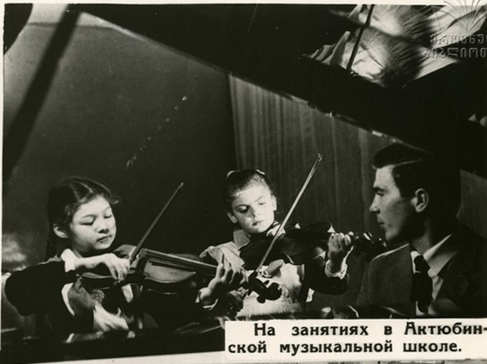
На занятиях в Актюбинской музыкальной школе.

Гармоничность физического развития, воспитание высоких эстетических вкусов являются главной заботой учителей физкультуры, пения и рисования, педагогических коллективов в целом.