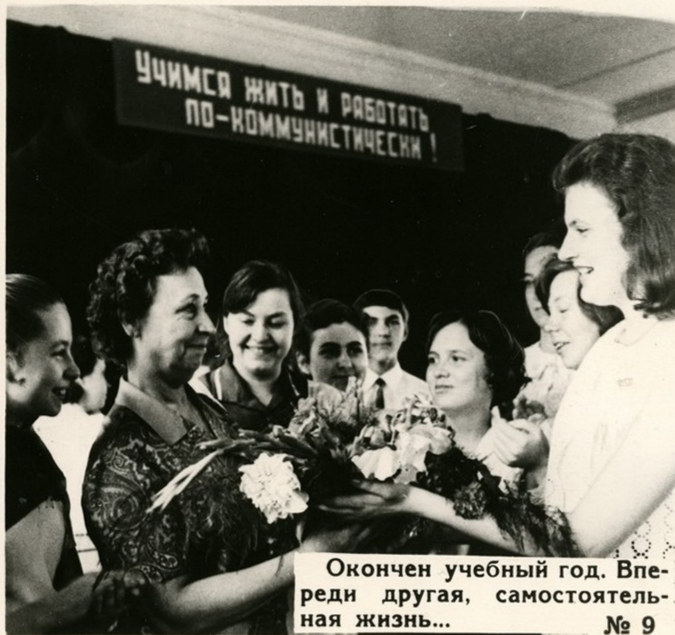
Окончен учебный год. Впереди другая, самостоятельная жизнь... № 9

На уроках литературы, обществоведения учителя прививают школьникам любовь к родной стране, своему народу и его героической истории, воспитывают глубокую веру в правоту идеалов коммунизма.