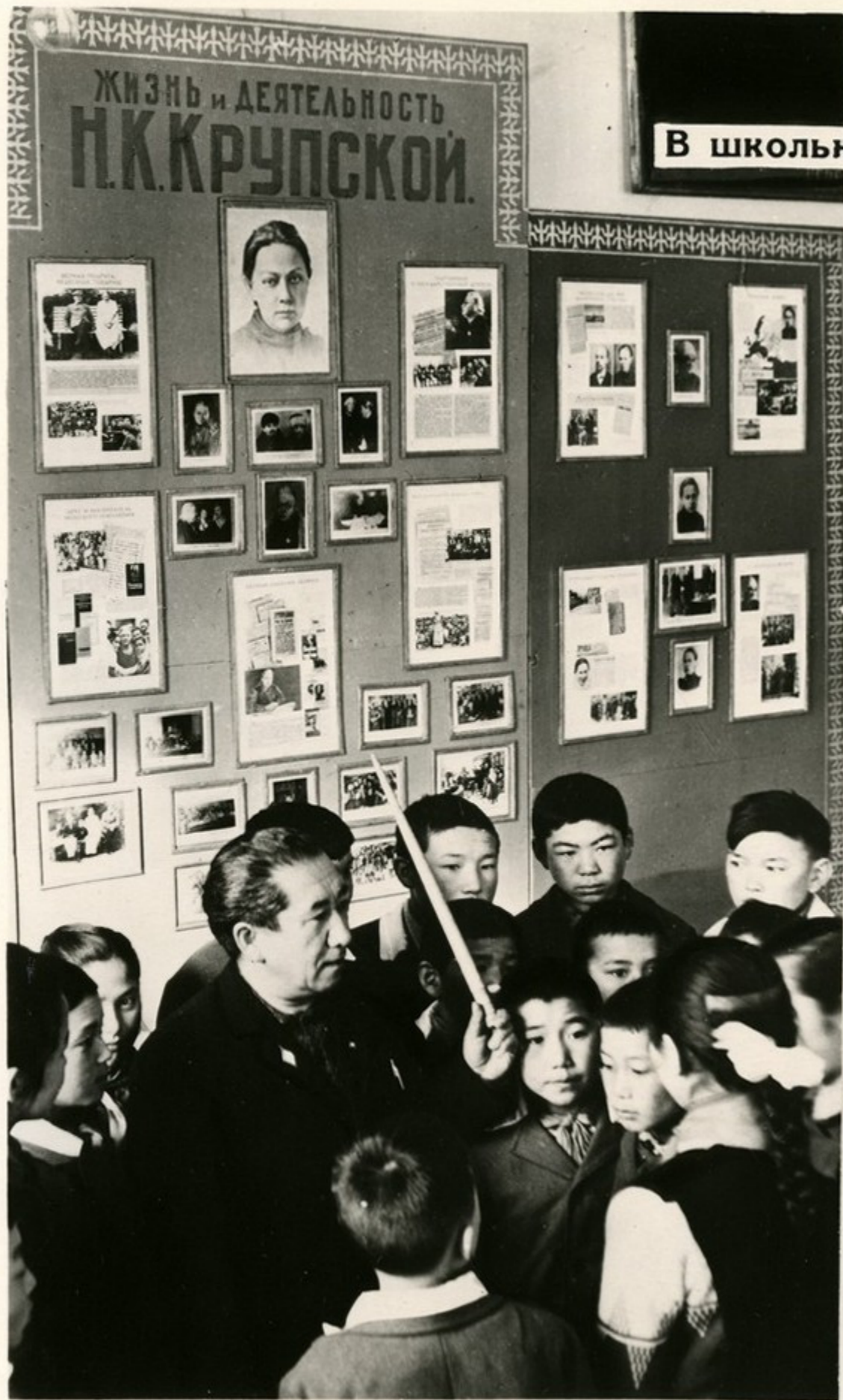
В школьном музее.

На уроках литературы, обществоведения учителя прививают школьникам любовь к родной стране, своему народу и его героической истории, воспитывают глубокую веру в правоту идеалов коммунизма.