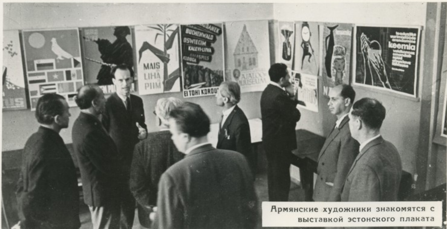
Армянские художники знакомятся с выставкой эстонского плаката

В зале общества „Знание“ в дни Недели была развернута выставка работ мастеров и любителей художественной фотографии Армении. Небольшая, но очень емкая и выразительная экспозиция пришлась по душе таллинцам. Газета „Советская Эстония“ сравнила выставку с „приветливо светящимся окном в доме большого друга“.