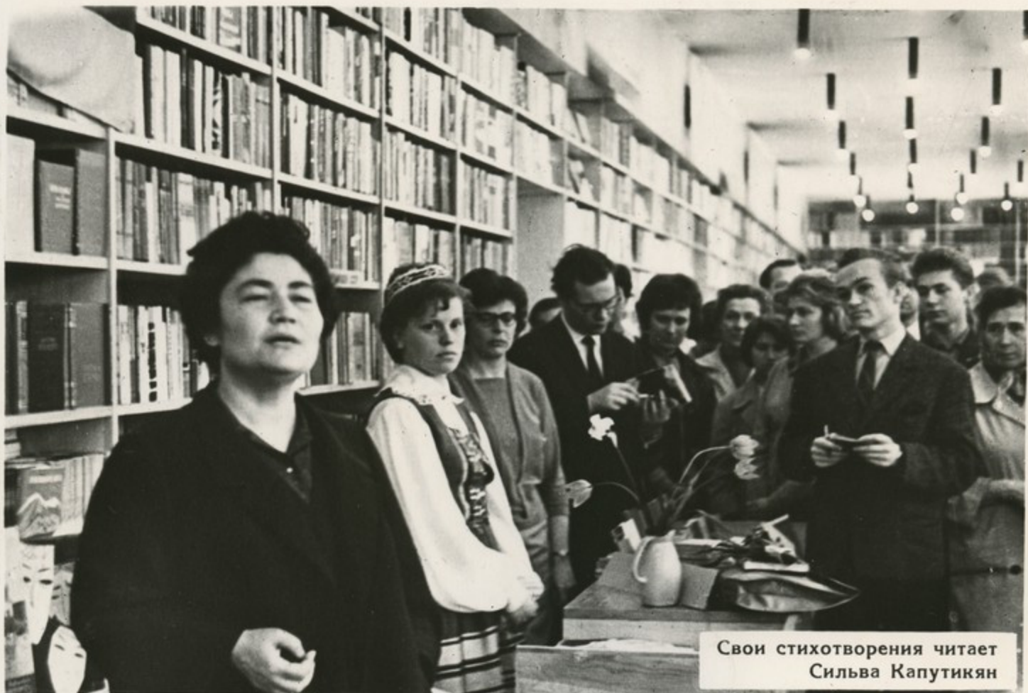
Свои стихотворения читает Сильва Капутикян