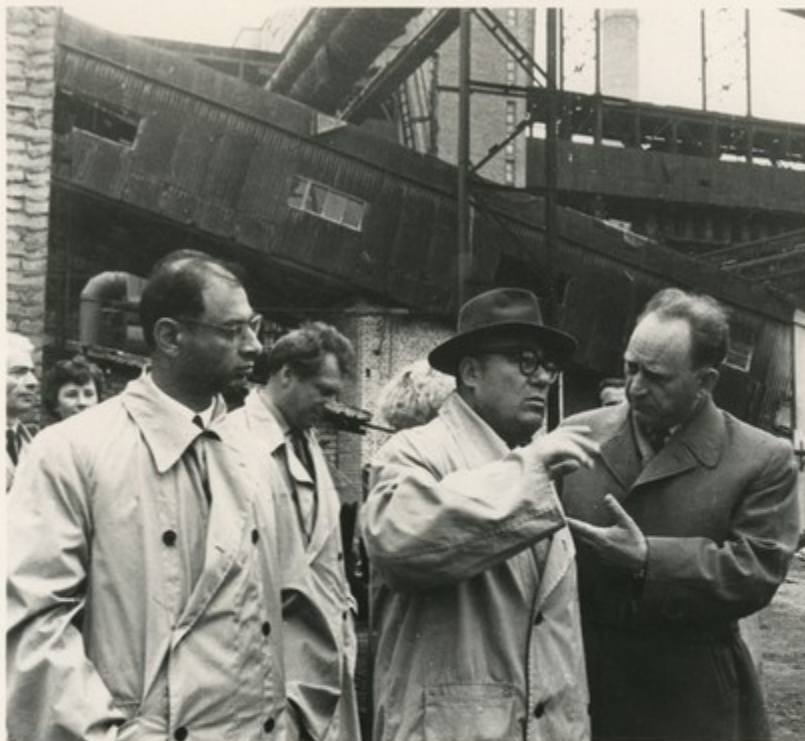
Члены делегации Армении знакомятся с промышленными предприятиями Кохтла-Ярве