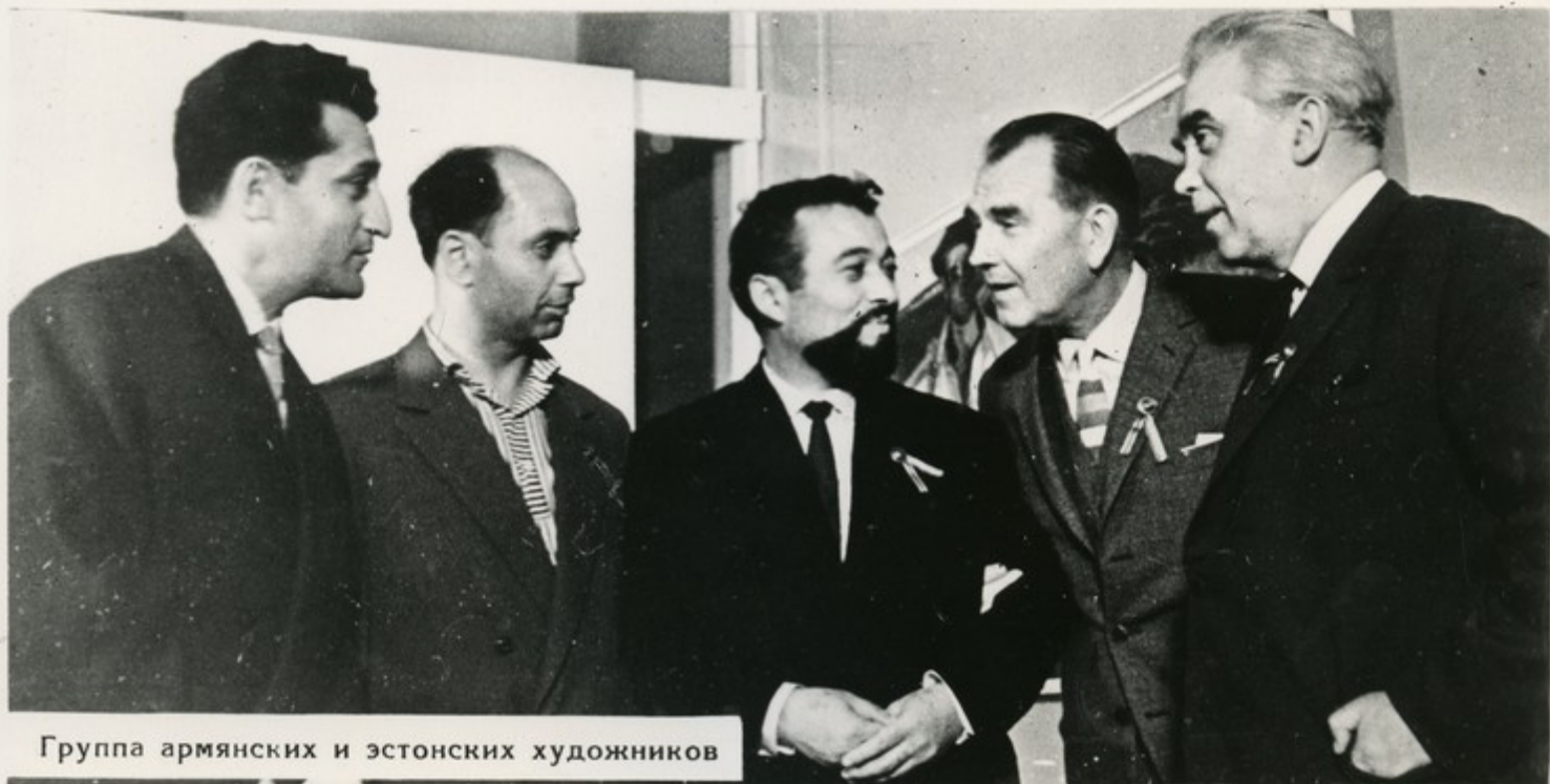
Группа армянских и эстонских художников

В центре внимания любителей изобразительного искусства Эстонии была выставка армянской живописи и графики. На ней демонстрировалось свыше 150 произведений армянских художников. За семь дней выставку посетило свыше 15 тысяч человек. Перед ее закрытием состоялась теплая встреча армянских и эстонских художников с посетителями выставки. До этого мастера кисти и резца побывали в гостях у рыбаков Эстонии.