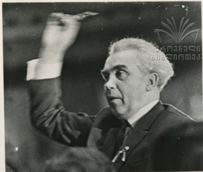
Дирижирует Густав Эрнесакс

На заключительном концерте Недели армянские песни чередовались с эстонскими. Вместе с национальными ансамблями танца, песни и пляски выступили прославленные эстонские коллективы—Государственный академический мужской хор под руководством народного артиста СССР Г. Эрнесакса, ансамбль народного танца, руководимый У. Тооми.