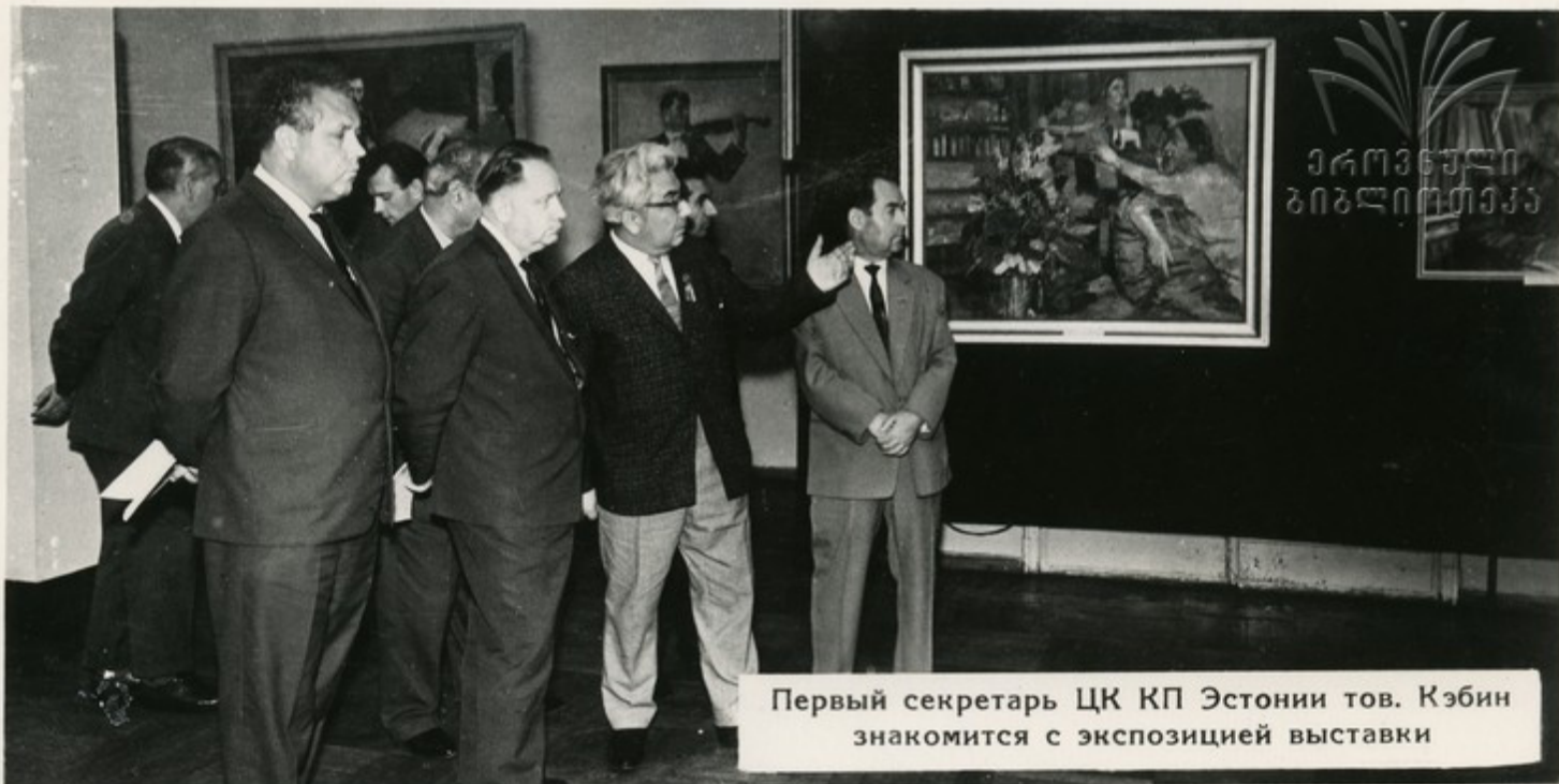
Первый секретарь ЦК КП Эстонии тов. Кэбин знакомится с экспозицией выставки

В центре внимания любителей изобразительного искусства Эстонии была выставка армянской живописи и графики. На ней демонстрировалось свыше 150 произведений армянских художников. За семь дней выставку посетило свыше 15 тысяч человек. Перед ее закрытием состоялась теплая встреча армянских и эстонских художников с посетителями выставки. До этого мастера кисти и резца побывали в гостях у рыбаков Эстонии.