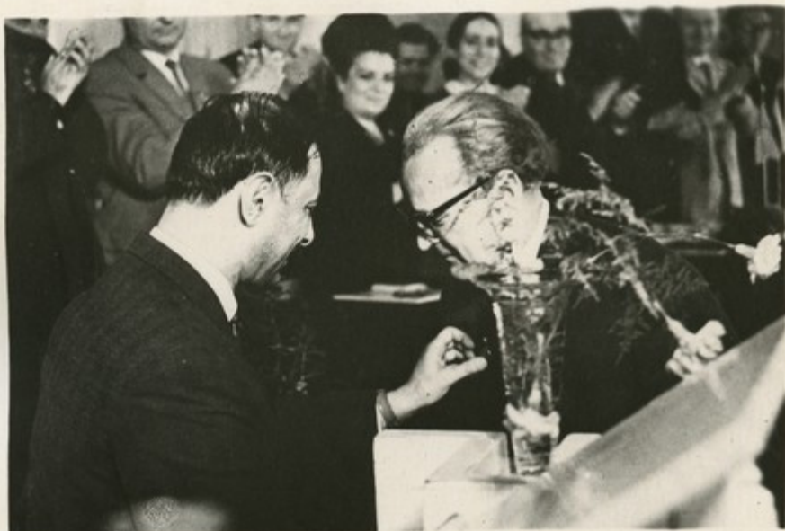
Министр культуры Армении Р. Хачатрян прикрепляет к груди эстонского академика Пауля Аристе медаль имени Х. Абовяна

На встрече гостей Армении с коллективом прославленного Тартуского университета было объявлено о решении правительства Эстонии передать в дар армянскому народу все материалы, связанные с именем Х. Абовяна.