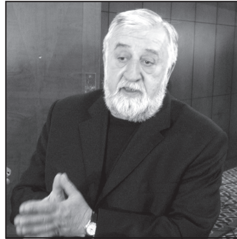
სურცილადა, ის იქნება მთავარი მოთხოვნა.

– გასაგებია. ასეთ დროს ხელისუფლება ყოველთვის ამბობს, 80 მოთხოვნა ჰქონდათ და 78 შეეცდნენ. არადა, სწორედ რაც არ