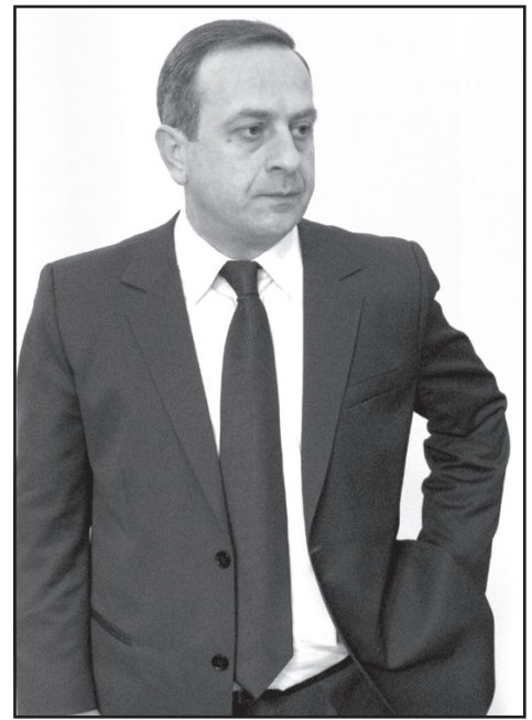
თლიანი, დემოკრატიული არჩევნების ჩასატარებლად.

— საზოგადოება მხარში გვიდგას. ხალხი აქციებზე დადის. ტყუილია, რომ საზოგადოებას ჩვენი მოთხოვნები გააზრებული არ აქვს. საზოგადოებამ იცის, რაც ხდება. 50.000 და 100.000 კაცის შეკრებას შესაძლებელია, ოღონდ ეს იქნება რევოლუციური სიტუაცია. გვირჩევნია, ყველაფერი მშვიდობიანად განვითარდეს და მივიღოთ არჩევნებამდე. ამისათვის ხელისუფლებამ კეთილი ინებოს და გადადგას ნაბიჯები სამარ-