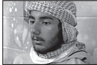
მოამზადა ნიკა თევზაძემ

თავდასხმელს ადგილზე მისულმა სამართალდამცვეებმა ესროლეს, რის შედეგადაც ის გარდაიცვალა. პოლიციამ თავდასხმა ტერორისტულ აქტად შეაფასა.