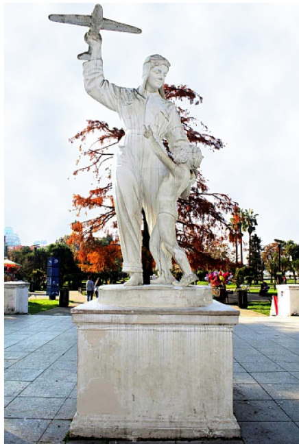
ფადიკო გოგიტიძის უკვდავსაყოფლად დადგმული მონუმენტი