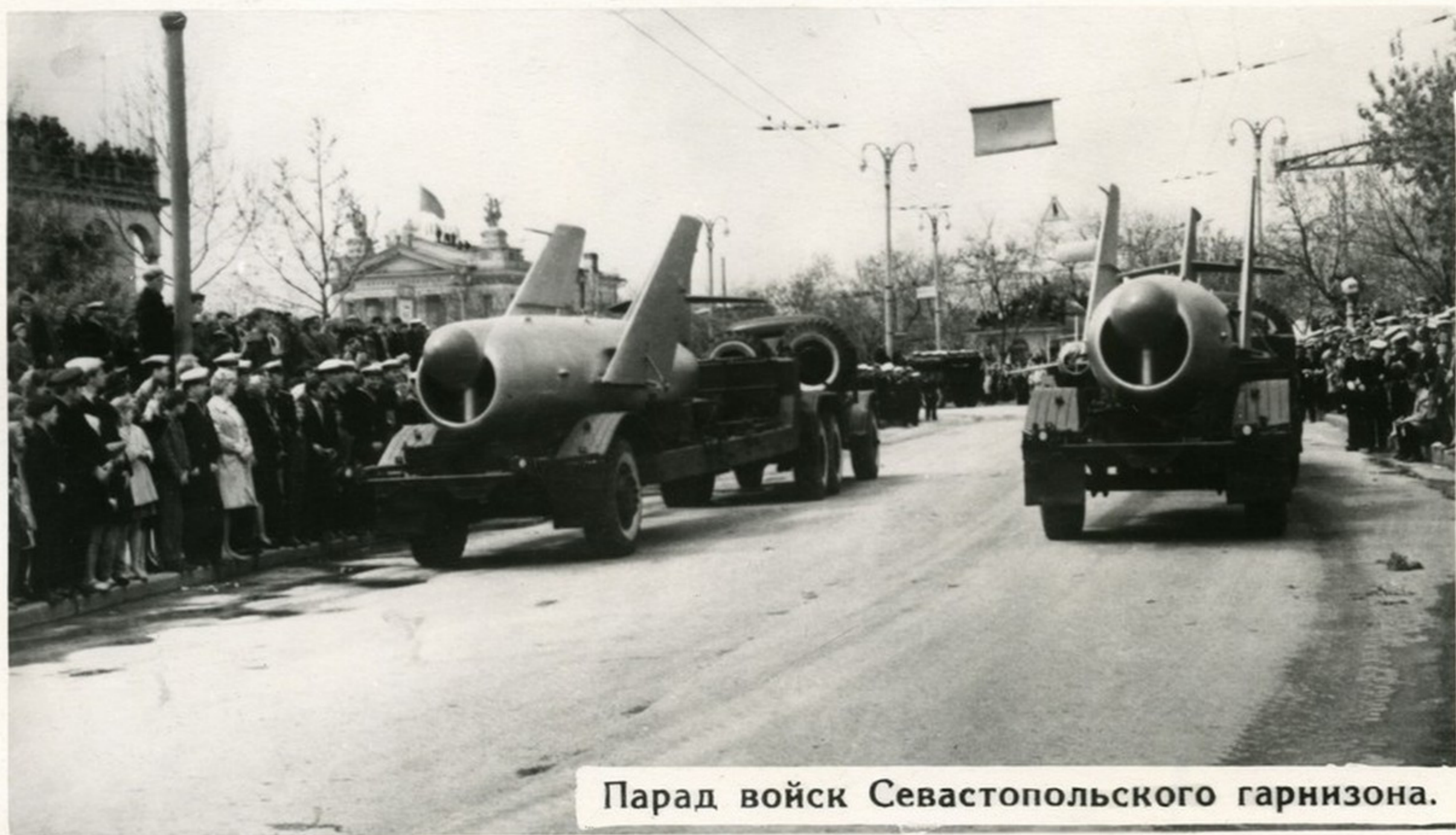
Парад войск Севастопольского гарнизона.