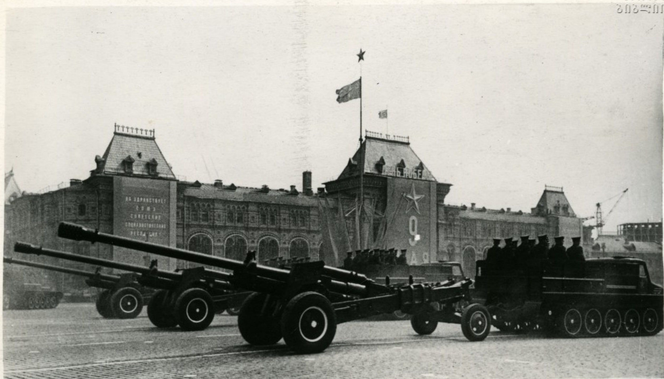
Перед трибунами движется артиллерия.