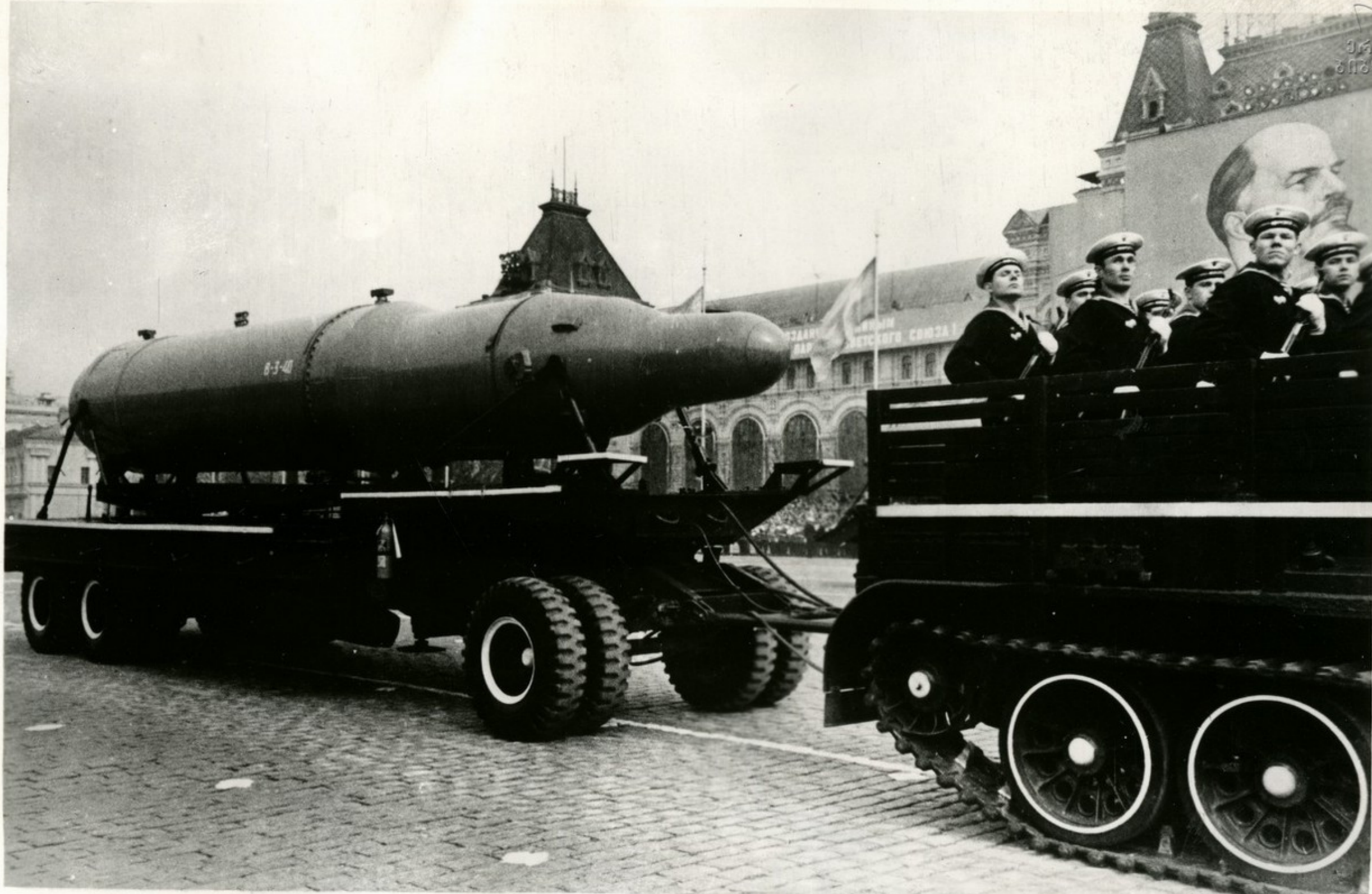
Этими ракетами вооружены наши океанские подводные лодки. Они имеют мощные ядерные боеголовки, запускаются из-под воды и поражают цели, удаленные на тысячи километров от места старта.