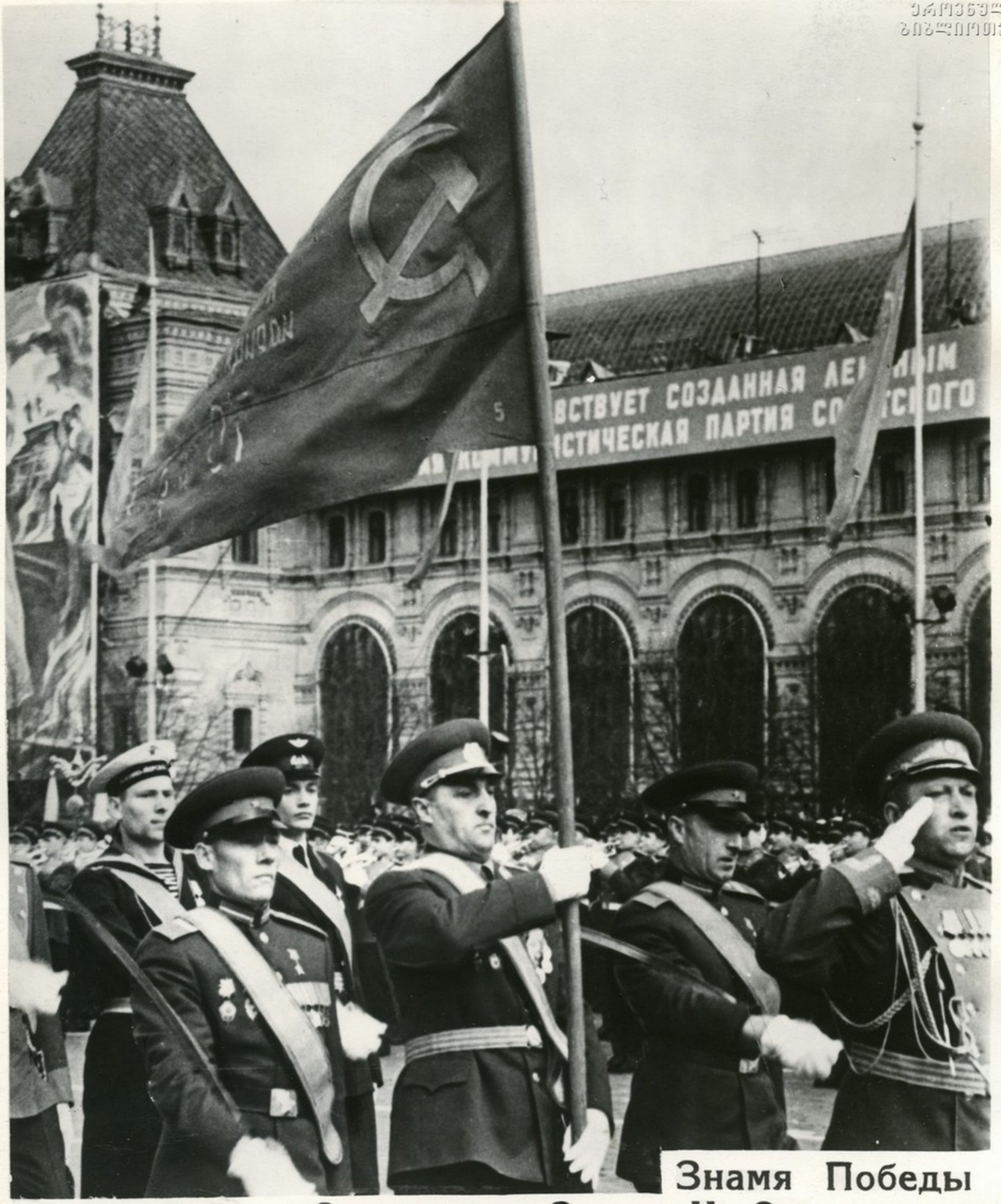
Знамя Победы несут Герои Советского Союза К. Самсонов (в центре), М. Егоров и М. Кантария. 20 лет назад сержант М. Егоров и младший сержант М. Кан- тария водрузили его над рейхстагом.