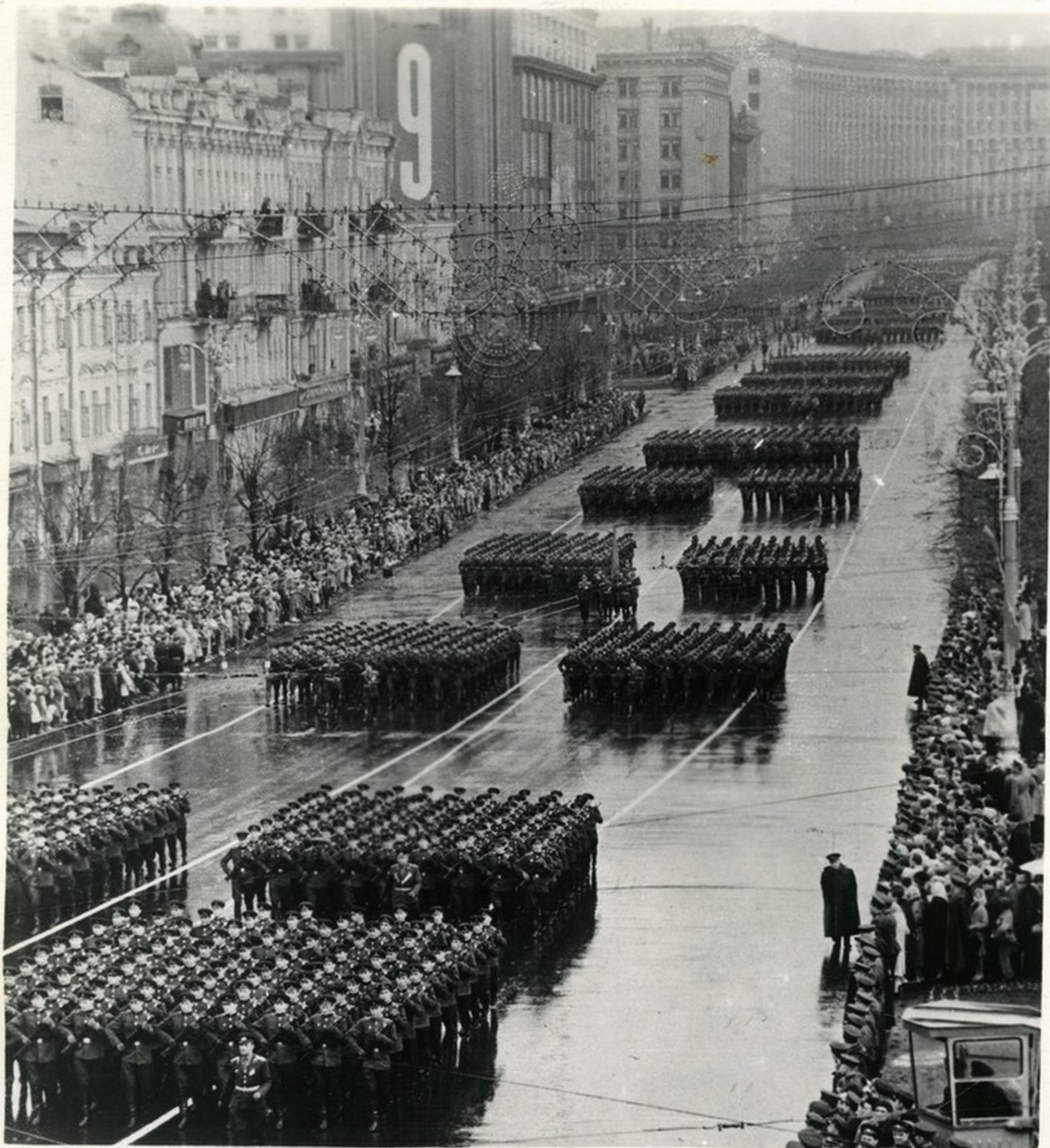
Парад на Крещатике.