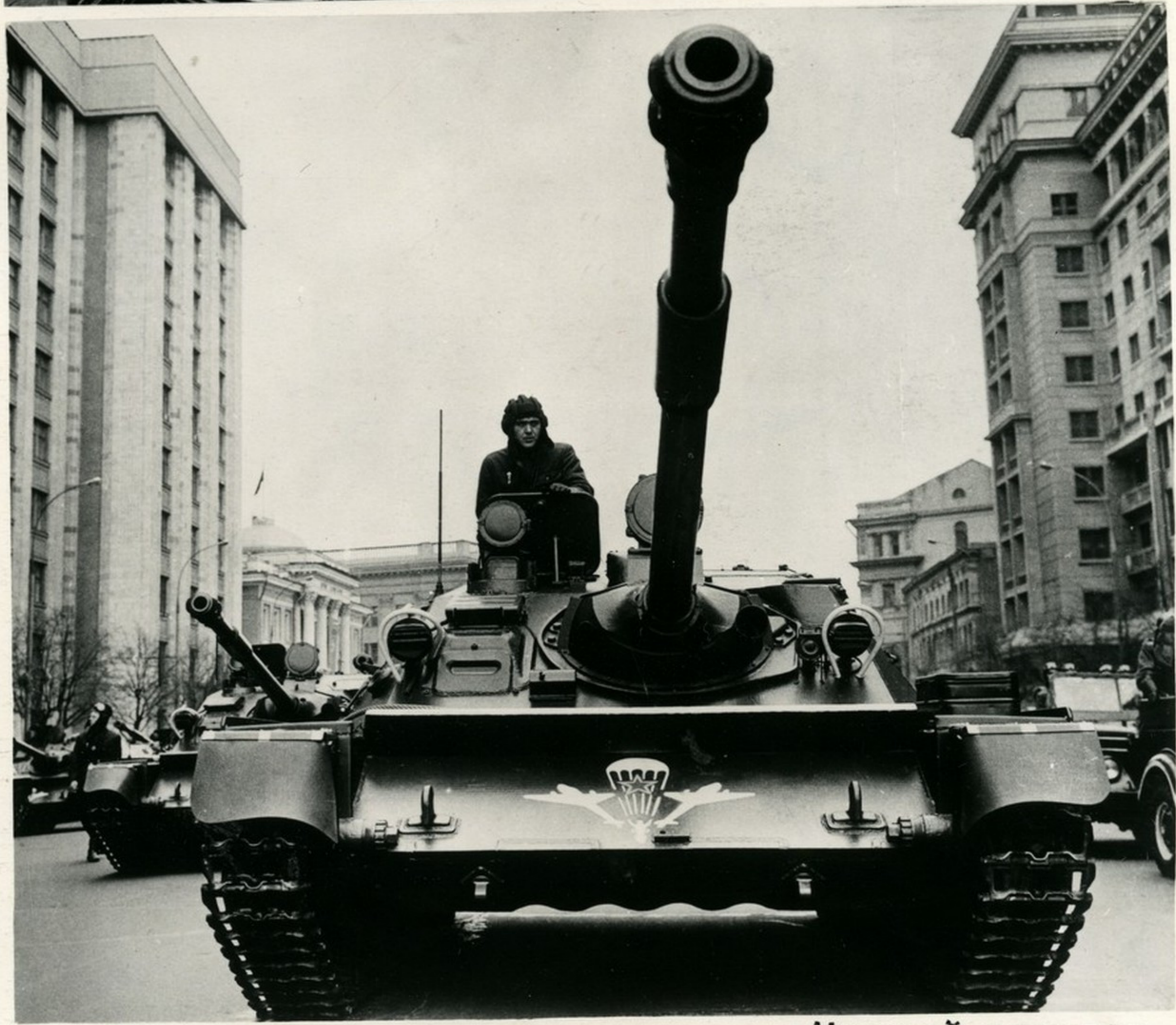
Гвардейцы-десантники направляются к Красной площади.