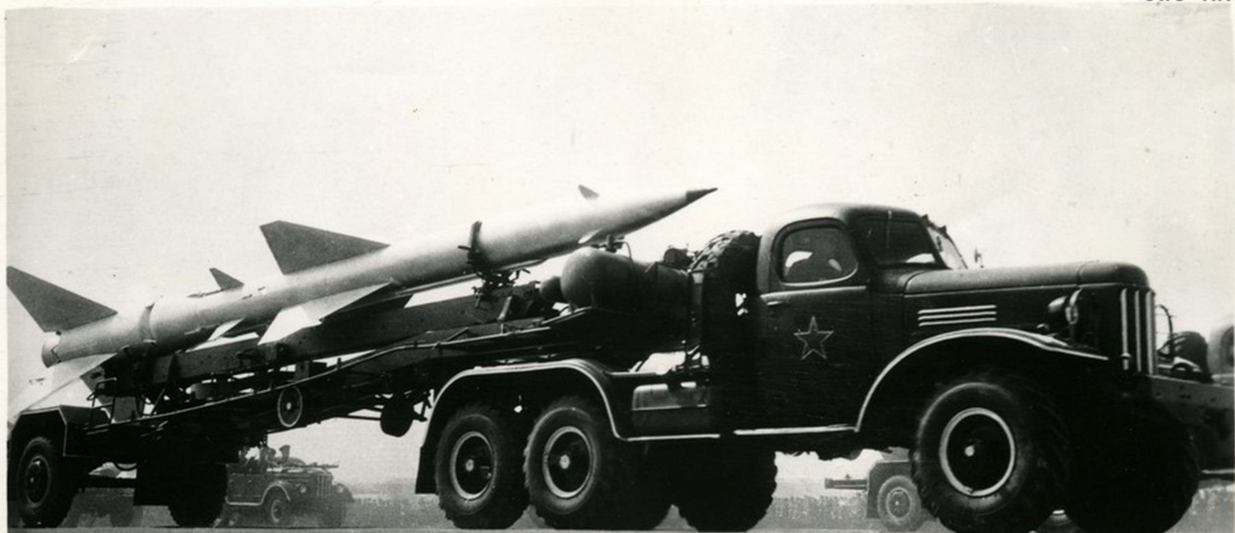
Зенитные управляемые ракеты. Они способны уничтожать в воздухе любые самолеты и крылатые ракеты, на какой бы высоте они ни летали.