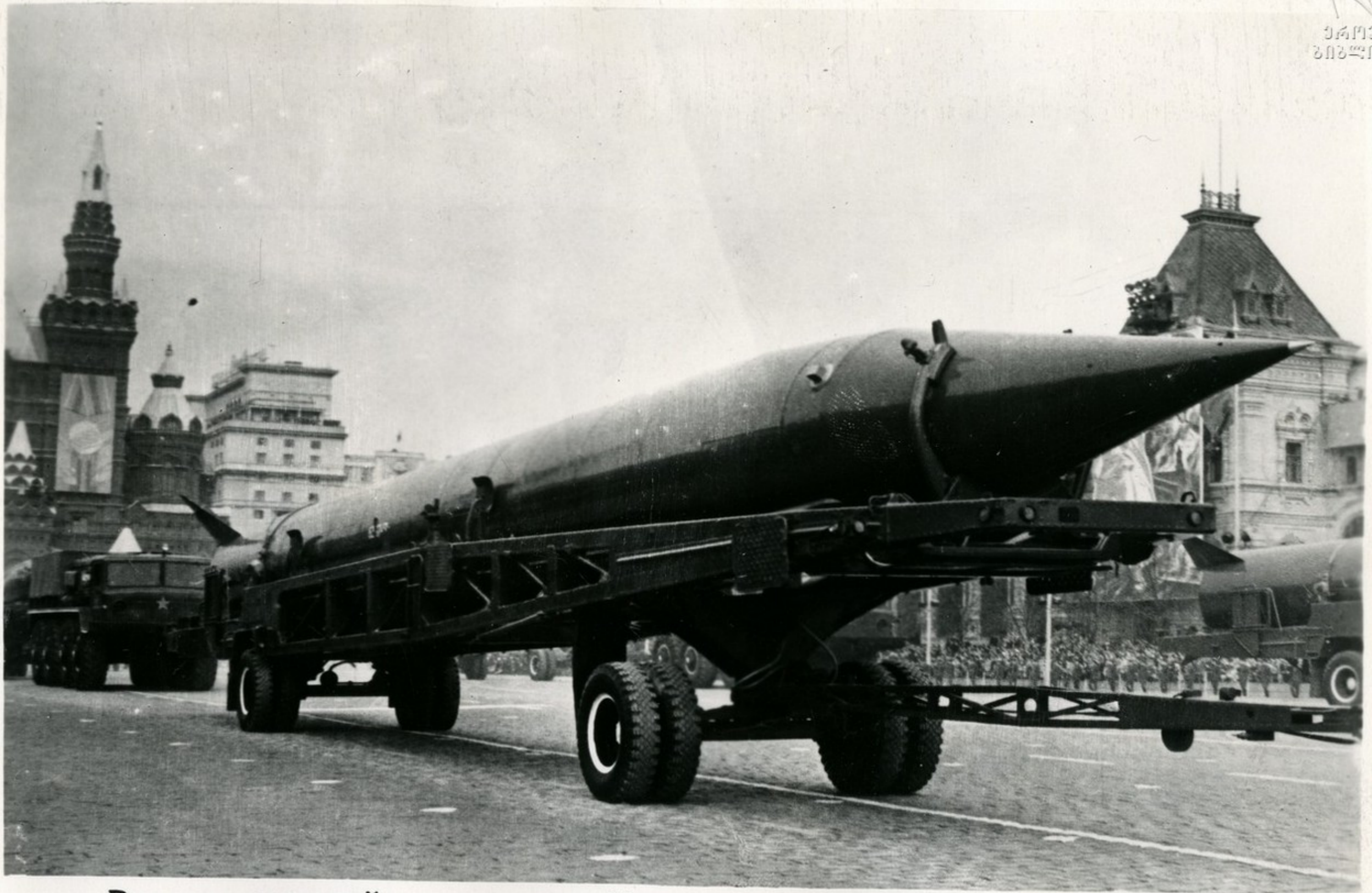
Ракеты средней дальности . Некоторые типы этих ракет способны достигать самые отдален- ные континенты .