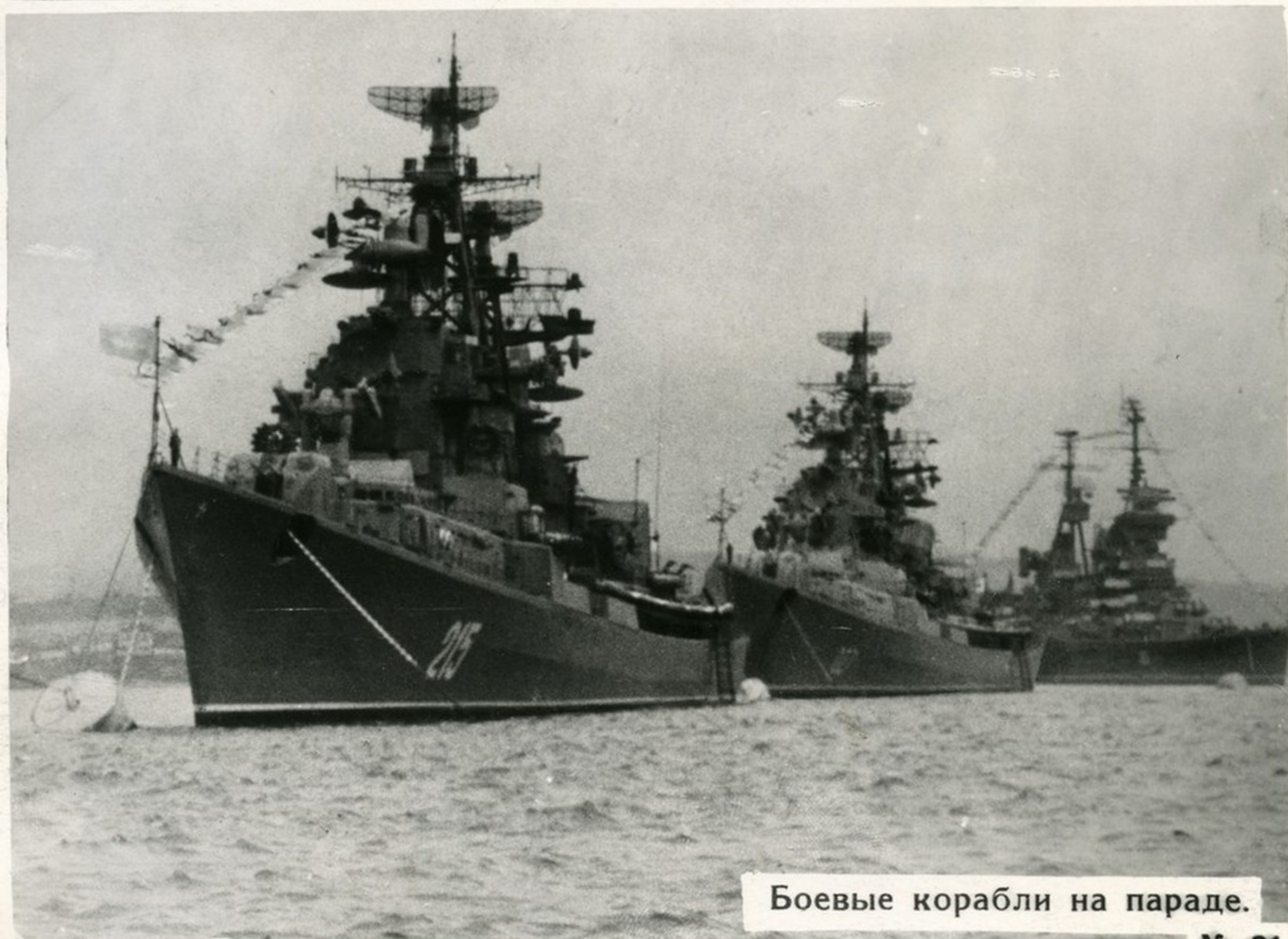
Боевые корабли на параде.