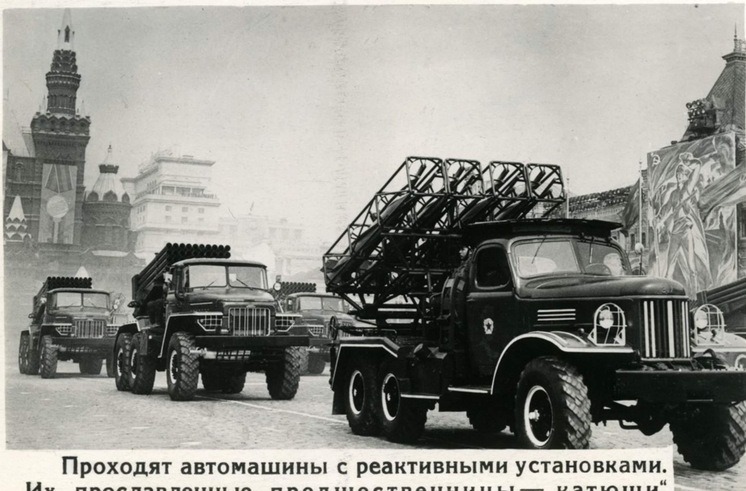
Проходят автомашины с реактивными установками. Их прославленные предшественницы — „катюши“ в годы минувшей войны сделали немало, чтобы приблизить час победы.