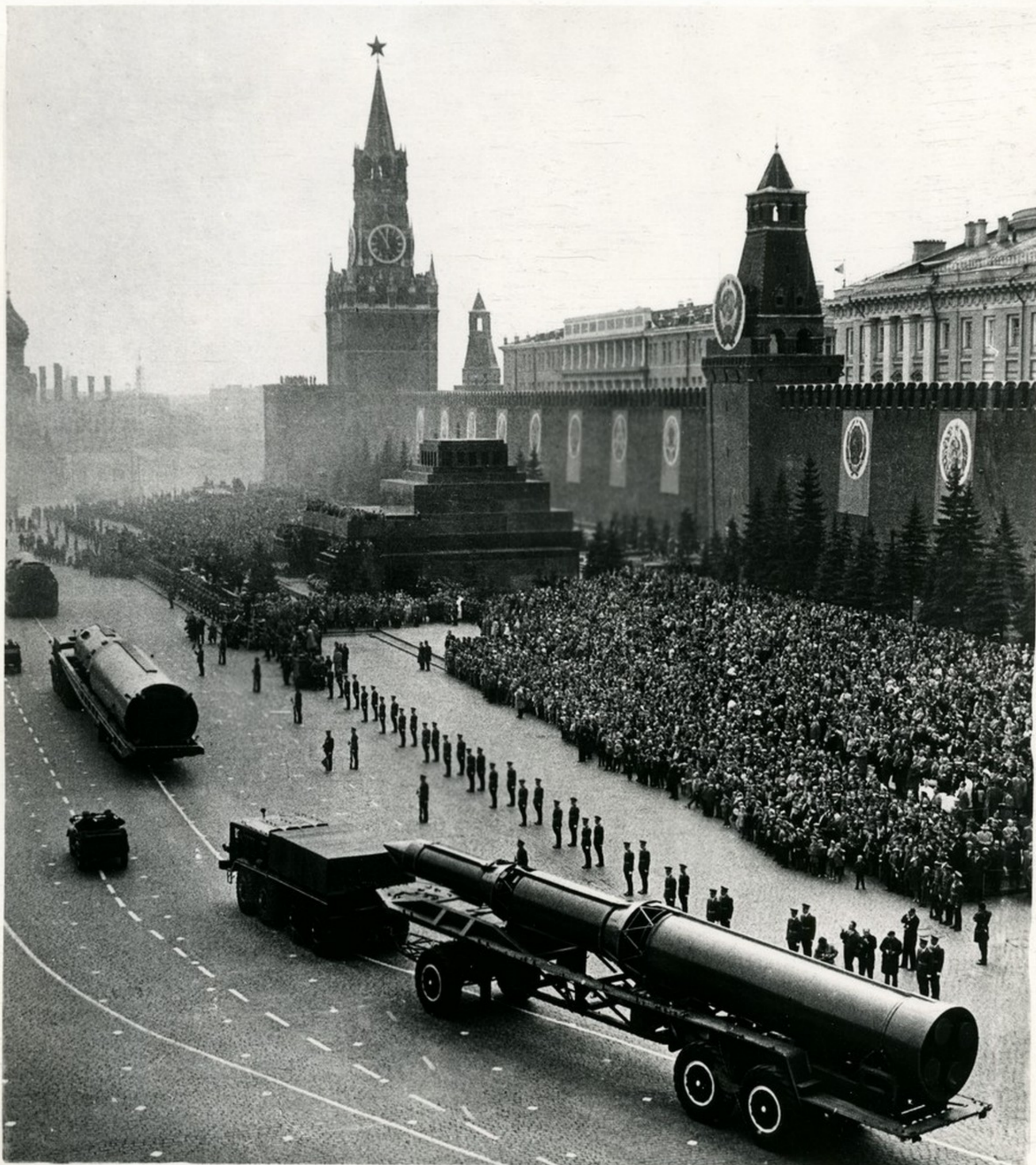
Проходят трехступенчатые межконтинентальные ракеты на твердом топливе. Их конструкция совершенна, ракеты просты и надежны, их обслуживание полностью автоматизировано.