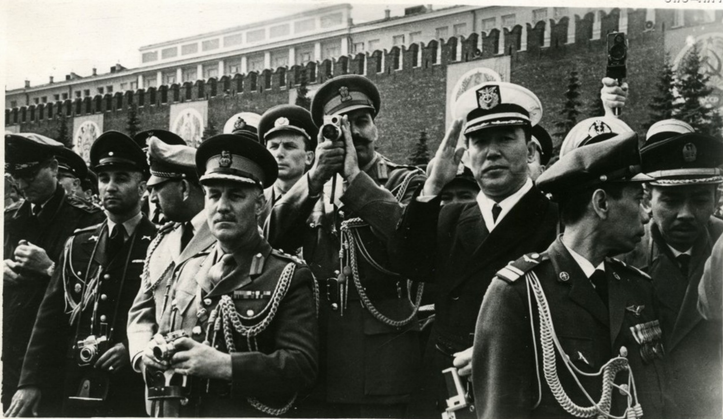
— Стратегические... Межконтинентальные... Орбитальные!!! — раздаются возгласы среди гостей. Они старательно фиксируют боевую советскую технику.