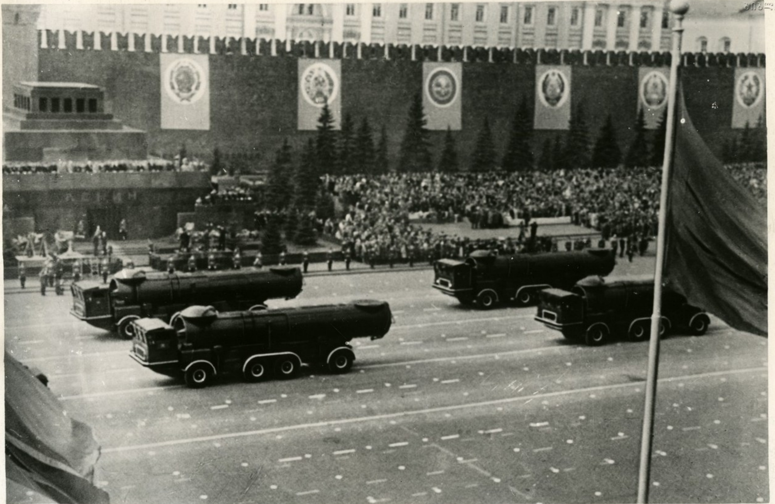
На Красную площадь вступает могучая техника Ракетных войск.