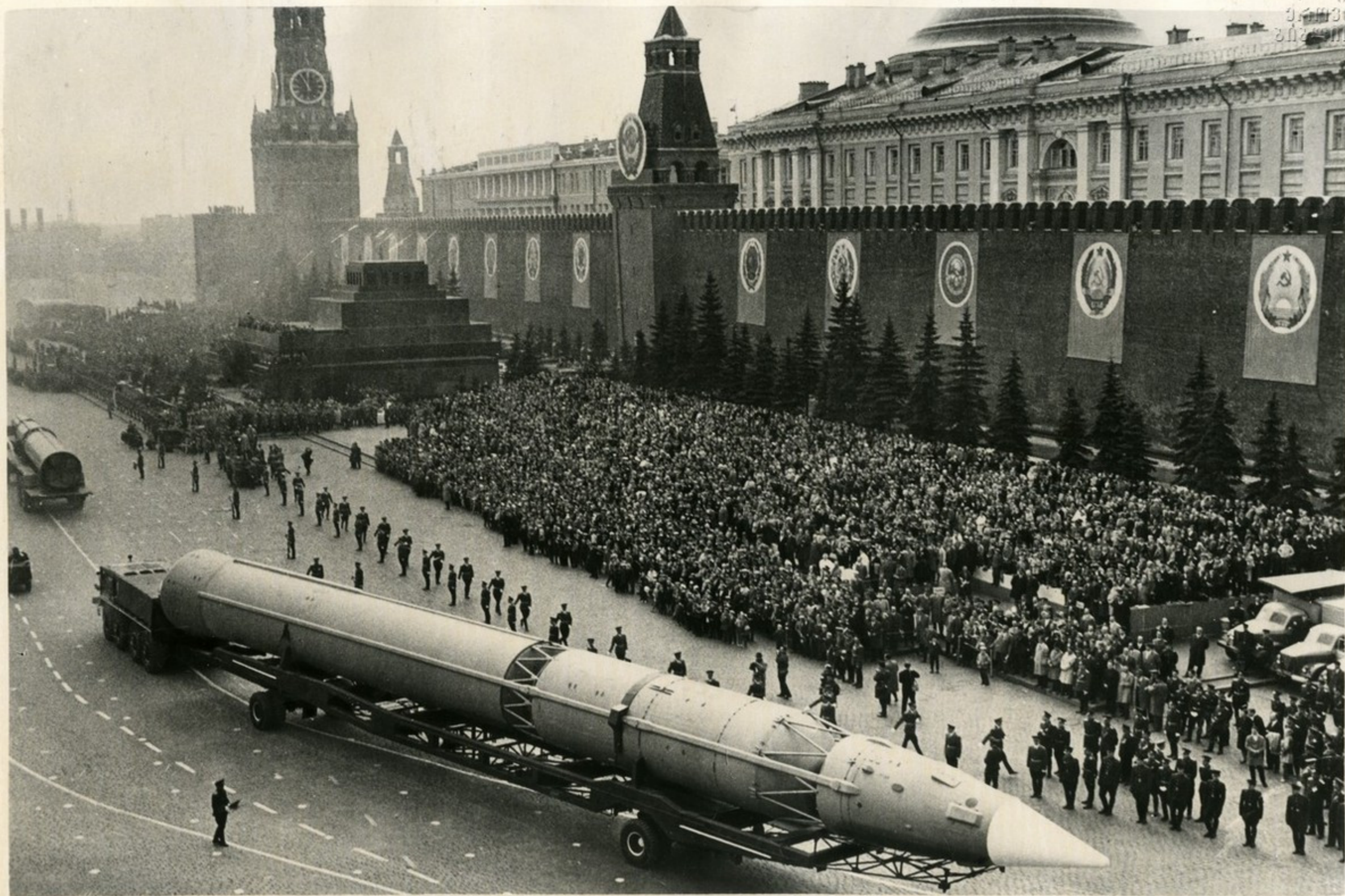
Вот она, сегодняшняя мощь Советской Армии! Гигантские орбитальные ракеты. Они сродни ракетам-носителям, выводящим в космос корабли — „Восток“ и „Восход“.