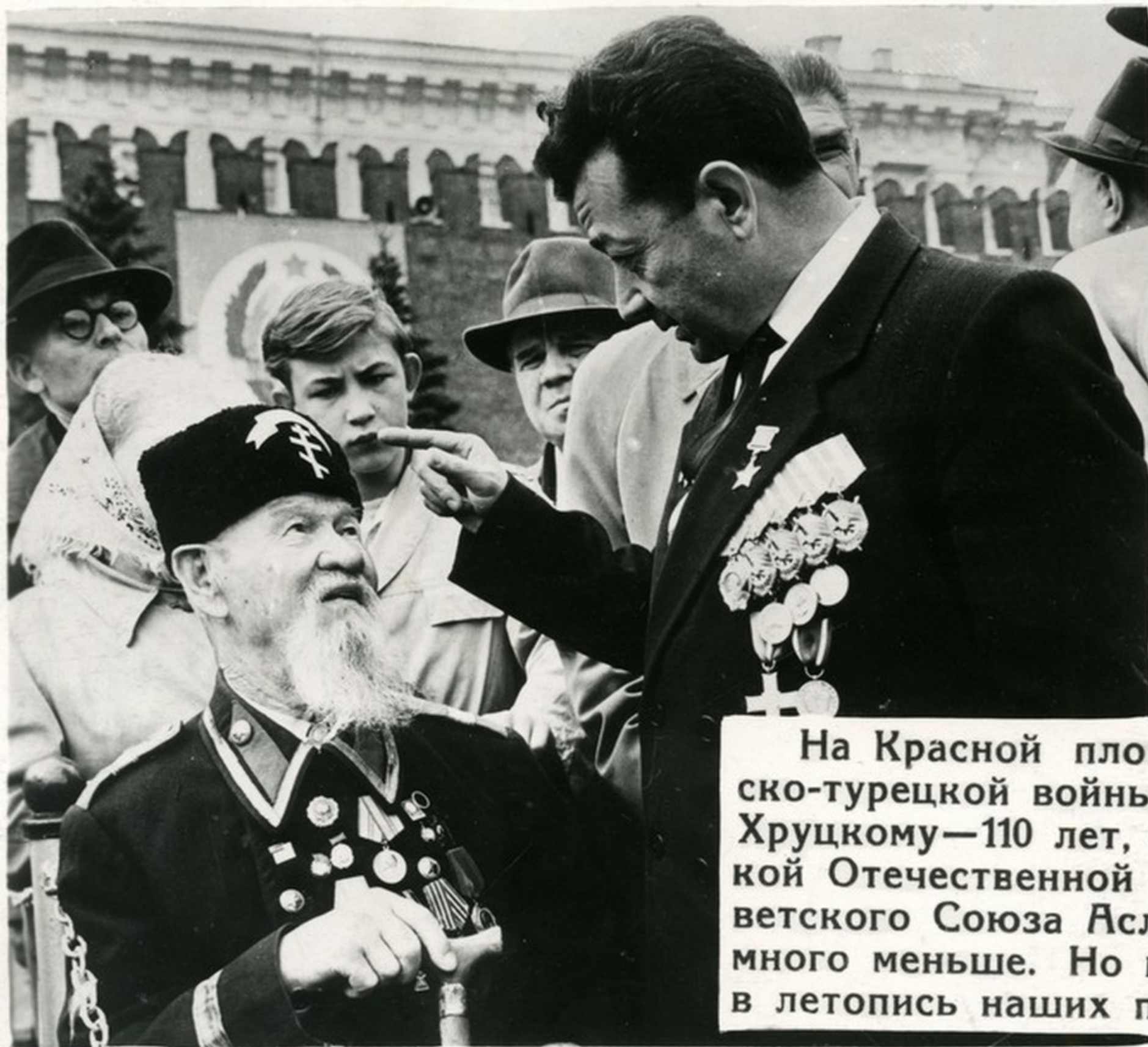
На Красной площади. Герою русско-турецкой войны (1877—78 гг.) К. В. Хруцкому—110 лет, а участнику Великой Отечественной войны Герою Советского Союза Аслану Визирову намного меньше. Но их имена вписаны в летопись наших побед.