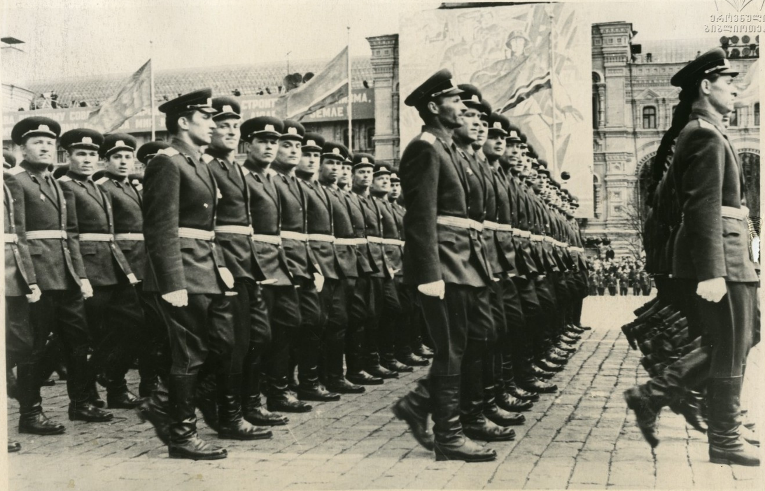
Проходят слушатели военных академий.