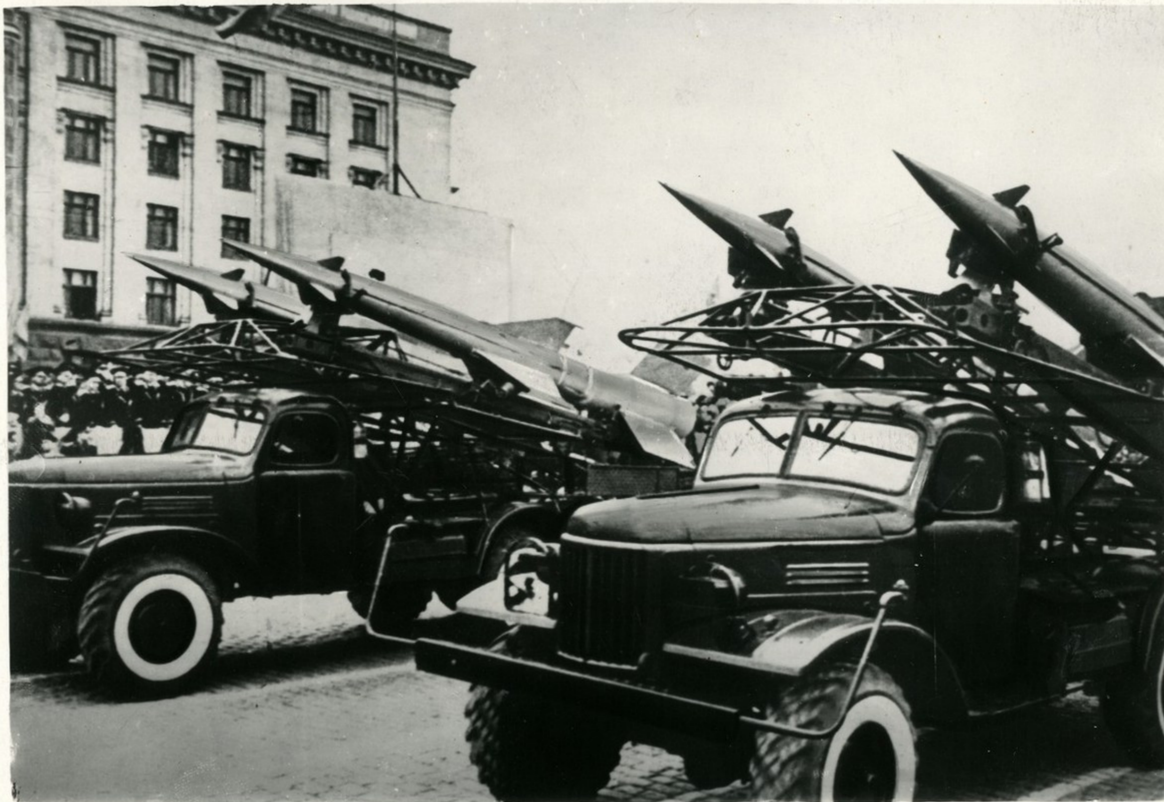
Парад частей Одесского военного округа.