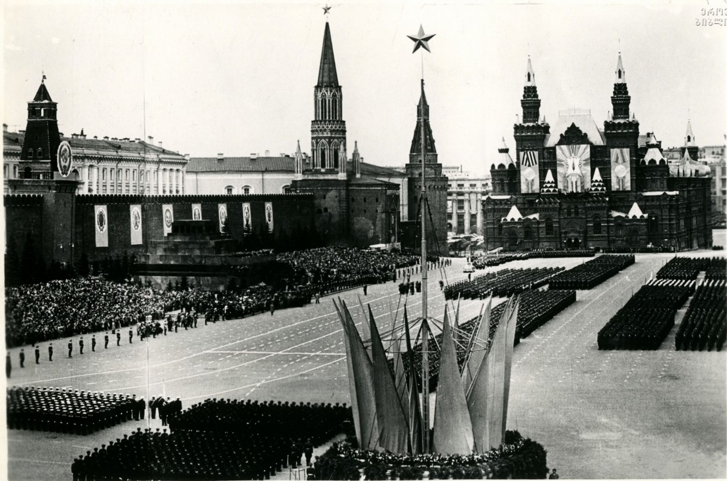
Парад войск Московского гарнизона.