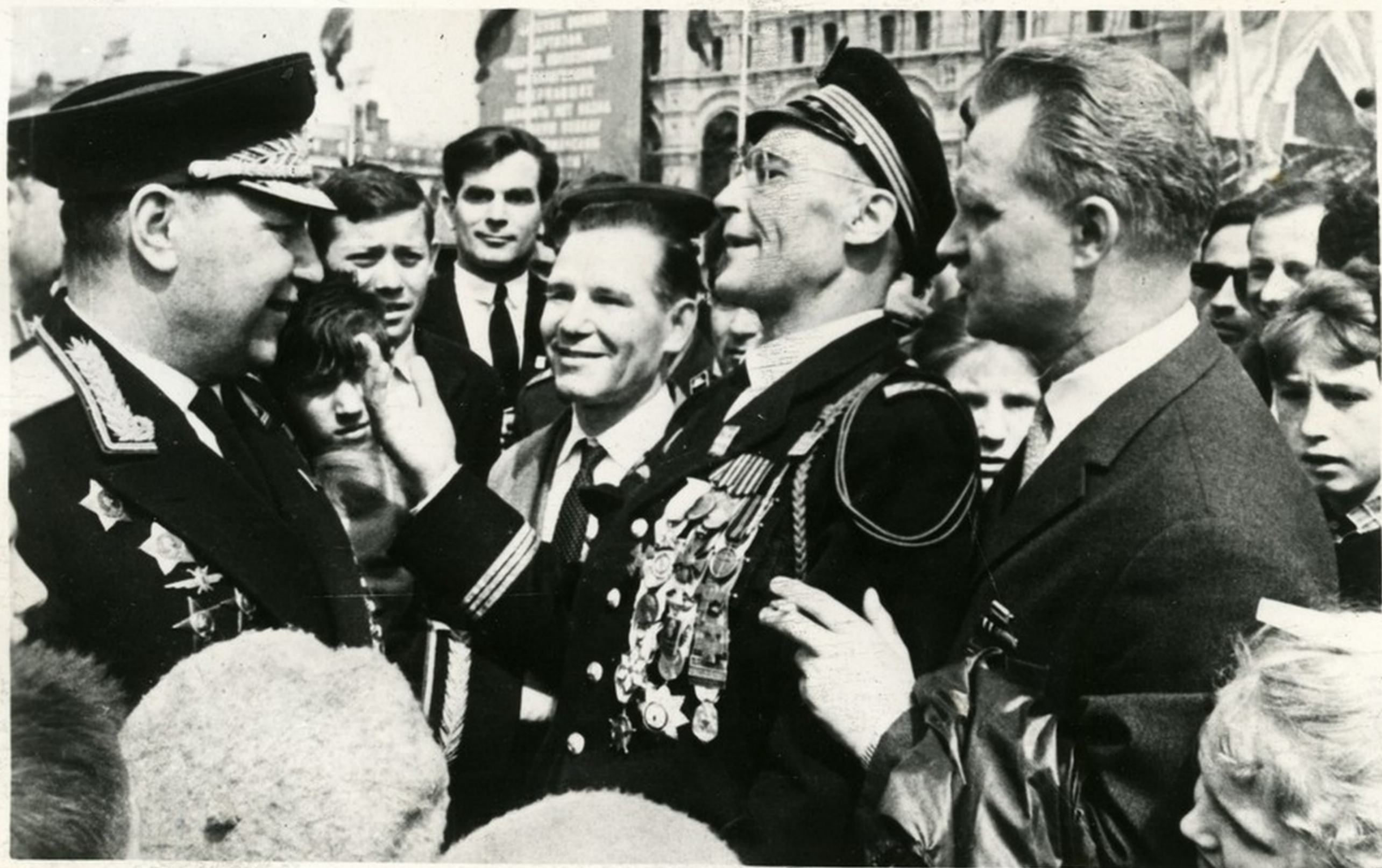
Трижды Герой Советского Союза прославленный летчик Александр Покрышкин встретился на Красной площади с Игорем Эйхенбаумом (в центре) — одним из героев-пилотов авиаполка „Нормандия-Неман“.