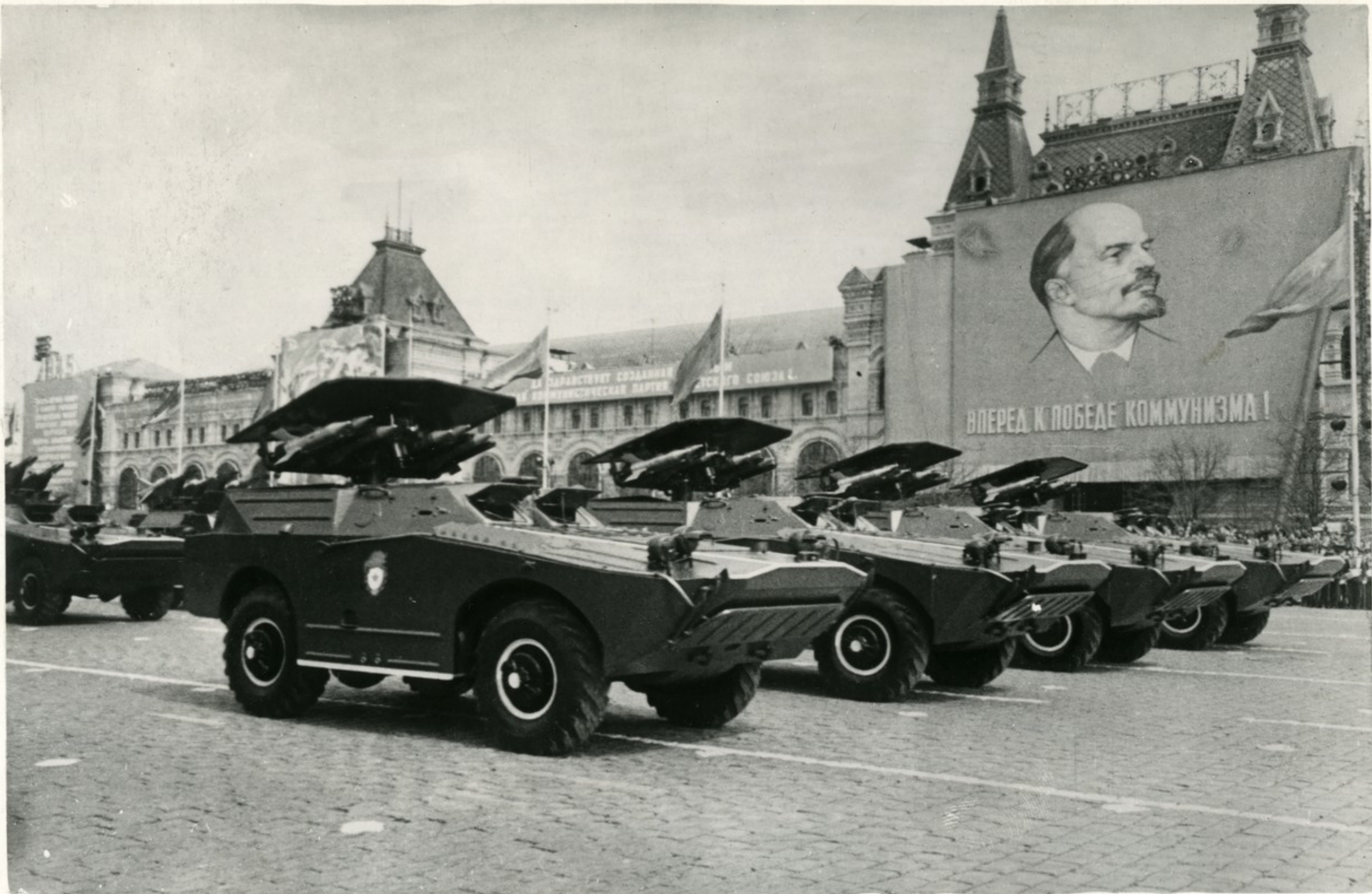
На площади появляются легкие автомашины. На них смонтированы ракетные установки с противотанковыми управляемыми реактивными снарядами.