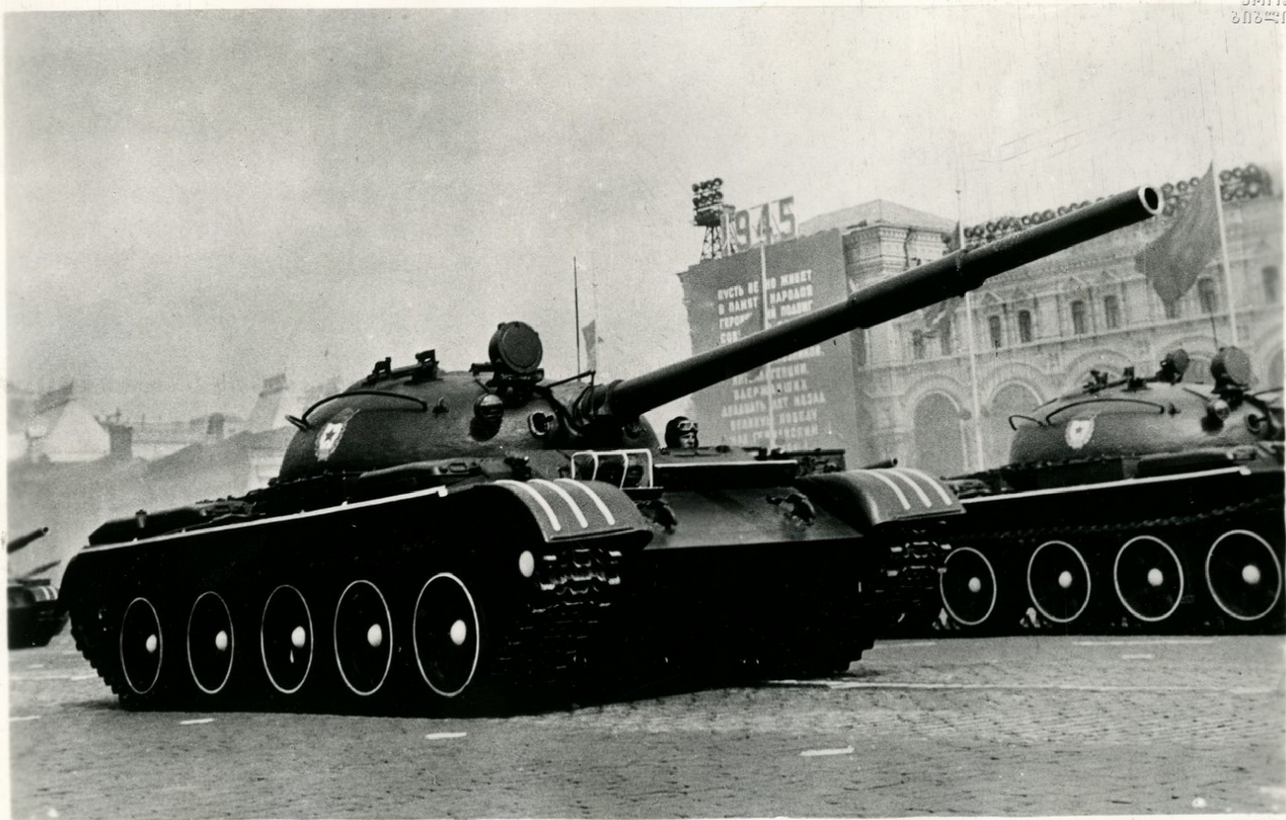
На брусчатке Красной площади — броня и скорость.