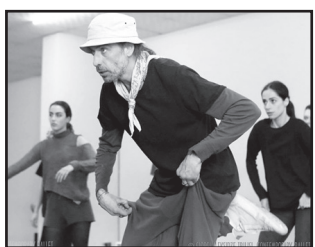
მოამზადა კეკა ირემაშვილმა

ილიკო სუხიშვილმა დასს პირველი რეპეტიცია ჩაუტარა და საინტერესო სადადგმო პროცესი დაიწყო.