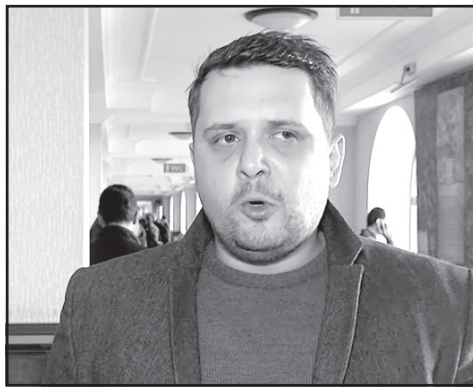
– ანუ შეცდომა იყო მიერთება?

ლადო სადღობელაშვილი: „ნულუკიანმა „ოცნების“ კადრები გაუშვა და მერაბიშვილისა და ახალაიას კადრები დატოვა“