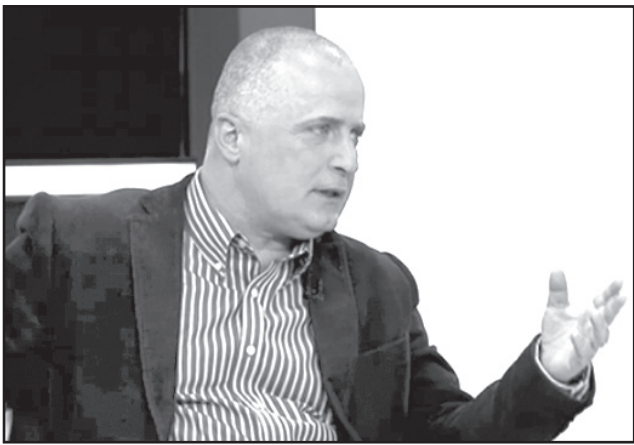
დასაწყისი მე-3 გვერდზე

— რუსეთი ყოველთვის ახალისებდა საქართველოში შიდა პოლიტიკურ დაპირისპირებებს. საქართველოს შიდა პოლიტიკური ვითარება რაც მეტად დაძაბული იქნება, მით უკეთესი მისთვის, მით უმეტეს, რაც უფრო მეტად გადავიტანთ შიდა დაპირისპირებას საერთაშორისო არენაზე — ევროსტრუქტურებში, ამერიკის სამთავრობო სტრუქტურებში, მით უკეთესი იქნება რუსეთისთვის.