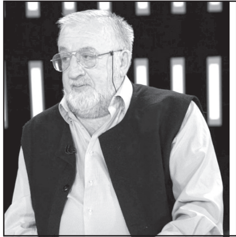
დელ არჩევნებზე ნავიდეს.

– ნების გაგრძელება იმ პროცესებზე, რომლებიც ვითარდება – იმავე უგულავას საქმეზე, საარჩევნო სისტემაზე, მოსალოდნელ რეპრეზენტებსა და ა.შ. თუ ამ მიმართულებით იქნება ზენოლა არა მხოლოდ ქვეყნის შიგნით, არამედ დასავლეთის მხრიდან და ხელისუფლება ამ ზენოლას ვერ გაუძლებს, მაშინ, შეიძლება, ვადამ-