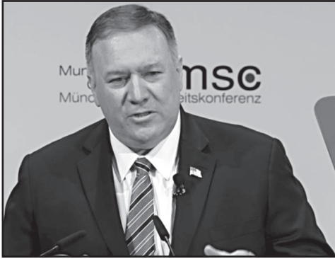
ად გადაჭარბებულია. — პრეზიდენტ ტრამპის სიტყვები, ამერიკა უწინარეს ყოვლისა, თვითიზოლაციას არ ნიშნავს!

აშშ-ის სახელმწიფო მდივანი მაიკ პომპეო მიუნხენში გამართულ ევროპის უსაფრთხოების კონფერენციაზე გამოვიდა. პომპეომ განაცხადა, რომ არც რუსეთისა და არც ჩინეთის ამბიციურ გეგმებს განხორციელება არ უნერია. დემოკრატიისა და ტოტალიტარიზმის წიდილიშვილ სასწორი დასავლეთის, ანუ დემოკრატიის მხარეს გადაიხრება.