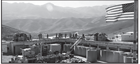
ბაზა, რომელზეც თავდასხმა განხორციელდა, აშშ-ის საელჩოსთან ახლოს მდებარეობს.

ბაღდადში, სამხედრო ბაზაზე, სადაც აშშ-ისა და კოალიციის ძალები არიან განლაგებული, სარაკეტო თავდასხმის შედეგად რამდენიმე აფეთქება მოხდა.