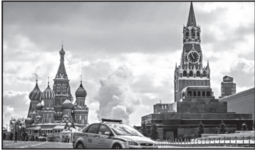
მიამზადა ნიკა თევაძემ

პოლიციის ინფორმაციით, მომხდარს ამ ეტაპზე ტერორიზმის კვალივცავდა არ აქვს. დაშავებულები საავადმყოფოში არიან გადაყვანილი. თავდასხმის მოტივი უცნობია. შემთხვევა ბასმანის რაიონში, ნიკოლოზ სასნაულმოქმედის სახელობის ტაძარში მოხდა.