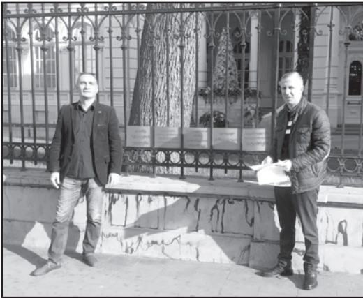
სელმწიფო არ არის.

ყოველგვარი საშობაო მილოცვებისა და დიტირამების გარეშე გვინდა დაგანახოთ, რომ საქართველო არ არის დანაშაულებების ქვეყანა და სახელმწიფო; საქართველოს ციხეებში მსჯავრდებულთა აბსოლუტური უმრავლესობა არ ზის მძიმე და განმეორებითი დანაშაულისთვის, ციხე საცხად შეშინებებით, გაუთვალისწინებლად ჩადენილი და ისეთი ქმედებებისთვის მსჯავრდებული ადამიანებით, რომელთა საზოგადოებაში დაბრუნება შეწყობების გზით უფრო მოგებია, ვიდრე მათი არშეწყობა.