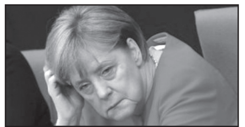
ჩასული მუშები გერმანიაში გაეცევათ.

იმის გამო, რომ გერმანიაში ხელფასები პოლონეთზე მაღალია, პოლონეთმა უცხოელ დასაქმებულებს სოციალური ბონუსები დაუწესა. პოლონელებს ეშინიათ, რომ ყოფილი საბჭოთა კავშირიდან