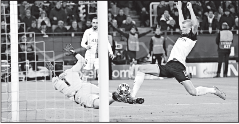
ატლეთიკო-ლივერპული 1:0 მახილი. ვანდა მუხომბორიანი

ატლეთიკო: ობლაკი, ვლასკო, სავიჩი, ფელიპე, რენან ლოდი, კოკე, საული, თომასი, ლემარი (იორუტე 46), კორეა (კოსტა 70), მორატა (ვიტოლო 70) ლივერპული: ალისონი, ალექსანდრ-არნოლდი, გომესი, ვან დიკი, რობერტსონი, ჰენდერსონი (მილნერი 80), ფაბინო, ვაინალდუმი, სალაპი (ოქსლიდე-ჩემპერლენი 76), მანე (ორიგი 46), ფირმინო ამიტომ მოგვინოს ჩემპიონთა ლიგა, რომ ყველა მატჩი არაპროგნოზირებადია. ასე მოხდა მადრიდში, სადაც დიეგო სიმეონეს განვრთნილი ატლეთიკო ტიტულის მფლობელ ლივერპულს დაუხვდა. იურგენ კლოპის ფენომენალური გუნდის შეჩერების ერთ-ერთი კანდიდატი ატლეთიკოა. და ეს ესპანელებმა საშინაო მატჩში დაამტკიცეს. სიმეონეს შევირდებმა დასაწყისშივე გაიტანეს – ფირმინოს შეცდომის შემდეგ ბურთი საულ ნიგესს მიუვიდა და