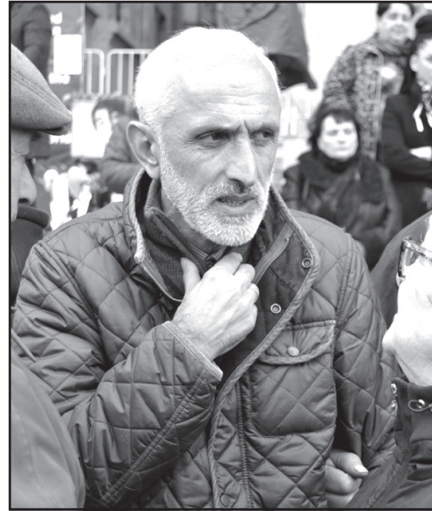
მე არ ვიტყვი ნაქვეულ კაცზე აუტს. მე უფრო მასხოს მისი წარმატებული რეფორმა, საპატრულო პოლიციის შექმნა, ვიდრე გავისვენებდი 7 ნოემბერს, 26 მაისს, რომლის მონაწილეც ვარ.

– თუმცა, ციხეში საკმაოდ ღირსეულად მოექცა, დიდი წარმატების დადამატებით ციხეში და როგორ მოიყოლებენ ხოლმე თანამებრძოლებს, მეგობრებს.