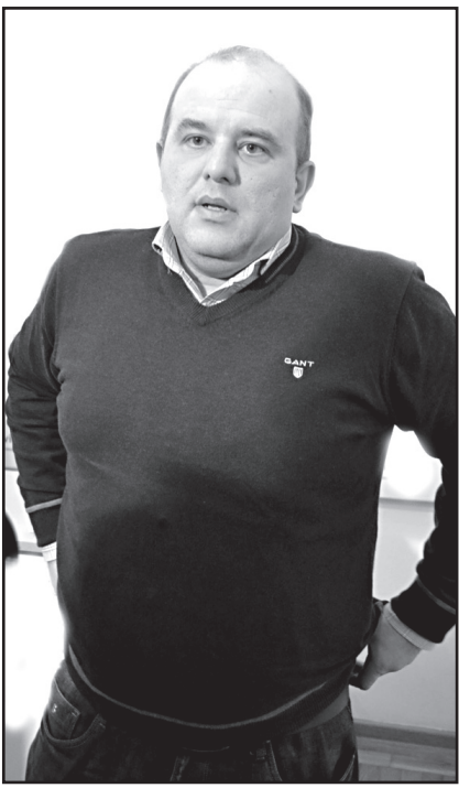
ვარ საფრთხის შემცველზე.

– აქტიური საინტერესო და მნიშვნელოვანი მომენტი – გამოიკვეთა თურქეთის მისწრაფება. თურქეთსა და რუსეთს შორის სიტუაცია დაიძაბა სირიასა და ლიბიასთან დაკავშირებით.