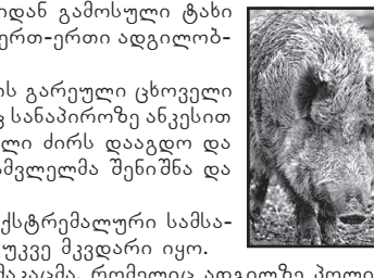
ზღვიდან ამოვარდნილი ტახი მეთევზეს თავს დაესხა

– მე მას ვაჯვო, – განაცხადა მამაკაცმა, რომელიც ადგილზე პოლიციელების მისვლას ელოდებოდა. როგორც გაირკვა, მეთევზე ტახის დახრჩობა მოახერხა, თუმცა ცხოველმა მისთვის ფეხებზე კენა მოასწრო. მიყენებული დაზიანებები მამაკაცის სიცოცხლისთვის საფრთხეს არ წარმოადგენს.