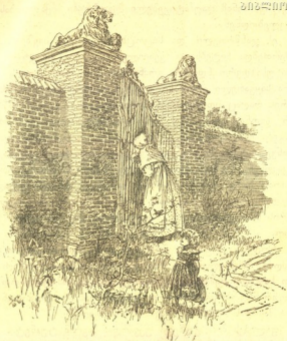
ქალი დიდხანს იტყირებოდა ჰიშკრის მესრებში.

იშვიათად შეეძლოთ ეზოს კარებში შესვლა-გამოსვლის დროს. ბავშვის ნახვა მხოლოდ შემთხვევით შეიძლებოდა, როდესაც ის მუხებისა და მაგნოლიებისაგან დაჩრდილულ გზებით დარბოდა და ან როცა რგვალი, ვარდივით წითელი სახით კარებს მოადგებოდა და დიდრონი, გაკვირვებული თვალებით ფართო, მტვერიან გზას გაჰყურებდა.