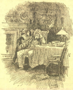
ოჰ, მამა, ნუ იფიქრებ წაგაზე.

ლუკმებად სტეხდა და, როგორც ავადმყოფ ბავშვს ალერსით პირში უდებდა.