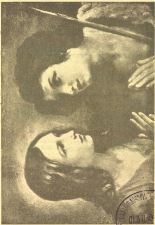
უჩინებელი იესო და იოანე.