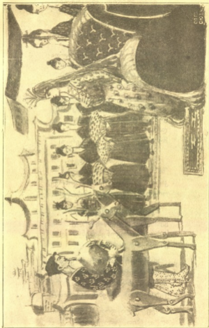
მოახსენა: ანკლოზოს ჩაგრული ვარ ბედისგანა.