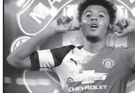
მაც ბუნდესლიგაში 25 გოლი გაიტანა და გააუმჯობესა პირსტ კუპელის რეკორდი, რომელმაც 1972 წელს 24 გოლი შეაგრო. ასევე გახდა პირველი მოთამაშე, რომელიც ამ საუკუნეში დაინახა და ინგლისის ნაკრების სასტარტო შემადგენლობაში მოხვდა.

სანრო ასევე გახდა პირველი ახალგაზრდა ფეხბურთელი, რომელ-