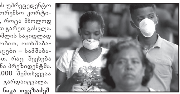
მოამზადა ნიკა თევზაძემ

პანამამ კორონავირუსთან ბრძოლის უპრეცედენტო გადწყვეტილება მიიღო. პრეზიდენტ ლორენსო კორტიზოს ინფორმაციით, გამოიყოფა დღეები, როცა მხოლოდ ქალებს ან მხოლოდ მამაკაცებს შეეძლება გარეთ გასვლა. პირველი აპრილიდან ქალები საჭმლის საყიდლად სახლიდან გასვლას შეძლებენ ორშაბათობით, ოთხშაბათობით და პარასკევობით, ხოლო მამაკაცები – სამშაბათობით, ხუთშაბათობითა და შაბათობით. რაც შეეხება კვირას, ყველა დარჩება სახლში, – აღნიშნა პრეზიდენტმა. პანამაში კორონავირუსის სულ 1.000 შემთხვევაა დაფიქსირებული. ვირუსით 27 ადამიანი გარდაიცვალა.