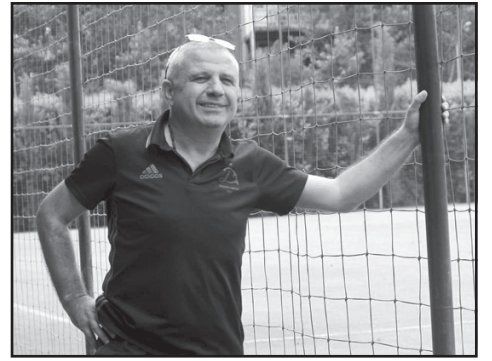
ცა, ცხადია, მომზადების ასეთი სქემა ჩვეული რეჟიმისგან შორსაა.

– სამწუხაროა, რომ საქირო გახდა სეზონის შეჩერება. ფაქტობრივად, შეკრებამ, რომელიც გუნდებმა ზამთარში გაიარეს, ყველანაირი აზრი დაკარგა. ყველაფრის მიუხედავად, მაქსიმალურად ცდილობთ ფორმის შენარჩუნებას. შევადგინეთ სპეციალური პროგრამა, რომელიც ფეხბურთელებს დაეურთებოდა და სახლში ფიზიკურად ემზადებინათ. ასევე არის კომუნიკაცია ფეხბურთელებსა და მწვრთნელებს შორის, თუმ-