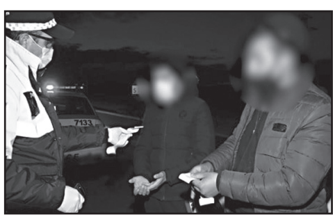
ლაციის წესების დარღვევის 12 ახალი ფაქტი გამოვლინდა.

ლებმა, 4 აპრილის 21 საათიდან 5 აპრილის დილის 6 საათამდე, ე.წ. კომენდანტის საათის დარღვევის ფაქტზე, მთელი ქვეყნის მასშტაბით, 113 მოქალაქე დააჯარიმეს. გარდა ამისა, პოლიციამ საჯარო სივრცეში 3-ზე მეტი პირის შეკრების და 2-მეტრიანი სოციალური დისტანციის დაუცველობის გამო, 21 მოქალაქე დააჯარიმა. 1 იურიდიული და 1 ფიზიკური პირი დაჯარიმდა ეკონომიკურ საქმიანობასთან დაკავშირებული შეზღუდვების დარღვევის ფაქტზე. პოლიცია, დაავადებათა კონტროლის ეროვნულ ცენტრთან ერთად, თვითიზოლაციაში მყოფი მოქალაქეების მკაცრ კონტროლს განაგრძობს. ერთობლივი მონიტორინგის შედეგად, თვითიზო-