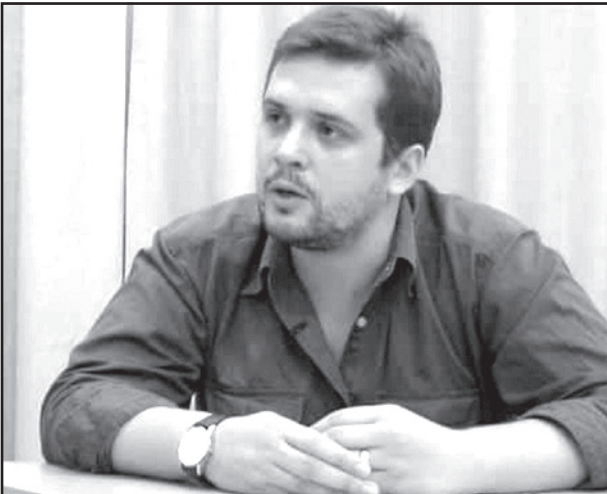
საქართველოში არ არის ეს დაშვებული. ჩვენ პრაქტიკულად პატიმრებზე უარეს დღეში ვგავდები. გამოკეტვით ვართ ჩვენს სახლებში.

გაუგებარ რაღაცებს სჩადიან. მთელ მსოფლიოში, ყველგან შეიძლება პარკებში სეირნობა,