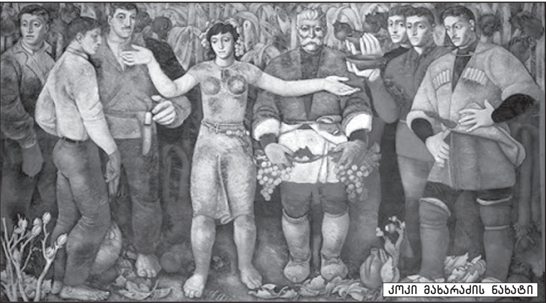
ქობი მახარაძის ნახატი