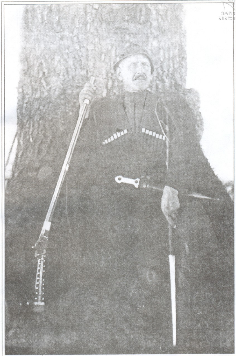
მხნათე გაბლიანი 1920