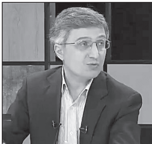
ქოში მის გამწვანებას მე უკვე რეალურად განვიხილავ.