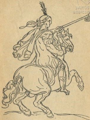
სურ. 5. (ქასტელის აღბომიდან).