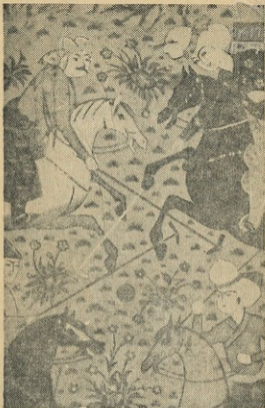
სურ. 2. (ბრიტანეთის ნუზეუმის კოლექცია).