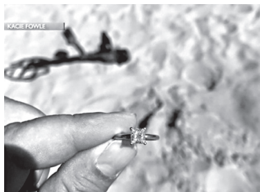
მა სწრაფად მიაგნო დაკარგულ ბეჭედს.

მამაკაცი ლითონის მარაგებით დაკარგულ ქალს ნივთების ბეჭდის პოვნაში, რომელიც მან პლაჟზე დასვენების დროს დაკარგა.