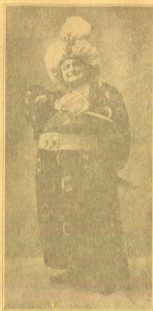
3 უ რ ი