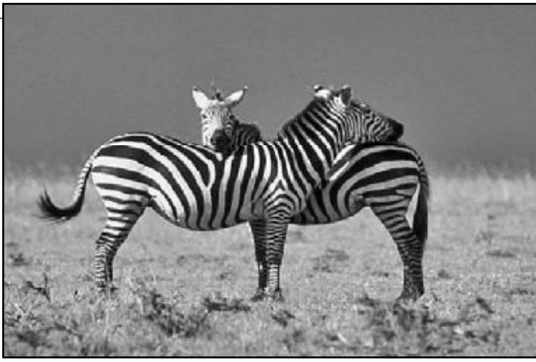
კალებს, რაც მეცნიერებმა ექსპერიმენტულად დაამტკიცეს. მათ სამი წაბლა ცხენიდან ერთი შავად, მეორე თეთრად, მესამე კი შავ-თეთრ ზოლებად შელესეს,

პარპარდის უნივერსიტეტში, მოვლელული 1991 წლიდან, იუმორისტული ჟურნალის „არაჩვეულებრივ გამოკვლევება ანალიზის“ რედაქციის თანამშრომლები ყოველწლიურად, ოსლოში ნობელის პრემიების გადაცემის ცერემონიაზე ერთი კვირით ადრე, ეგრეთ წოდებულ „შნობელის პრემიას“ გადასცემენ მეცნიერების სხვადასხვა სფეროში ყველაზე საეჭვო, ანდა, სულაც, სულელური მიღწევებისთვის. ნომინატებს ჟიურის წევრები სერიოზულ სამეცნიერო გამოცემათა საგულდაგულო, გულდასმით გაცნობის შედეგად ადგენენ. შარშან შნობელის პრემიის საგარაუდო ლარებატებს ჟიურის წევრებმა თან სოლიდურ ჟურნალში, პირველი „ჯორნელ ოფ ექსპერიმენტული ბიოლოჯიში“, მეორე კი „ქარენტ ბიოლოჯიში“ „მიანგნეს“.