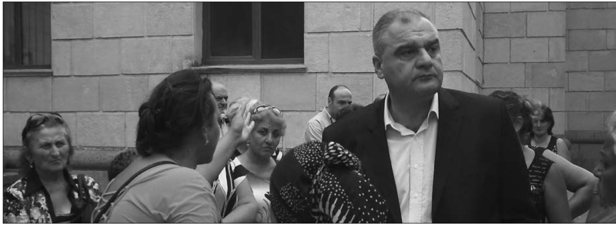
მერი მოვალეობის შესრულებაში მოსახლეობასთან შეხვედრის დროს

— იმ დროის განმავლობაში, რაც მერის მოვალეობის შემსრულებლის თანამდებობა გვიტარებთ, არაერთი პრობლემის წინაშე დადგით, როგორ ფიქრობთ, რამდენად გაართვით თავი ამ გამოწვევებს?