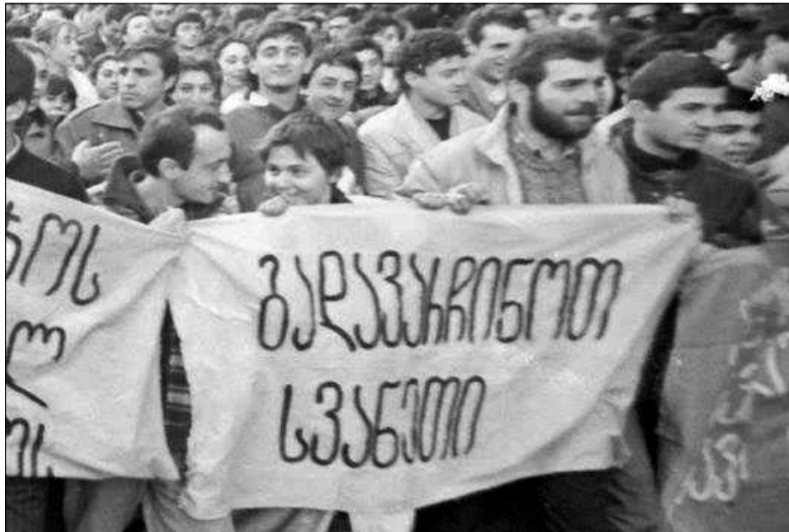
90-იან წლებში აპროტესტანტები ხუმრობის აშენებას...

რა ნაწილმა ჩვენი ინიციატივით მივანიჭეთ ამ სოფელს გმირი სოფლის წოდება, იმიტომ რომ 20 წელზე მეტია ეს სოფელი კლდესავით დგას და როცა ირგვლივ ამდენმა გაყიდა ყველანაირი სულიერი ღირებულება, როცა არავის უნდა ეს საქართველო, როცა აქედან გარბიან, ამ სოფელს და მის მაცხოვრებლებს სთავაზობენ ყველაფერს, ოღონდ გაყიდონ ადამიანური ღირებულებები, თავიანთი საფლავები, ეკლესიები, სავარგულები, სიწმინდეები. და ეს ღარიბი სოფელი, რომელიც განიცდის ყველანაირ დაწოლას, გადაბირებას, მოსყიდვას, დაშინებას, როგორც ეს იყო საბჭოთა კავშირიდან მოყოლებული დღემდე, ეს ხალხი დგას მტკიცედ და მიტოვებულია მთელი საქართველოსგან, ფაქტობრივად, დამწერლობისგანაც და დედაქალაქისგანაც. ეს იქნება ჩემი მოწოდება მწერლებისადმი. მე მოვუწოდებ მათ რამდენიმე დღის წინ: 2012 წელს პენ-ცენტრმა და მისმა გამგეობამ გა-