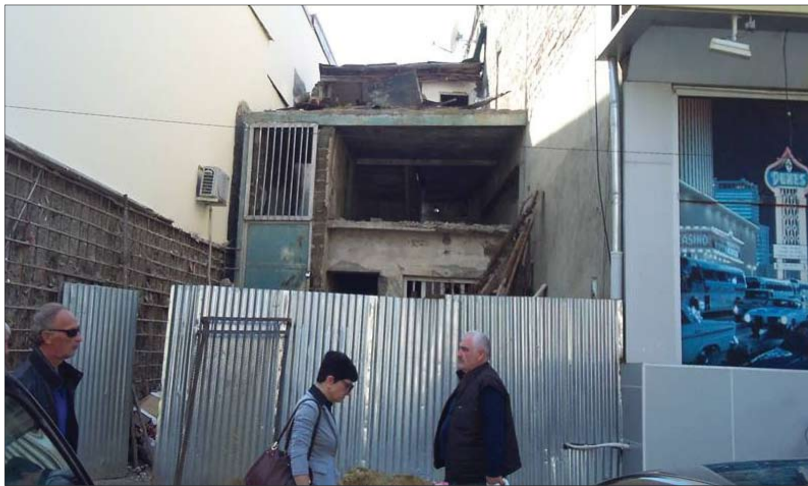
„პ.ს.“-ის ფოტო (მარია კახარია) ©