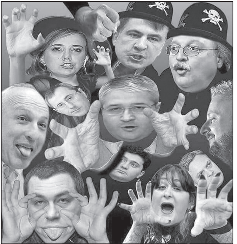
სისტემის იურისდიქციას, ე.ი. ეროვნული სუვერენიტეტის ერთ-ერთ მთავარ ბურჯს, არც ცნობენ!

კი ვხუმრობ, მაგრამ მათი „ანგლობა“ სულაც არ არის ისეთი უწყინარი, როგორც ერთი შეხედვით შეიძლება ვინმეს მოეჩვენოს. მართლაც, აბა დავეფიქრებთ, რა შეიძლება ენოლოდოს მათ ე.წ. იდეას, რომ უზუნაესი სასამართლოს (რომელიც, თურმე იმავდროულად საკონსტიტუციო სასამართლოც იქნება), ასევე სააპელაციო სასამართლოების „ყველა კოლეგიის უმრავლესობა აშუდან და დიდი ბრიტანეთიდან“ მოწვეულმა და ხანგრძლივი ვადით დანიშნულმა მოსამართლეებმა“ (სიტყვასიტყვით ასე უნერიათ!) უნდა დააკომპლექტონ? ეს „ანგლობა“ ე.ი. — სასამართლოს ანგლო-ამერიკაზიზაცია, სინამდვილეში ხომ ეროვნული სასამართლოს დესუვერენიზაციას ნიშნავს!