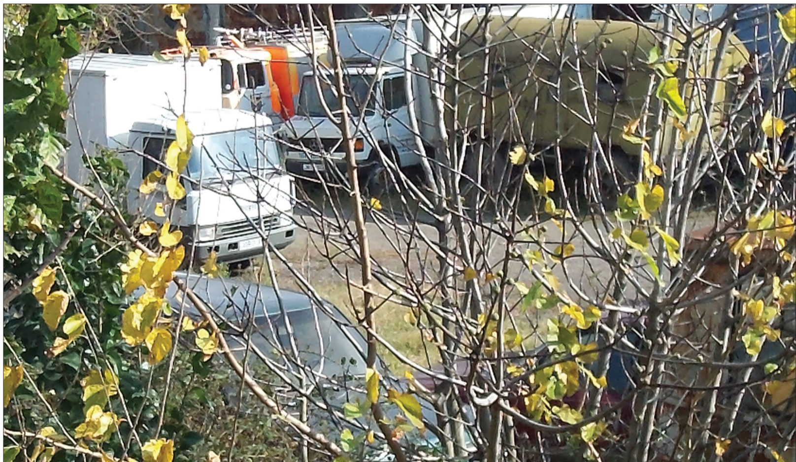
„ავტოსასაფლაო“ მხსვლა საპიტილო ნაგებობის გარშემო გამორჩეულია