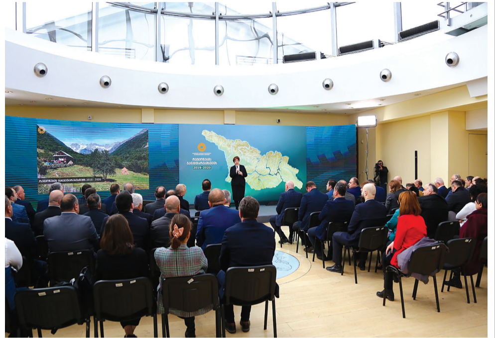
წყალგაყვანილობის ქსელების მოწყობა, გარე განათება, პარკები, სკვერები, მცირე სპორტული ნაგებობი და ა.შ.“ - აღნიშნა ვიცე-პრემიერმა მაია ცქიტიშვილმა რეგიონების განვითარების მიზნით არსებული ფონდებითა და პროგრამებით დაფინანსებული პროექტების 2019 წლის ანგარიშის წარადგენის დროს

„ესაა პროექტები, რომელსაც უშუალოდ ადგილობრივი მუნიციპალიტეტები ახორციელებენ ცენტრალური ბიუჯეტის დაფინანსებით. მხოლოდ სოფლის მხარდაჭერის პროგრამის ფარგლებში, რომელიც გასულ წელს განახლდა, 4000-ზე მეტი პროექტი შესრულდა, ანუ თითოეულ დასახლებაში სულ მცირე 1 პროექტი მაინც გაკეთდა. გარდა ამისა, 2019 წელს, ჩვენ დაეწყო სკოლების ინფრასტრუქტურული განახლება და რეგიონებს პირველად ჰქონდათ შესაძლებლობა, რომ 600-ზე მეტი სკოლის მცირე რეაბილიტაცია თავად განეხორციელებინათ, რისთვისაც 40 მლნ ლარის დაფინანსება გამოიყო. ამის გარდა, ჩვენ გქვონდა ძალიან მნიშვნელოვანი პროგრამა, რომელიც ასევე სიახლე იყო მუნიციპალიტეტებისთვის, ესაა ამბულატორიების და სასწრაფო დახმარების ცენტრების მშენებლობა და ამ პროგრამის ფარგლებშიც 300-ზე მეტი ამბულატორიის მშენებლობა-რეაბილიტაციის პროცესი დაიწყო. მათი უმეტესი ნაწილი უკვე დასრულდა. ასევე, 41 სასწრაფო დახმარების შენობის მშენებლობა დაიწყო რეგიონებში და 2020 წლის განმავლობაში ჯანდაცვის სამინისტრო მოახდენს ამ ობიექტების აღჭურვას. ყველა ეს პროექტი ემსახურება ჩვენს რეგიონებში იმ საბაზისო ინფრასტრუქტურის განახლებას, რომელიც ჯერ კიდევ საჭიროებს ბევრ ინვესტიციას. ესაა გზები, ლოკალური