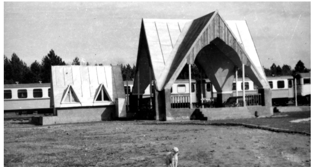
ეს ფოტოსურათი კი აშკარად ნოსტალგიას გამოიწვევს ჩვენს მკითხველში, მასზე ზემო სერის კულტურისა და დასვენების პარკის ერთი მონაკვეთი ჩანს. სამწუხაროა, რომ უნიკალური პარკიდან დღეს, ფაქტობრივად, არაფერი დარჩა. არადა, 80-იან წლებში იგი თავისი არსით მართლაც უნიკალური იყო. თუნდაც იმით რომ საბავშვო რკინიგზა, მხოლოდ სამი იყო მთელი კავშირის მასშტაბით (ერთი-თბილისში) და მათ შორის ხაშურში.