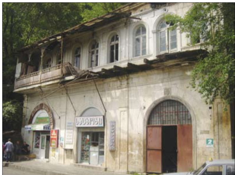
სახლი ნითელ ხილთან (ბალაქატიონ ტაბიძის N2)