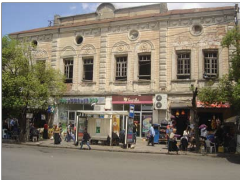
ყოფილი N2 კულტურის სახლის შენობა (ფალიაშვილის ქუჩა)