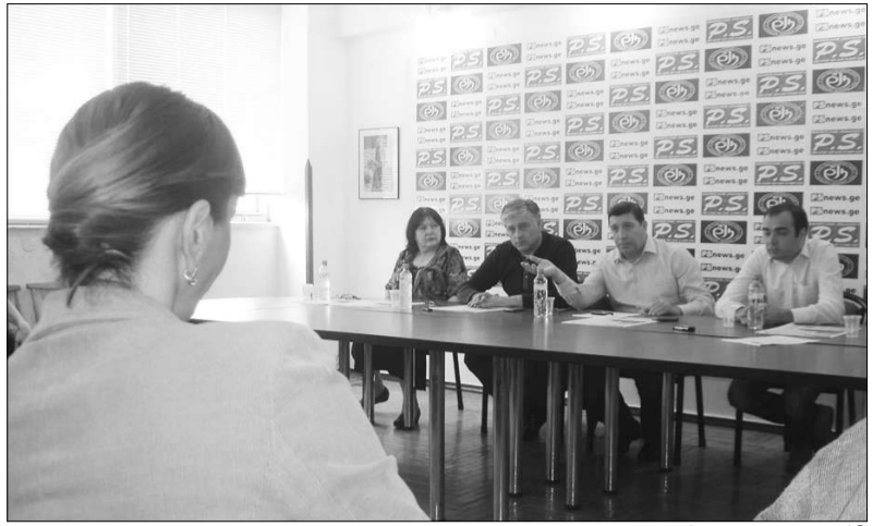
„P.S.“-ის რედაქციაში (ორთა ხანაშავილი) ©

— ეს იყო პოლიტიკური ნიშნით გაკეთებული განცხადება. ამაში უჩვეულო არაფერია. ფრაქციას აქვს უფლება, გამოხატოს საკუთარი პოლიტიკური პოზიცია. ჩვენ ვთქვით, რომ ქალაქის მერის პოსტზე პრემიერის კანდიდატურას დავუჭერთ მხარს. ამან ზეგავლენა არ უნდა მოახდინოს კომისიის მუშაობაზე. ფრაქციას აქვს გადაწყვეტილი როლი ქალაქის მერის დამტკიცების საკითხში, რადგან ჩვენ წარმოვადგენთ უმრავლესობას საკრებულოში, მაგრამ ვაგვლენას