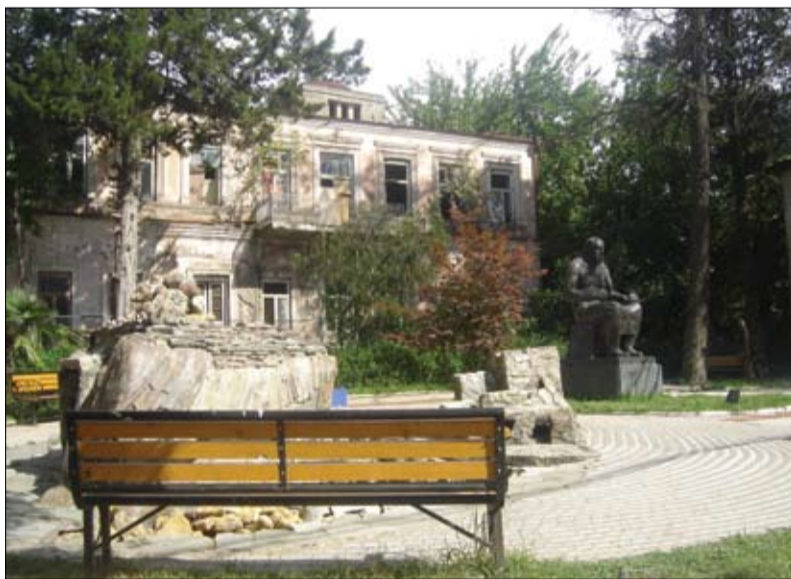
საბრუნაშოს ქარხანა (თამარ მეთუნის N9)

დეფლაციიდან გამოსავალი: მთავრობამ უნდა დახარჯოს ბევრი ფული