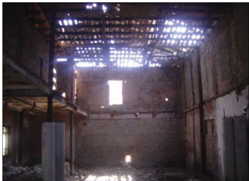
ახალგაზრდული თეატრის შენობა (ბრიგადაშვილის ქუჩა)