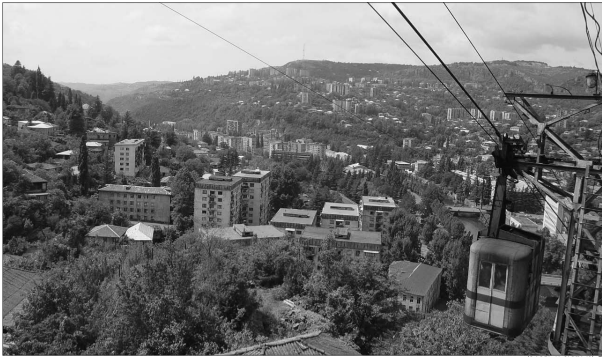
„აფიშო“ (ორიან პანდრაძე) ©

მიუხედავად რესურსებით სიმდიდრისა, ქიათურა პრობლემებით დახუნძლული რეგიონია. როდის მოხდება მნიშვნელოვანი საკითხების მოგვარება, ჯერ კიდევ გაურკვეველია. მართალია, ქიათურას ახალი ხელისუფლება ჰყავს, მაგრამ ადგილობრივი თვითმმართველობა თითქმის უფუნქციოა იმ საკითხების მოგვარების საკითხში, რომლებიც ყველა ქიათურელს აწუხებს. ქიათურის მანგანუმის საბადოები, მანგანუმის წარმოება, ეკოლოგია, ინფრასტრუქტურული მეურნეობა, — ყველაფერი მისახედა, მაგრამ ამის შესაძლებლობა ქიათურის მუნიციპალიტეტის ადმინისტრაციას ნამდვილად არ აქვს. ქიათურის გამგეობა და მაჟორიტარი დეპუტატი ამ დრომდე ინარჩუნებენ საიმედო ხელისუფალთა იმიჯს, რადგან ადგილობრივ მოსახლეობას კარგად ესმის, ახალი ხელისუფლება ბრალში არ არის იმის გამო, რომ გასული ცხრა წელი მათთვის ამქვეყნიური ჯოჯოხეთის ტოლფასი იყო.