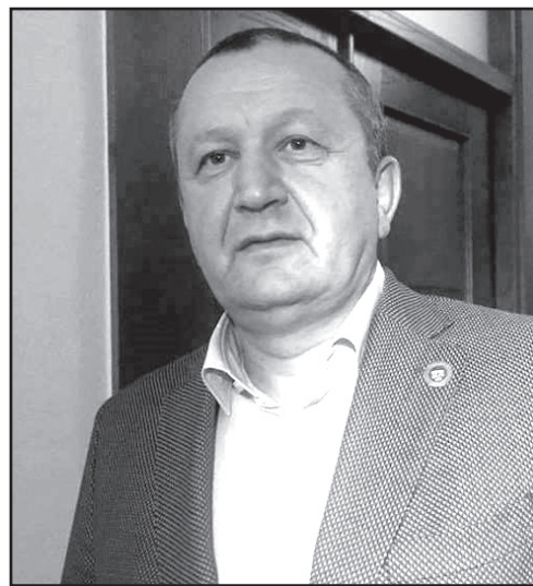
„ქართულმა ოცნებამ“ თუ მონიდომმა არჩევნებზე არარსებული რიცხვები დაწერა, ეს პოლიტიკური ავანსცენიდან მისი გაქრობა იქნება“

დავით ჭიჭინაძე: „ვაშაძე არ არის „ქართული ოცნების“ პროექტი? „ევროპული საქართველო“ გახარიას პარლამენტში ფიანდაზებს რომ უგებდა და მის მითიურ სიძლიერეს ამტკიცებდა, არ ინვესტ კითხვებს?“