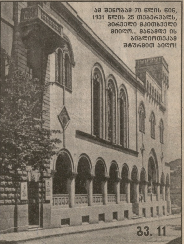
33. 11 აქ შენაბა 70 დღის წინ, 1931 წლის 25 თებერვალს, პირველი საქართველოს პარლამენტი შეიკრიბა