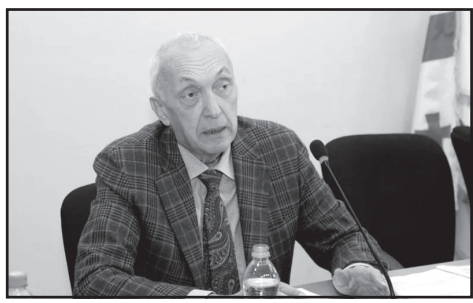
იმის გამო, რომ დონორები არ გვყავს. მინდა მივმართო ყველა იმ მოქალაქეს, ვინც კოვიდ ინფექცია გადაიტანა, მოგემართონ და ჩააბარონ პლანზე, – განაცხადა თენგიზ ცერცვაძემ.

ინფექციური პათოლოგიისა და შიდსის ცენტრის გენერალურმა დირექტორმა თენგიზ ცერცვაძემ „დღის კურიერის“ ეთერში იმ ადამიანებს მიმართა, ვინც კოვიდ ინფექცია უკვე გადაიტანა და სლობა, რომ მივიდნენ და ჩააბარონ პლანზე, რომელსაც შემდეგ ინფიცირებულებს გადაუსხამენ.