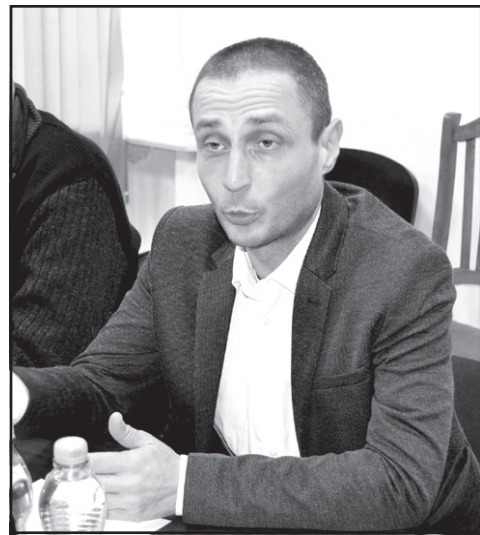
მიკურ გეგმაზე საუბრობენ.

– თუმცა, „ქართული ოცნება“ არჩევნების მოგებას აპირებს. ისინი ქვეყნის მომავალ ეკონომიკურ გეგმაზე საუბრობენ.