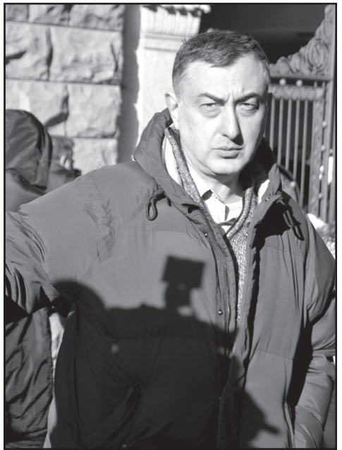
ბია, მაგრამ გქონიათ ბოლო პერიოდში დასავლელ პოლიტიკოსებთან ან საერთაშორისო ორგანიზაციებთან კომუნიკაცია?

– არა. ჩვენ მხოლოდ დასავლეთის იმედად არ ვართ. საზოგადოება ამას არ მოითმენს და ეს არის მნიშვნელოვანი ფაქტორი.