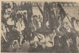
პიონერები ოქტომბრის რევოლუციის დღეს. დემონსტრაციის დაწყება. უფლაზე წინ მოდიან პიონერები.