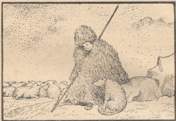
გორგა ნახევია ნაბადში და უღარაჯებდა ცხვარს.

ჩამობნელებული ცა განუწყვეტილვ ჰგზავნიდა დედამიწის- კენ თეთრ პებელებს, გორგა კი ნაბადწამოსხმული გაიყურე- ბოდა სიბნელეში.