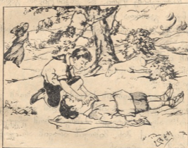
ავია მგლო მიწაზე გულწასული.

კოკის ცრუბლები წასკდა, სიტყვები ეელში გაეჩინონ და ენა ვერ ამოიღო.