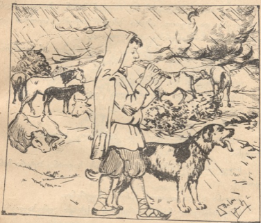
გოია ავენსებს საღამურს.