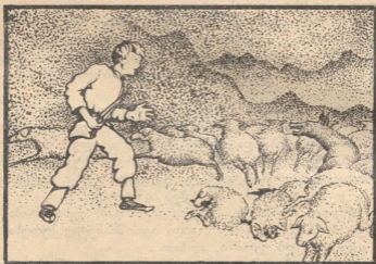
გორგამ დაინახა ცხვრებში მგელი.

დაუბერა, დაჰკვნესა ქარმა და თვალეში მიაყარა თოვლნარევი ხოშკაკალა.