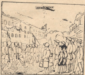
გზია და კოკი უცქერიან ტიპოგრაფიის ოფის დემონსტრაციას.