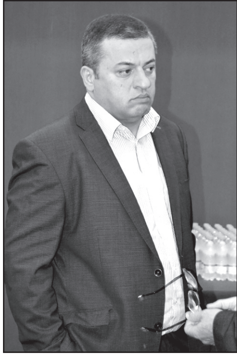
უნდა გაცდენოდა და იმის მიხედვით დადეს შედეგები. ხოლო ახლა, როდესაც მათ მეტი არა-ვინ ყოფილა არჩევნებზე და არც კომისიებში, ხომ წარმოგიდგენიათ, რას იზამდნენ.

როდესაც მთელი ოპოზიცია ვიყავით ჩართული, მაშინ გააყალბეს არჩევნები, წინ ედოთ სიები, რომელი პარტია რამდენ პროცენტს არ