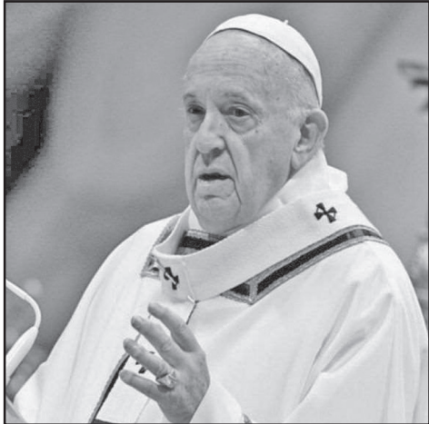
პაპმა ხანია მიაღწიეს.

იმის დასტურად, რომ კორონავირუსთან ერთად ზნეობრივად აზიანებს, რომის პაპის ამასწინანდელი განცხადებაც გამოდგება. „ერთი და იგივე სქესის ადამიანებს, — თქვა პაპმა ფრანცისკემ, — აქვთ უფლება, შექმნან ოჯახი. ისინი ღვთის შვილები არიან და უნდა ჰქონდეთ უფლება, შექმნან ოჯახი. არაფერ არ უნდა იყოს განვიცხვებული და ამის გამო ტანჯული. საჭიროა, შეიქმნას კანონი სამოქალაქო კავშირებზე და ეს ადამიანებზე იქნებოდეს კანონით დაცული“. ამას ამბობს ადამიანი, რომელიც კათოლიკეებისთვის ღმერთის მოადგილეა დედამიწაზე, პირველი ადამიანი მთელ კათოლიკურ სამყაროში. ეს ის პაპია, რომლის ხელის შესებნაზეც ოცნებობს მილიონობით ადამიანი.