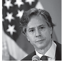
მოამზადა ნიკა თევზაძე

ჯო ბაიდენი აშშ-ის სახელმწიფო მდივანად, სავარაუდოდ - ანტონი ბლინკენს, გაეროში აშშ-ის ელჩად კი ლინდა ტომას-გრინფილდს წარადგენს. ენტონი ბლინკენს აშშ-ის ყოფილი პრეზიდენტის ბარაკ ობამას ადმინისტრაციაში ეროვნული უსაფრთხოების მრჩეველის მოადგილის თანამდებობა ეკავა, ლინდა ტომას გრინფილდი კი ობამას მმართველობის პერიოდში 2013 წლიდან 2017 წლამდე აფრიკის საკითხებში აშშ-ის სახელმწიფო მდივნის თანაშემწედ მსახურობდა.