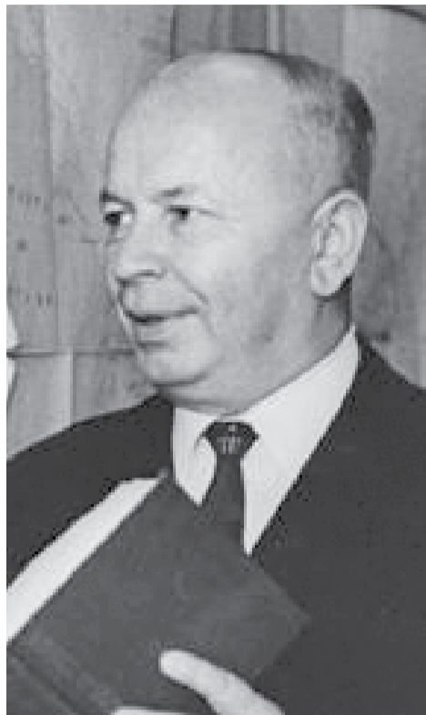
ვადოს ადგილი და როლი ქვეყნის პოლიტიკურ ცხოვრებაში.

თხუთმეტწლიანი კვლევა-ძიების შედეგად მან მონოგრაფიულად შეისწავლა ქართლის ექვსივე სათავადო: ქსნის და არაგვის საერისთავოები, საამილახვრო, სამუხრანბატონო, საციციშვილო და საბარათიანო (ამ უკანასკნელი სათავადოს შიგნით წარმოქმნილი საგვარეულო განშტოებებიც). საკითხის შესწავლას ქართული ფეოდალური ურთიერთობის განვითარების ისტორიის კვლევით იწყებს, რისი საბოლოო შედეგიცაა სათავადოების წარმოქმნა. შეიძლება ითქვას, სრულყოფილია ქართული ფეოდალიზმის ისტორიოგრაფიული მიმოხილვა — ვახუშტი ბაგრატიონით დაწყებული და მის თანამედროვე მკვლევართა შრომებით დამთავრებული. აღსანიშნავია, რომ დავით გვრიტიშვილის ყველა ნაშრომი გამოირჩევა საკითხის ირგვლივ არსებული საისტორიო წყაროებისა და სამეცნიერო ლიტერატურის საფუძვლიანი ცოდნით და ღრმა ანალიზით. აღნიშნულ ნაშრომში დადგენილია ყველა სათავადოს საზღვრები, ტერიტორია, მოსახლეობა, მეურნეობის სახეები, შინაგანი ორგანიზაცია, სოციალური ურთიერთობები, დამოკიდებულება ცენტრალურ ხელისუფლებასთან და მეზობლებთან, სათა-