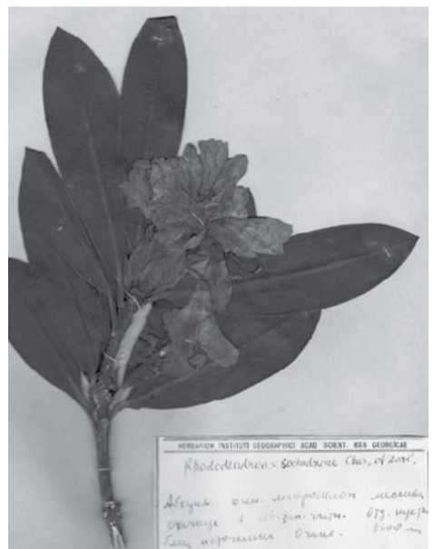
სოხაძის როდოდენდრონი ( Rhododendron Sochadzeae )

ე. სოხაძე გარდაიცვალა 1997 წლის 26 აპრილს თბილისში. ნახევარი საუკუნე ერთგულად ემსახურებოდა ქართულ მეცნიერებას. იყო თვალსაჩინო გეობოტანიკოსი, სიცოცხლის უკანასკნელ დღეებამდე ქმნიდა საინტერესო მეცნიერულ ნაშრომებს.