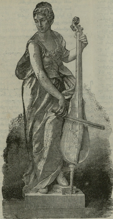
დამკვრელი ქალი (გამოქანდაკება).

ლია, ღვთის და ბატონის წყალობა, რასაც გულით მივადგებით უთუოთ გავიტანოთ. ჰო მართლა, კინაღამ დამაიწყდა, ერთი პატარა ნაკლულევენება ჩვენც გვაქვს: ვერაფერს გულით ვერ მივადგებით და ამიტომ საქმის გატანაც გვიჭირს, არა, არც მართო გვიჭირს, საზოგადოთ საქმეს ვერ ვაკეთებთ, თავს და ბოლოს ვერ ვუვანებთ. აი, მაგ. ბათოში ხომ ქალაქია, და, კი დავემართოს, კი ქალაქი იყოს. ქართველობა იქ სულ ბუზივით ირევა და ჩინებული ბიჭებიც არიან ჩემმა დღემ. საითათოთ მიუშვი რამე საქმეზე და მის სეირს ვაჩვენებს, მარა ის კია, რომ ერთათ ვაკეთებას ნურას მიანდობ. ქრთამი რომ მისცე ხუთმა-ექვსმა ტყუილთ მანაც ერთათ დადებო, არ დადგება. არა გჯერათ? აი, ახლა მოველინა მათ ერთათ დასადგომი საქმე, მარა შენც არ მომიკვდე, ერთი ალთას მიიწევა და მეორე ბალთას. აი რას გეწერენ იქიდან მომავალ ქალაქის არჩევნების შესახებ: „...ქართველები როგორც ჩანს ორ მანაკთ იყოფა: პირველი ახლანდელი თავის ასათიანის მომხრეა, მეორე კი ერთი „მამულიშვილის“ პარტიას ეკუთვნის. ეჭვი არ არის, ქართველობა არ დაყოფოდენ, რომ ორ-გავლენიან „მამულიშვილთ“ მათ ყრბო საქმეზე აყალ-მაყალი არ მოკლდათ.—ხომ მაწყენინე, შეყვირა ერთმა მეორეს, გაუყურებებ შენ სეირს, მადლობა ღმერთს, არჩევნების დროში ქვეყანა არ დექცევა და მაშინ მე ვიცი და შენ...“ როგორ მოგწონს მკითხველო, ეს მაწყენინე-გაწყენინეს პალიტიკა, რომლის მსხვერპლათ ეს დღე-გმირნი თავის საქმეს კი არ იმეტებენ, არამედ საზოგადო საქმეს. მოდი და ამ „მამულიშვილთა“ შემხედვარე ნუ იტყვი: „ჩვენ ისთანა ბედნიერი განა არის სადმე ერთი?“