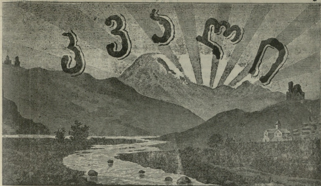
საპოლიტიკო საზენიტრო და სალიტერატურო ნახატობიანი გაზეთი გამომდის ყოველ კვირა ღვს.